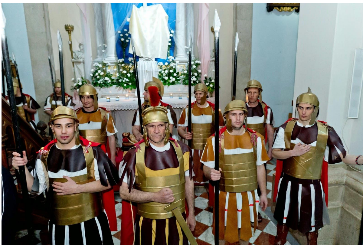
Čuvari Kristova groba (žudije) u Imotskom 90