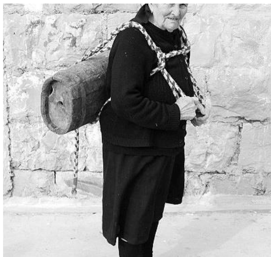
Slika 5. Drvena posuda za nošenje vode zvana vučija 22

Vučije su bile ka drvene bačvice u kojima bi žene, kad bi bilo litnje vrime i vrime suše, išle na neki izvor i u to bi ulile vodu. Onda bi vučiju uprtile na sebe i nosile je kućama. Privezale bi je špagom na leđa da se ne miče i tako šetale do kuće. Ako bunar ne bi prisušija, onda vučije nisu bile potrebne. 21