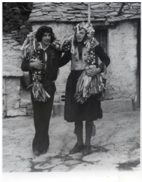
Slika 10. Diver i nevista (1972) 119

Barjaktar je najsnažniji momak zadužen za nošenje barjaka, a obučen je u jačerima s kitama, ima pas, žuti šudar, gaće od sukna i gumaše. Jenge su mlade neudane cure, a neviste udane. Diverovi su neoženjeni muškarci, nose kapu kitaricu, kuparen s pucama tj. tokama i crvenim kitama. Cigani predstavljaju ostatak mačkara. 120