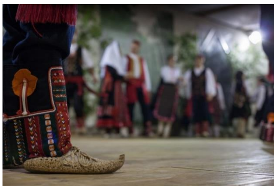
Slika 1. Muška narodna obuća – opanci 9

Žene kad bi išle na dernek ili na misu oblačile su jačerimu, sukno, sadu bez kićenice, na glavu bi stavile svileni šudar. Obukle bi onda brnicu, travešu, a na noge bi stavile opanke i čarape od sukna. A muški su isto nosili košulje bez koleta, kumparan. Oko struka su imali pas u boji, najčešće crveni. Nosili su i gaće od sukna, a na noge bi obuli opanke. 8