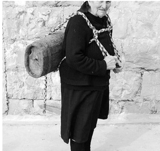
Slika 5. Drvena posuda za nošenje vode zvana vučija 22

Vučije su bile ka drvene bačvice u kojima bi žene, kad bi bilo litnje vrime i vrime suše, išle na neki izvor i u to bi ulile vodu. Onda bi vučiju uprtile na sebe i nosile je kućama. Privezale bi je špagom na leđa da se ne miče i tako šetale do kuće. Ako bunar ne bi prisušija, onda vučije nisu bile potrebne. 21