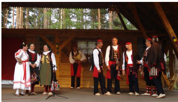
Slika 7. Kud Branimir 888 iz Muća – ožkanje 43

Ja na silo spava moja Kata, Šuverinon zapričila vrata. 42