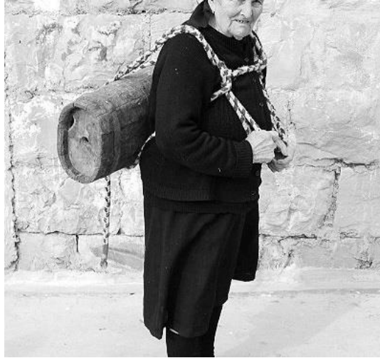
Slika 5. Drvena posuda za nošenje vode zvana vučija 22

Vučije su bile ka drvene bačvice u kojima bi žene, kad bi bilo litnje vrime i vrime suše, išle na neki izvor i u to bi ulile vodu. Onda bi vučiju uprtile na sebe i nosile je kućama. Privezale bi je špagom na leđa da se ne miče i tako šetale do kuće. Ako bunar ne bi prisušija, onda vučije nisu bile potrebne. 21