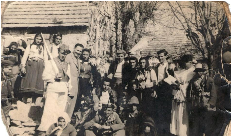
Slika 11. Mučke mačkare iz 1936. godine 122

Za vrijeme mačkarske povorke, palio bi se krnjo. Nakon paljenja krnje, pjevale su se mačkarske pjesme. Sačuvana je maškarska pjesma koja se pjevala na području Muća: