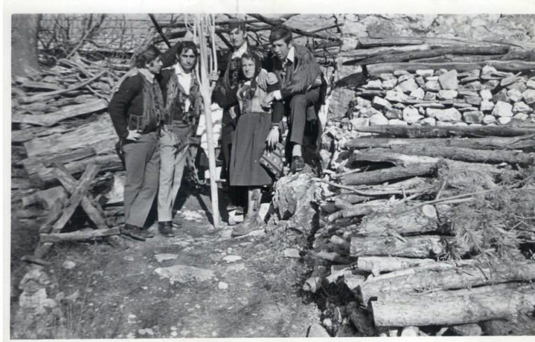
Slika 8. Sječa jablana (Muć Donji) 115

Na Pokladnu nedjelju u središtu svakoga sela oko 11 sati okupljale su se mačkare. Taj sastav činili su: did, babe, vezir, barjaktar, jenge, neviste, diverovi i cigani. Nekada bi i svećenici dolazili u to vrijeme i blagoslovlili mačkarae. Did je vođa mačkara, on je najiskusniji i najstariji čovjek, ima velike povlastice, pa čak i pravo da izbaci one mačkare koje su neposlušne ili se neprikladno ponašaju. Obučen je u ovčji kaput, ima šešir te zvona oko struka. 116