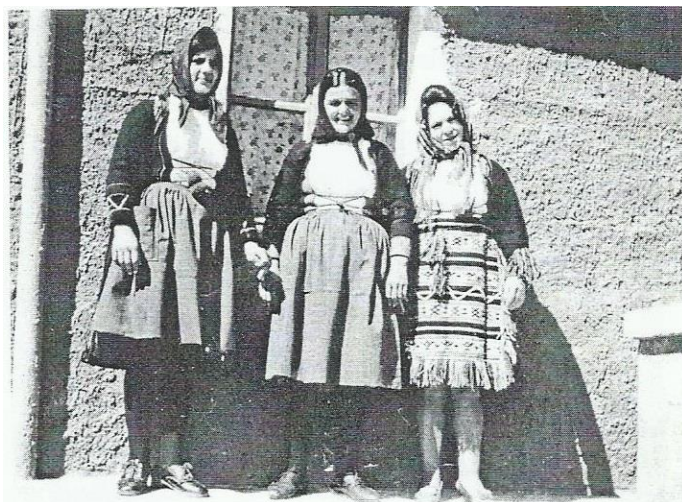
Slika 2. Narodna nošnja 11

Pređa je bila od ovčje vune i od nje bi se radilo puno toga. Plele smo čarape, džempere, guće... 10