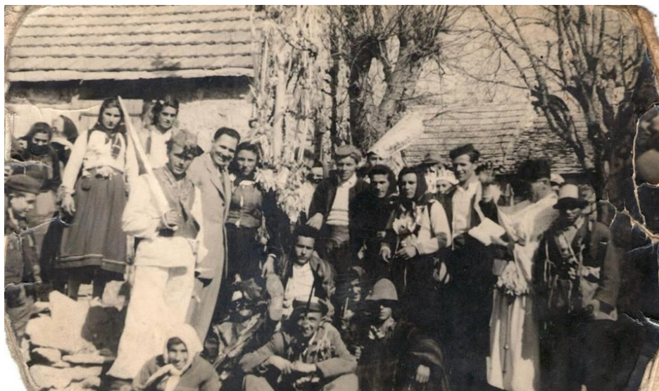
Slika 11. Mučke mačkare iz 1936. godine 122

Za vrijeme mačkarske povorke, palio bi se krnjo. Nakon paljenja krnje, pjevale su se mačkarske pjesme. Sačuvana je maškarska pjesma koja se pjevala na području Muća: