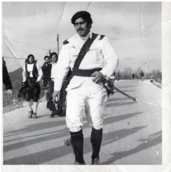
Slika 9. Vezir (Muć Donji) 118