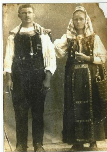
Slika 3. Obitelj Šunjić, 1917.g. 12