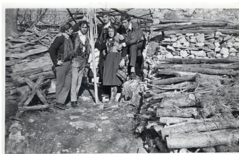
Slika 8. Sječa jablana (Muć Donji) 115

Na Pokladnu nedjelju u središtu svakoga sela oko 11 sati okupljale su se mačkare. Taj sastav činili su: did, babe, vezir, barjaktar, jenge, neviste, diverovi i cigani. Nekada bi i svećenici dolazili u to vrijeme i blagosloveli mačkarae. Did je vođa mačkara, on je najiskusniji i najstariji čovjek, ima velike povlastice, pa čak i pravo da izbaci one mačkare koje su neposlušne ili se neprikladno ponašaju. Obučena je u ovčji kaput, ima šešir te zvona oko struka. 116