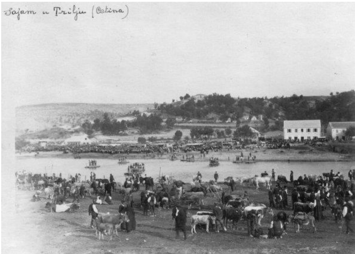
Stočni sajam u Trilju 28