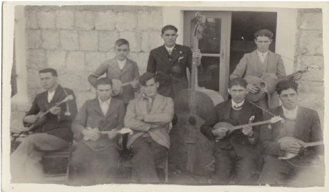
Momci sa tradicionalnim instrumentima 26

Ucvili ću svoju staru nanu, Što joj neću otić po danu. Ja noseća, neću više kriti, Kolegice kuma ćeš mi biti. Udat ću se neće dugo biti, Jednu večer ću se umaknuti. Vinčaj pope i posveti dušu, Sutra mala ide u grabušu. Vinčaj pope prigoda je taka, Očeš, nećeš ja san je umaka. 25