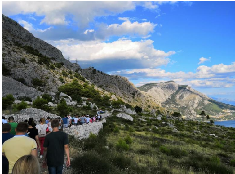
Procesija koja kreće za Gospinim kipom i ide prema brdu Stomorica do crkvice.