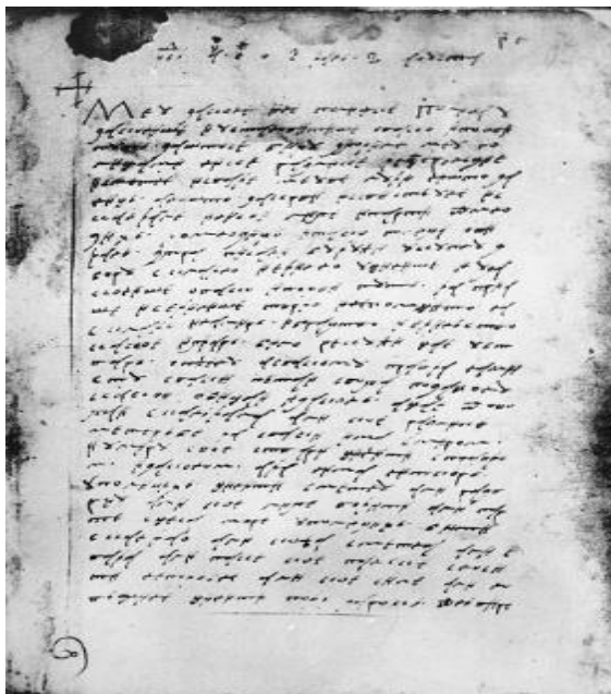
Poljički statut, rukopis nastao poč. XVI. st., Zagreb, Arhiv HAZU.

101. Općinski putovi moraju biti slobodni za svakoga kako određuje zakon, a veliki općinski put kroz župu mora biti širok jednu rozgu. A soeski put gonik, taj mora biti toliko širok da mogu njime hodati dva vola u jarmu. Nitko ne smije suzivati put ili ga premjestiti drugamo bez dopuštenja općine ili suda. 19