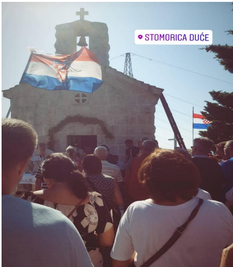
Stomorica, kolovoz 2019. godine. Sveta misa.