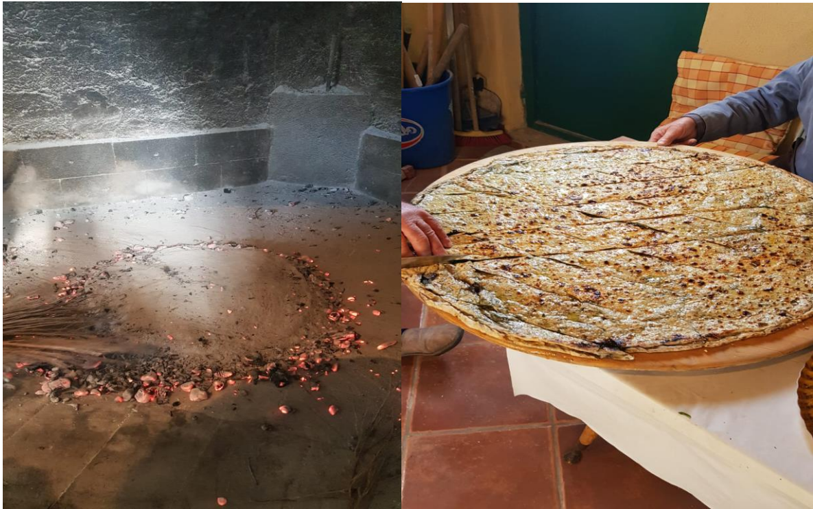
Soparnik, Duće, 2019. godina.

Na Badnjak su i djeca imala svoj zadatak. Ona su unosila slamu u kuću te bi se po njoj valjali i igrali tri dana, odnosno do blagdana Mladenaca, tada bi se slama iznosila vani. 42 Ovi običaji nisu se zadržali do naših dana te se danas slama koristi samo kao ukras u jaslicama, a na stol se stavlja adventi vijenac. Braica navodi da običaj adventskog vijenca dolazi sa sjevera (širi se iz područja Hamburga u Njemačkoj u 19. stoljeću), a preko srednje Europe i do naših krajeva gdje se udomaćio u zadnje vrijeme, prvenstveno zato jer ima mnogo dodirnih točaka sa našim tradicijskim ukrašavanjem zelenilom. 43 U pšenicu, koja je posađena na svetu Luciju, stavlja se blagoslovljena svijeća koja se pali za vrijeme objeda. Dragić navodi da ovakvi običaji stavljanja grančica masline, božikovine, kadulje, lovora, iznad ulaznih kućnih vrata simboliziraju želju za blagostanjem u nadolazećoj godini, a zelenilo, po narodnom vjerovanju, odgoni demonske sile. Poljičani i danas vjeruju da što je pšenica gušća i veća, to će predstojeća godina biti uspješnija za tu obitelj.