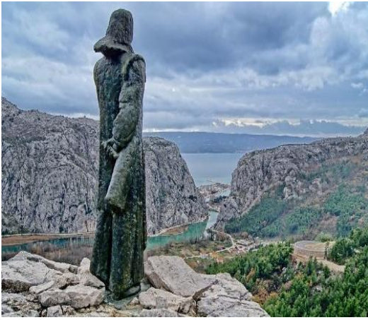
Meštrovićeva statua Mile Gojsalić, Gata.