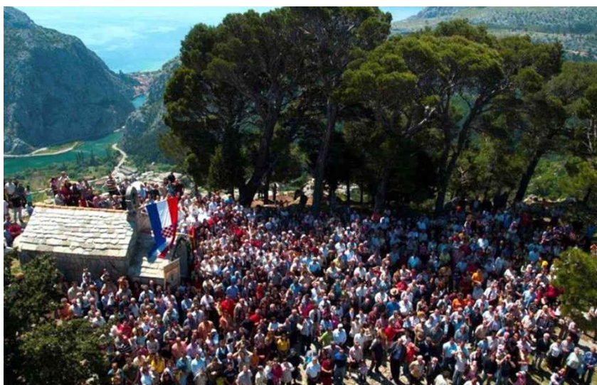
Jurjevo, Gradac, 2018. godina