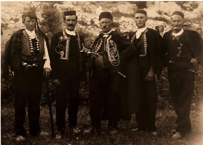
Biranje kneza, Poljica

Čestito vam Jurjev danak Jurjev danak vaš sastanak. Pčele sunca zastupile dvore Na dobro vam Jurjev danak doša Bile ovce napunile to Na dobro vam Jurjev danak doša A brodi vam izorali more Na dobro vam Jurjev danak doša Poljičani poštovani Od svih sela odabrani Čestito vam Jurjev danak Jurjev danak vaš sastanak.“