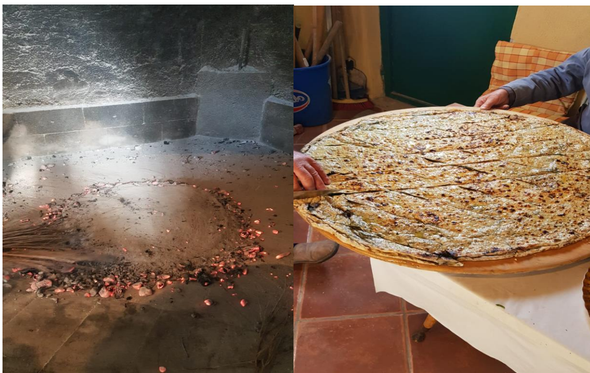
Soparnik, Duće, 2019. godina.

Na Badnjak su i djeca imala svoj zadatak. Ona su unosila slamu u kuću te bi se po njoj valjali i igrali tri dana, odnosno do blagdana Mladenaca, tada bi se slama iznosila vani. 42 Ovi običaji nisu se zadržali do naših dana te se danas slama koristi samo kao ukras u jasticama, a na stol se stavlja adventi vijenac. Braica navodi da običaj adventskog vijenca dolazi sa sjevera (širi se iz područja Hamburga u Njemačkoj u 19. stoljeću), a preko srednje Europe i do naših krajeva gdje se udomaćio u zadnje vrijeme, prvenstveno zato jer ima mnogo dodirnih točaka sa našim tradicijskim ukrašavanjem zelenilom. 43 U pšenicu, koja je posađena na svetu Luciju, stavlja se blagoslovljena svijeća koja se pali za vrijeme objeda. Dragić navodi da ovakvi običaji stavljanja grančica masline, božikovine, kadulje, lovora, iznad ulaznih kućnih vrata simboliziraju želju za blagostanjem u nadolazećoj godini, a zelenilo, po narodnom vjerovanju, odgoni demonske sile. Poljičani i danas vjeruju da što je pšenica gušća i veća, to će predstojeća godina biti uspješnija za tu obitelj.