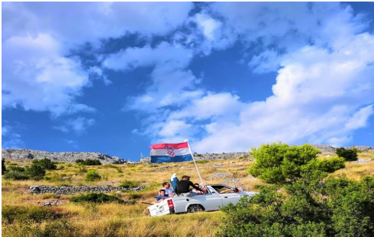
Dučani nose Gospin kip iz Crkve svetog Ante Padovanskog i Gospe Snježne prema Starom Selu Duće. Kolovoz, 2019. godine.

Tebe ponosno časti u mjestu svaka kuća, o Majko naša; zaštitnice Duća. 83