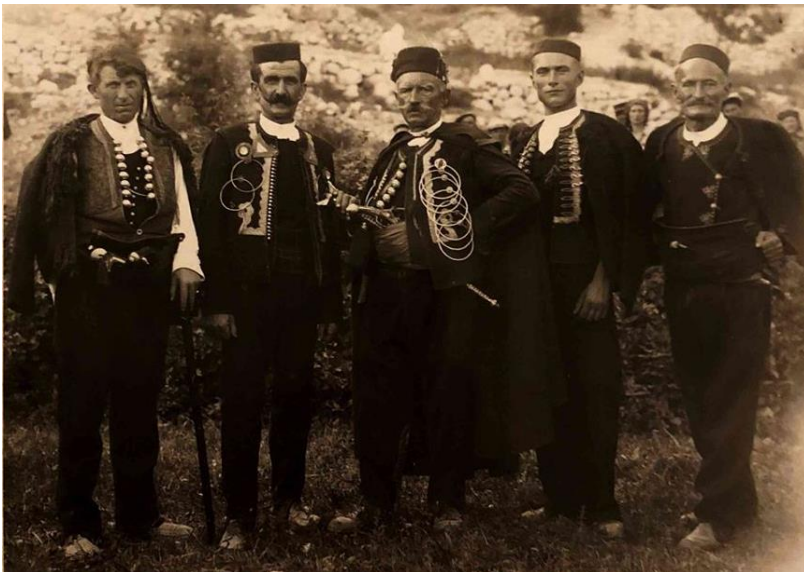
Biranje kneza, Poljica

Čestito vam Jurjev danak Jurjev danak vaš sastanak. Pčele sunca zastupile dvore Na dobro vam Jurjev danak doša Bile ovce napunile to Na dobro vam Jurjev danak doša A brodi vam izorali more Na dobro vam Jurjev danak doša Poljičani poštovani Od svih sela odabrani Čestito vam Jurjev danak Jurjev danak vaš sastanak.“