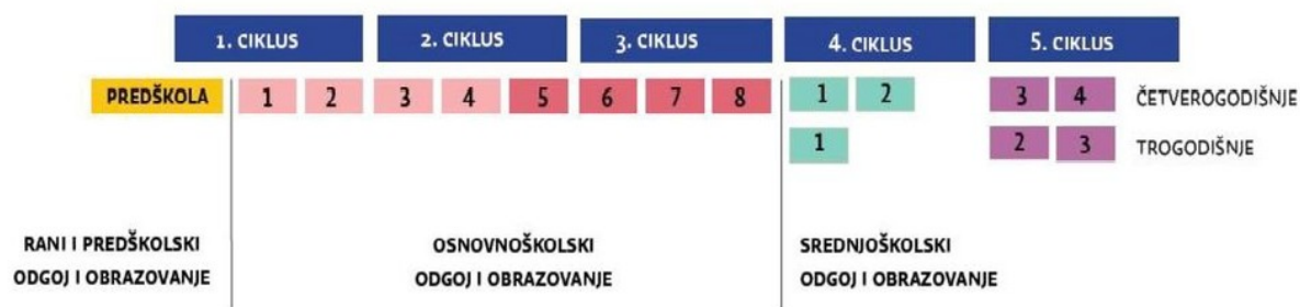
Slika 1. Ciklusi osnovnoškolskog odgoja i obrazovanja (Nacionalni okvirni kurikulum, 2017)

U odgojno-obrazovnoj vertikali određeno je 5 odgojno-obrazovnih ciklusa (Slika 1.), i to su: 1. ciklus – 1. i 2. razred osnovne škole; 2. ciklus – 3., 4. i 5. razred osnovne škole; 3. ciklus – 6., 7. i 8. razred osnovne škole; 4. ciklus – 1. i 2. razred četverogodišnjih; 1. razred trogodišnjih srednjoškolskih programa; 5. ciklus – 3. i 4. razred četverogodišnjih; 2. i 3. razred trogodišnjih srednjoškolskih programa (Nacionalni okvirni kurikulum, 2017).