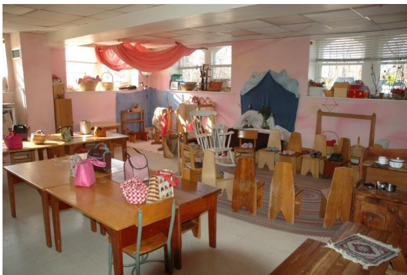
Slika 7. Uređenje sobe dnevnog boravka

Prostor dječjeg vrtića tretiran je tako da u djeci razvija osjećaj za red, sklad, ritam i harmoniju. Materijali i boje su korišteni na način da u djeci razvijaju sigurnost i toplinu, ugodnu i pristupačnu sredinu za njihov rast i razvoj (Honigblum, 2017). Prostor i materijali u njemu moraju biti prilagođeni djeci na način da oni mogu imitirati svakodnevni život jer je Rudolf Steiner smatrao da je zadaća odgajatelja omogućiti djeci učenje kroz imitaciju i iskustvo (najbolji način učenja prema Steineru).