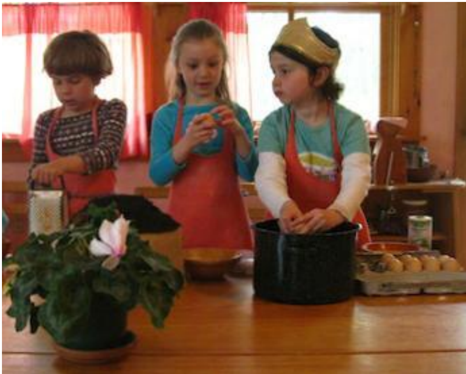
Slika 4. Djeca u aktivnosti kuhanja

Nakon slobodne igre se djeca okupljaju i zajedno pjevaju prilikom čišćenja sobe dnevnog boravka. Rudolf Steiner zalagao se za zajedništvo te izbjegavanje razvijanja natjecateljskog duha kod djece (Gotovac, 2009). Svako dijete je individualno za sebe sa svojim duhom i dušom te se u skladu s unutarnjim stanjem razvija i raste te koristi igru na tom „putovanju“ (Honigblum, 2017) stoga se ne smije sputavati slobodna igra djeteta. Po završetku slobodne igre važno je naglasiti kako djeca po primjeru odgajatelja čiste radni prostor. Tako djeca rade još jednu od svakodnevnih aktivnosti koja doprinose njegovom unutarnjem redu i skladu.