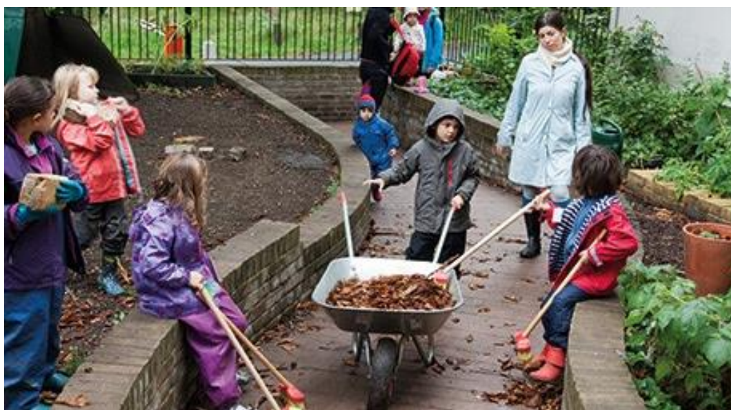
Slika 6. Djeca u aktivnostima na otvorenome

Ručni rad je veoma zastupljen u radu s djecom u Waldorfskom vrtiću. Prisutan je u sobi dnevnog boravka, ali i na otvorenome. Prvenstveno počinje u vrtu i aktivnostima na otvorenome (rad u vrtu i oko vrta koristeći grančice, užad i škare) . Ručni je rad integriran jednim dijelom s pričanjem bajka i predstavama jer djeca sama i/ili s odgajateljima izrađuju lutke i kulise. Češljaju vunu, šiju, koriste iglu i konac za svoje umjetničko djelo s kojim će kasnije istraživati svijet bajki.