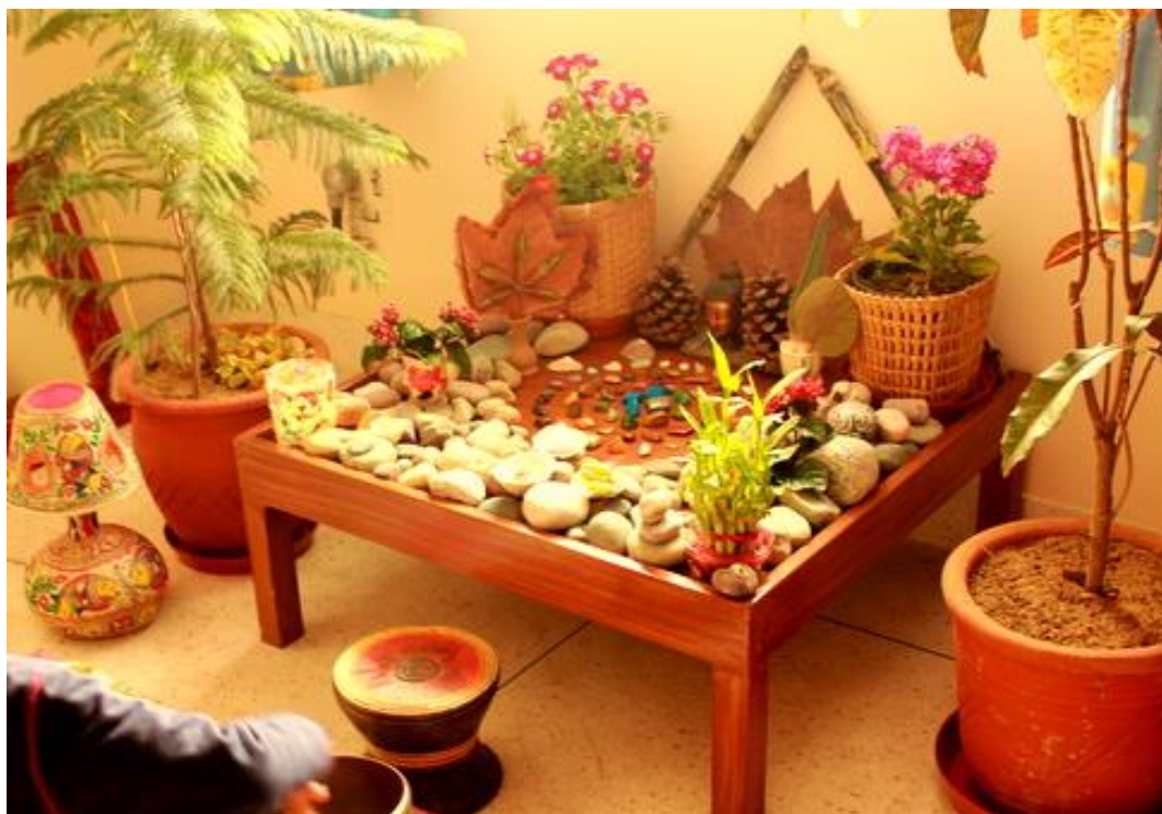
Slika 3. Jesenski svetkovni stol