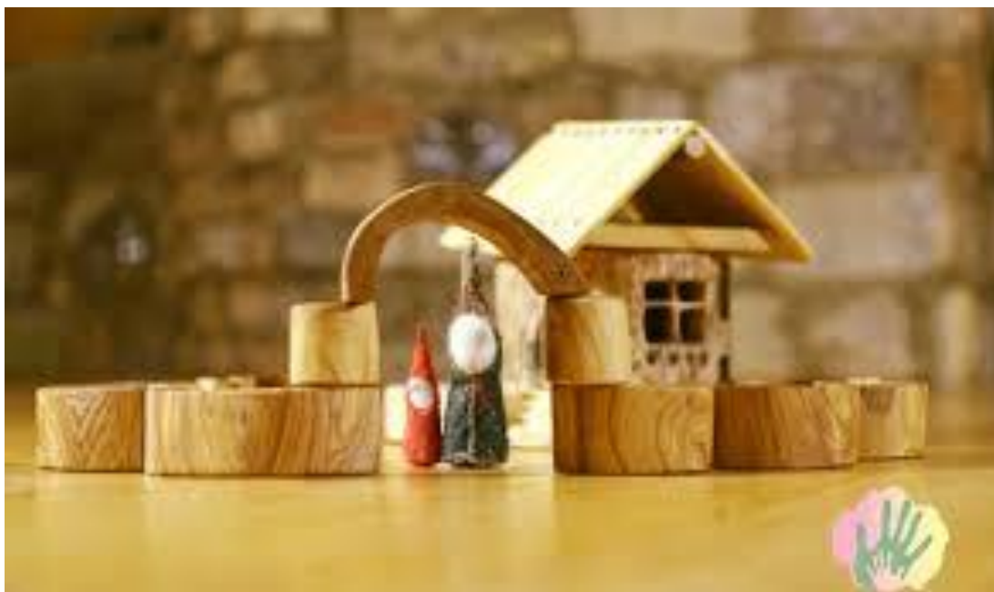
Slika 5. Oblici od prirodnih materijala

Steiner je smatrao kako materijali ne smiju zaglušiti dijete. Previše materijala, preuređenih i jednonamjenskih nije stimulirajuće za dijete. Materijali bi trebali biti što izvorniji, prirodni i jednostavni oblici za višenamjensko istraživanje.