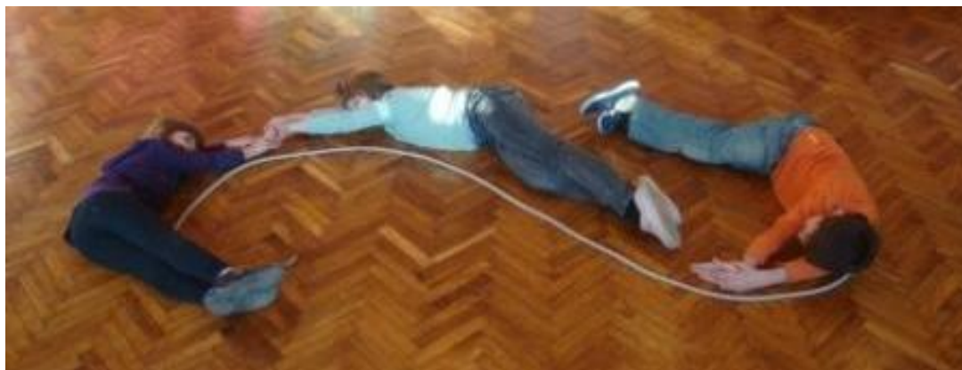
Slika 2. Euritmija

Ritam ima smisao u waldorfskoj pedagogiji. Aktivnosti i djelovanja prožeta su ritmom, a najsnažnije se to vidi u euritmiji (Jagrović, 2007; Matijević, 2001; Rudolf Steiner Web, 2019). Euritmiju je osmislio Rudolf Steiner sa svojom drugom ženom, a to je umjetnost osobitih pokreta koji ovise o kvaliteti glasa i tona (Carlgren, 1991).