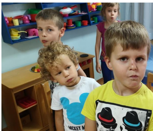
Slika 8 Čisti zubi