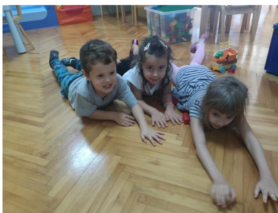
Slika 9 Imitacija zmije