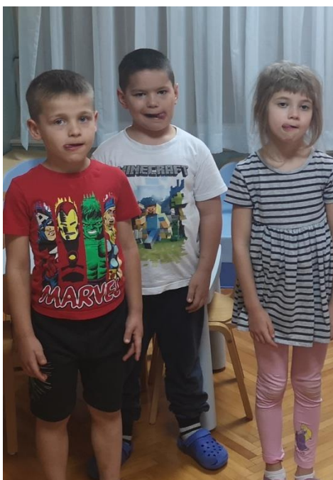
Slika 5 Vježba za usne i jezik