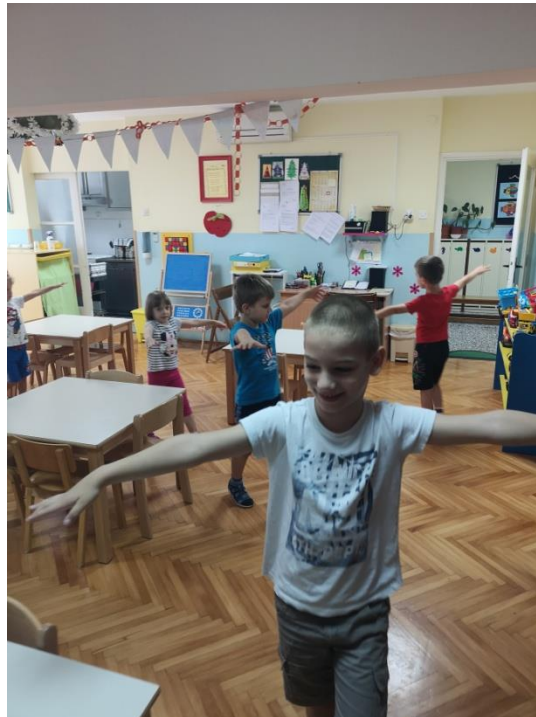
Slika 10 Pčela