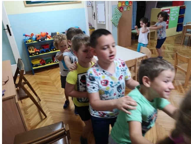
Slika 11 Parni stroj