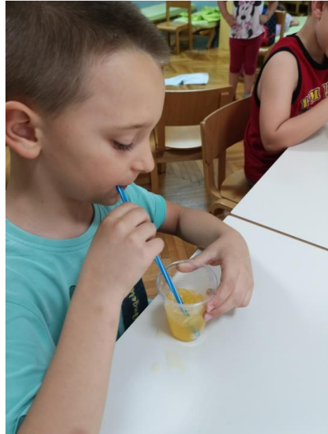
Slika 4 Puhanje slamkom