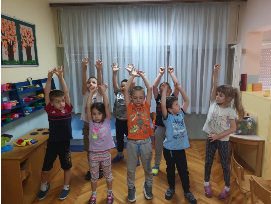
Slika 2 Vježbe istezanja trupa