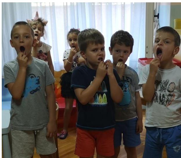
Slika 7 Garaža