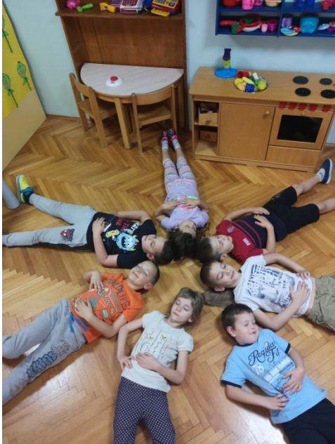
Slika 3 Vježba disanja Balon