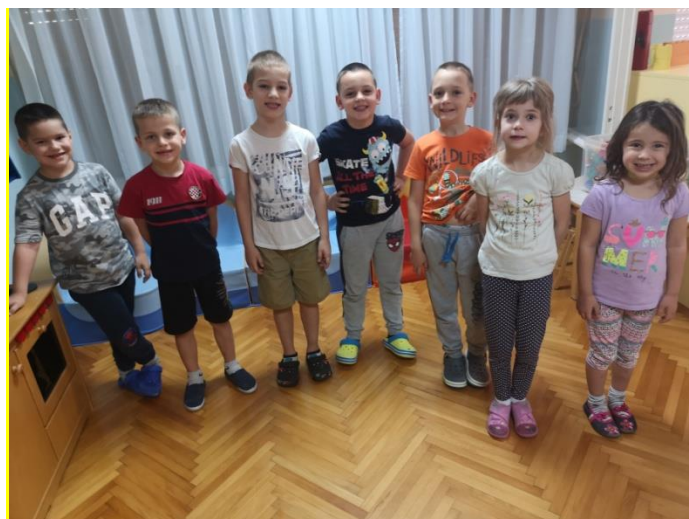
Slika 6 Osmijeh