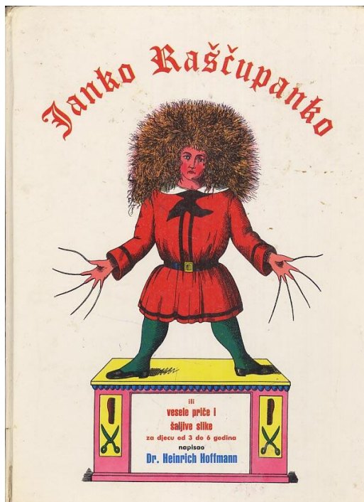
Slika 1. Ilustracija Janka Raščupanka

pohvale, naišla i na mnoge kritike jer su u slikovnici dječja ponašanja ali i kazne za ta ponašanja bile preuveličane pa su mnogi pedagozi isticali da bi Struwwelpeter (Janko Raščupanko) mogao potaknuti djecu na nepodopštine odnosno čitanje o pretjeranom kažnjavanju moglo bi izazvati traume (Majhut i Batinić, 2017).