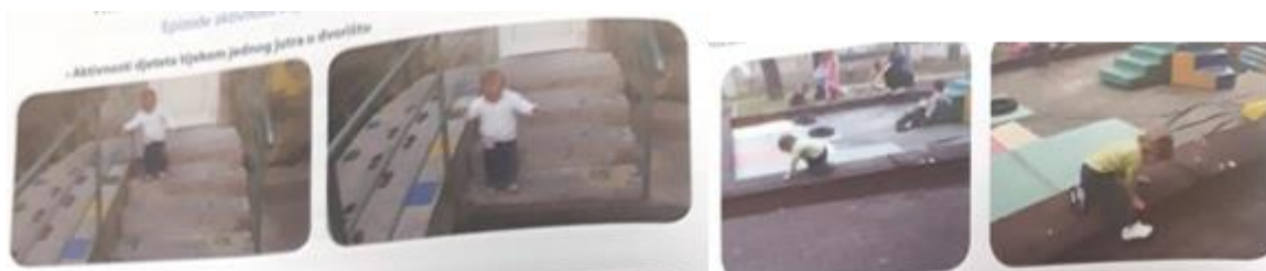
Slika 2. Vanjski prostor (Slunjski, 2008:34, 36)

Kretanje je iznimno prisutno kod djece jasličke dobi. Neovisno o tome uče li tek hodati, puzati ili su već savladali sile gravitacije, kretanje je važno za unapređenje percepcije, intelektualni i cjelokupni psihosomatski razvoj, otkrivanje sebe i okoline te sagledavanje i orijentaciju u prostoru (Došen-Dobud, 2004). „U većini jaslica i predškolskih ustanovama postoje i divno oblikovani parkovi s dječjim toboganima, mogućnostima za penjanje, kolicima i još mnoštvo toga“ (Schäfer, 2015,57). Dječji vanjski prostori mogu biti opremljeni ljuljačkama ili prostorima za igru s pijeskom, toboganima ili drugim materijalima koji potiču djecu na igru i kretanje. Vanjski prostor je potrebno osigurati za boravak djece jasličke dobi, omogućiti im prostor gdje mogu puzati bez opasnosti od sudaranja s djecom koja hodaju i trče. Potrebno je ukloniti opasne materijale i često provjeravati sigurnost i ispravnost sprava u dvorištu. Poželjno je da površina igrališta bude prekrivena materijalom koji će ublažiti posljedice pada (Stokes Szanton, 2005) i spriječiti djecu da stavljaju rasute materijale u usta. Dvorište treba biti ograđeno, a ako sadrži vodenu površinu ona također treba biti ograđena.