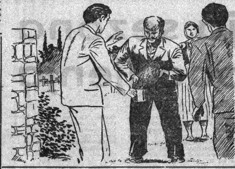
Isječak iz novinskog članka o ravčanskom običaju