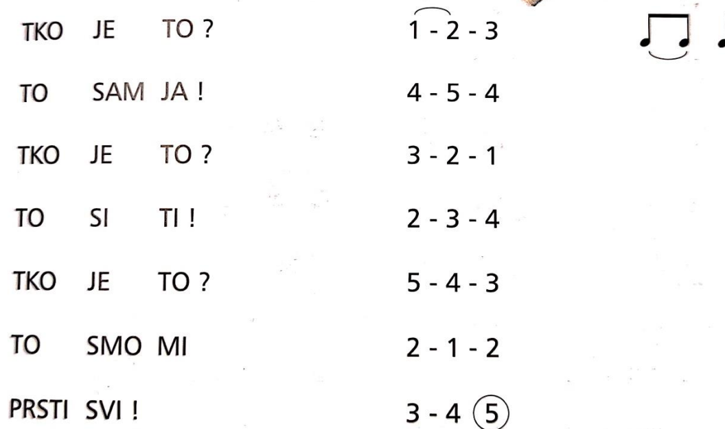
Slika 2. Primjer brojalice praćen motoričkom igrom prstima (Šmit, 2001: 83)