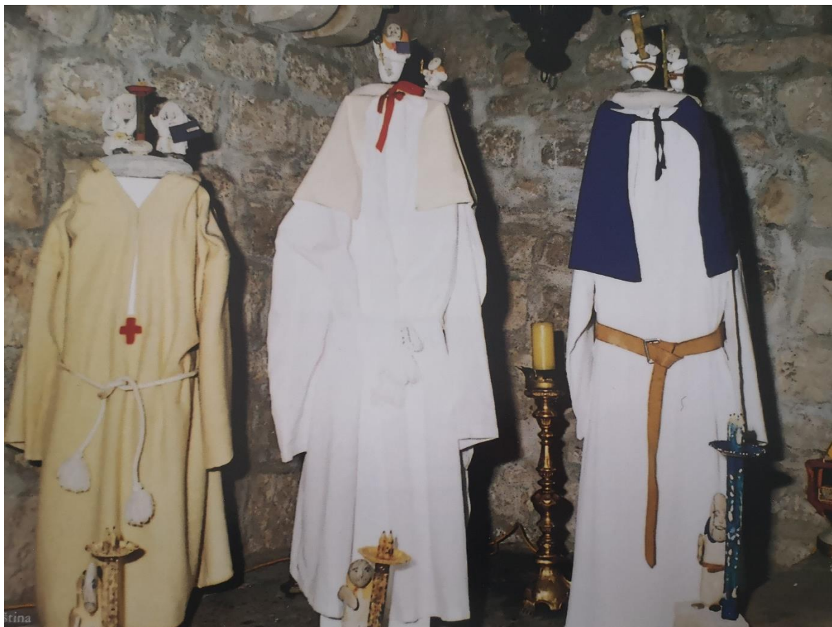
Slika 9: Bratovština Svih Svetih, Sv. Roka i Gospe od pojasa 19

vrijednih predmeta koje posjeduje bratovština ističu se veliki srebrni križ koji stoji na koplju bratovštinskog barjaka te srebrna ploča tzv. pacifikal (Fazinić, 2018).