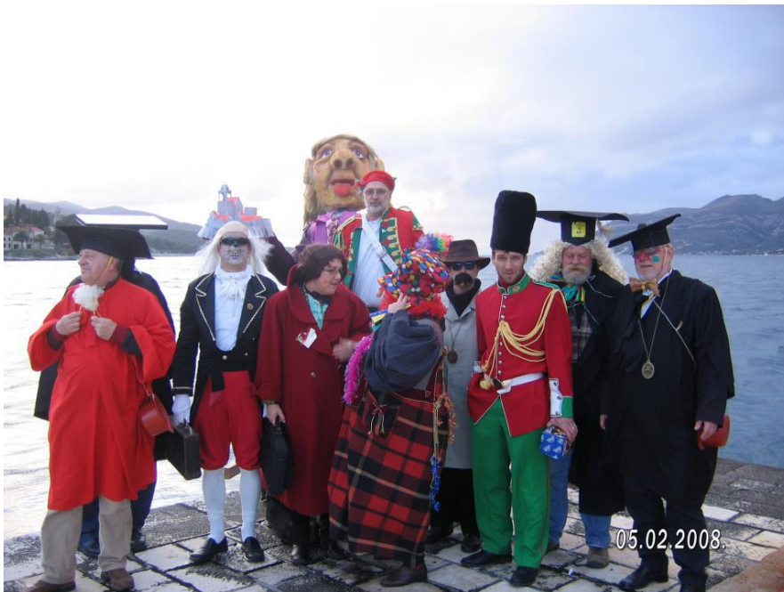
Slika 2: Časni sud 9