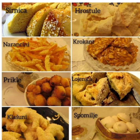
Slika 7: Tradicionalna jela grada Korčule 17

Običaji i tradicionalna jela su nerazdvojni, a Korčulani su poznati po tome da su pravi gurmani i veseljaci te su dobili nadimak Bonkulovići. Korčulanska kuhinja je raznolika, zdrava i jednostavna. Tradicionalna su se jela sačuvala na Korčuli kao malo gdje na našoj obali i otocima. Poznati recept za pripremanje murine i miješane ribe na više načina, a posebno na crveno s umakom od rajčica je brudet . Jela bez kojih su nezamislivi blagdani i slavlja su panada (brsta juhe od kruha) koja se inače priprema na Badnji dan i Veliki petak kao strogo posno jelo i bakalar za vrijeme berbe grožđa i u Korizmi (Gjivoje, 1968). Od slastica su se spremale lojenice , sirnice , prikle , hrostule , spomilje , cukarini , klašuni , krokant , narancini i mnogi drugi. Svaka fešta (slavlje) bila je nezamisliva bez ovih tradicionalnih jela i domaćeg vina u kojem su građani grada tj. Bonkulovići uživali i gostili se do ranih jutarnjih sati. Neizostavan dio kojim bi vas domaćin počastio kada dođete u goste, suhe su smokve punjene mindelom (badenom) i bićerin (mala čašica za alkohol) domaće rakije od ruža. Ta crta strastvenog gurmanstva vidljiva je i u tome da su nazivi pojedinih jela i danas prisutni u mnoštvu uzrečica. Na primjer: „Nije ljubav juha od hubotnice” što je u prenesenom značilo da se ljubav ne odbacuje i da ju se treba čuvati jer je juha od hobotnice bila beskorisna te se bacala.