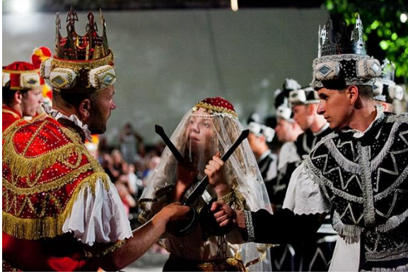
Slika 8: Moro in dentro 18