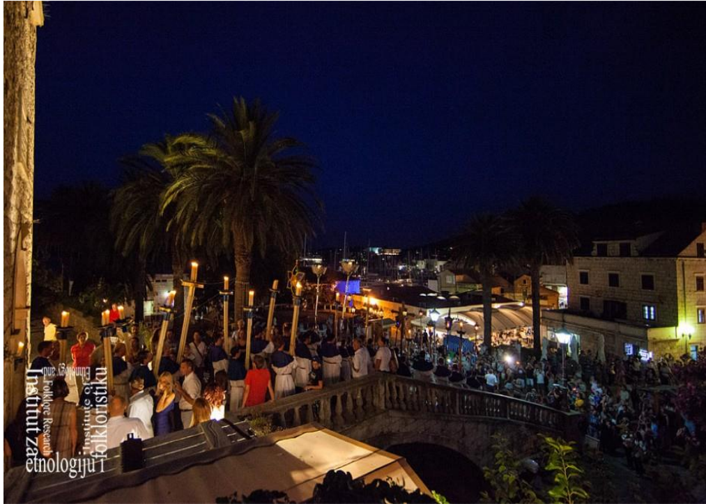
Slika 6: Sv. Todor 13