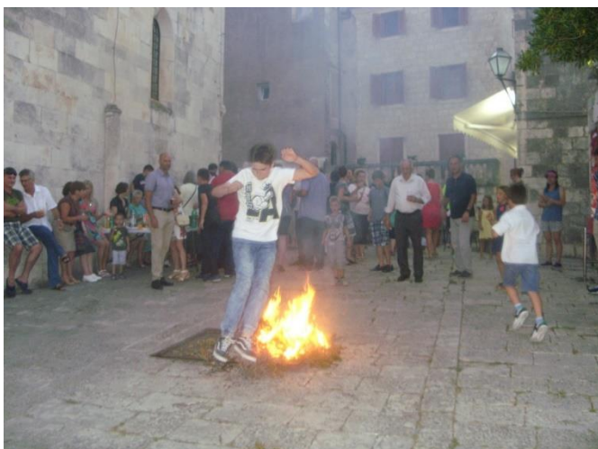
Slika 5: Preskakanje baldakina 12