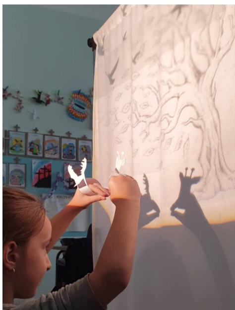
Slika 6. Istraživanja svjetla i sjene https://images.app.goo.gl/PBrJwByAY7mqNdsi6

Autorica Slunjski (2006) prikazuje nekoliko aktivnosti koje djeci mogu biti poticaj za promatranje svjetla i sjene i za djelovanje s njima. Za jednu od takvih aktivnosti potreban materijal su karton, škare, ljepljivo, plahta ili nekakva tkanina za paravan te izvor svjetla. Potrebno je od kartona izrezati različite oblike te napraviti improvizirani paravan od komada tkanine iza kojeg je potrebno postaviti neki od izvora svjetlosti (lampu ili ručnu bateriju). Djeca mogu iza paravana zadavati oblike koje će djeca ispred paravana imenovati dok promatraju njihovu sjenu na platnu.