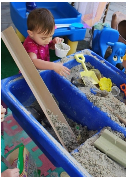
Slika 3. Istraživana pijeska https://images.app.goo.gl/YgpqXr45vym3BXUy5