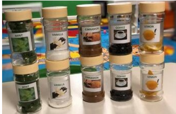
Slika 7. Mirisne bočice

Ista autorica prikazuje još jednu aktivnost koja je poticaj dječjem istraživanju mirisa. Za njezino ostvarivanje potrebni su komadi kartona, uzorci različitih mirisnih materijala iz dječjeg okruženja i kućanstva te fotografije tih materijala. Na kartonske kartice je potrebno zalijepiti uzorke različitih mirišljavih materijala te uz njih fotografije istih materijala. Poželjno je da na fotografijama budu materijali u izvornom izdanju, prije obrade za konzumaciju te za lijepljenje materijala i fotografija koristiti ljepilo bez mirisa kako ne bi utjecalo na dječji doživljaj ponuđenih materijala. Nuđenje ovako pripremljenih kartica djeci nudi mogućnost doživljaja istih njuhom i vidom te proširivanje spoznaje i iskustva o njima. U svrhu nadograđivanja navedene istraživačke aktivnosti moguće je izraditi za svaki materijal dvije iste kartice te će ih djeca na taj način moći koristiti i za igru uparivanja (memory).