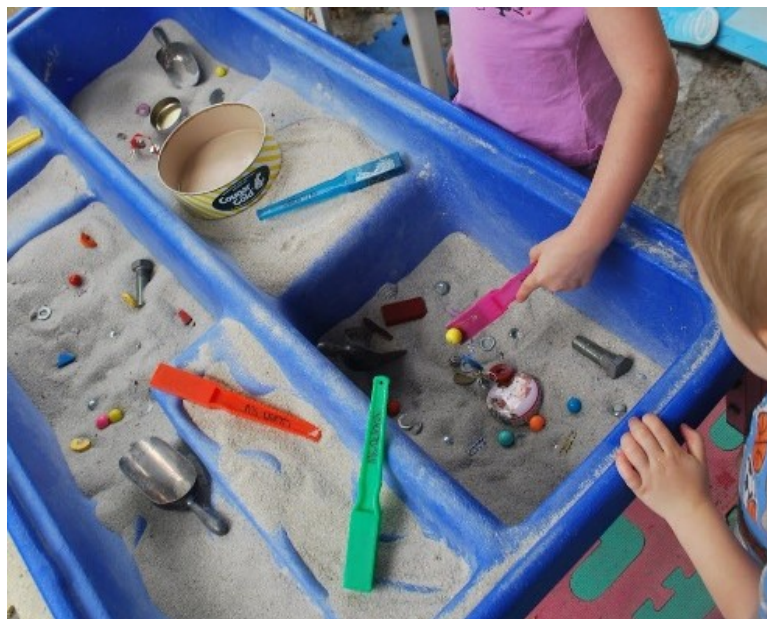
Slika 4. Istraživanja magneta u pijesku https://images.app.goo.gl/xX2TFCjvoMgxc9DKA

Neki od materijala koje je moguće ponuditi za ovako dječje istraživanje su različiti metalni i nemetalni predmeti, plastični, drveni te se u istraživanje može uključiti bilo koji predmet iz djetetova okruženja. Treba naglasiti da bi se među ponuđenim materijalima trebali naći materijali različitih svojstava, to jest materijali koje magnet privlači ali i one koje ne privlači kako bi dijete to moglo samostalno istražiti. Poželjno je ponuditi i magnete različitih oblika i veličina kako bi se mogućnosti istraživanja proširile. Treba voditi računa o zaštiti djece prilikom nuđenja oštih i teških predmeta.