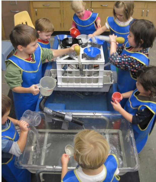
Slika 2. Istraživanja vode https://images.app.goo.gl/MDLxvg2X8Jgeh5af7

Pijesak je uz vodu djeci najprivlačniji prirodni element. Na njega se može lakše izravno djelovati nego na vodu. „Rastresit, neizbrojiv materijal kakav je pijesak, sitniji ili nešto krupniji, za djecu je gotovo jednako zanimljiv, umirujući, prohodan kroz prste ruke i kroz različite šuplje otvore kao i voda, a opet drugačiji“ (Došen-Dobud, 2005: 181). On ima nekih sličnosti s vodom, kao što se ona ulijeva, izljeva, preljeva tako se i pijesak sipa, presipa, prospe. Ista autorica ističe višeznačnu vrijednost pijeska. On je element opuštanja kao i sredstvo poticanja dječjeg razvoja.