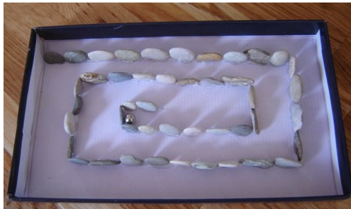
Slika 5. Labirint za istraživanje magnetizma

pojedinačnih, katkad egocentrično prepoznatih manipulativnih istraživanja, s mogućnošću slučajnih otkrivanja“ (Došen-Dobud, 2016: 268). Starija djeca razvrstavaju materijale na temelju kriterija privlačenja i ne privlačenja te na temelju odbijanja ili neodbijanja u određenim uvjetima. U svrhu dokumentiranja procesa i aktivnosti istraživanja moguće je izraditi plakat za bilježenje materijala koje magnet privlači i koje ne privlači. Nadalje, moguće je kao poticaj za istraživanje magneta i magnetizma izraditi labirint od kartonske ploče ili kutije. Djeca će metalnu lopticu voditi do cilja uz pomoć magneta s donje strane ploče.