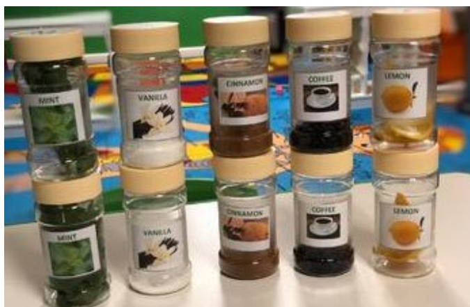
Slika 7. Mirisne bočice https://images.app.goo.gl/sS9Ymi2RGmJbqEBR6

Ista autorica prikazuje još jednu aktivnost koja je poticaj dječjem istraživanju mirisa. Za njezino ostvarivanje potrebni su komadi kartona, uzorci različitih mirisnih materijala iz dječjeg okruženja i kućanstva te fotografije tih materijala. Na kartonske kartice je potrebno zalijepiti uzorke različitih mirišljavih materijala te uz njih fotografije istih materijala. Poželjno je da na fotografijama budu materijali u izvornom izdanju, prije obrade za konzumaciju te za lijepljenje materijala i fotografija koristiti ljepilo bez mirisa kako ne bi utjecalo na dječji doživljaj ponuđenih materijala. Nuđenje ovako pripremljenih kartica djeci nudi mogućnost doživljaja istih njuhom i vidom te proširivanje spoznaje i iskustva o njima. U svrhu nadograđivanja navedene istraživačke aktivnosti moguće je izraditi za svaki materijal dvije iste kartice te će ih djeca na taj način moći koristiti i za igru uparivanja (memory).