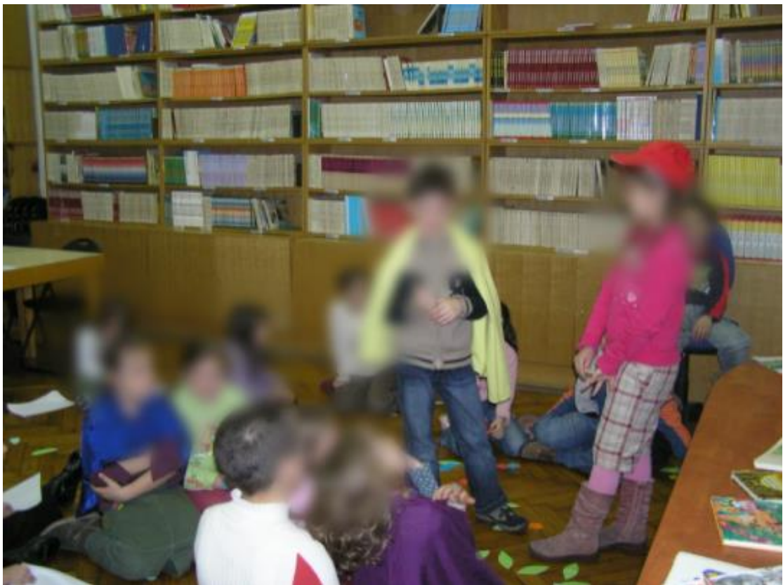
Slika 8. Maslačak i bubamara