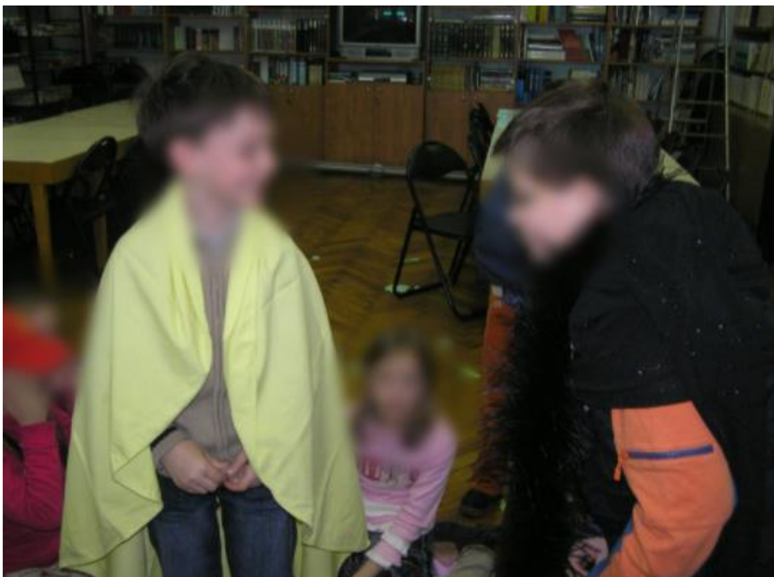
Slika 9. Maslačak i pauk