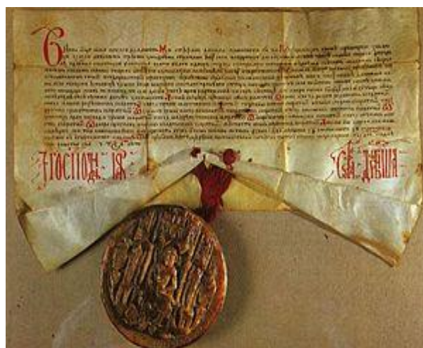
Slika 2 Darovnica bosanskog kralja Stjepana Dabiše kćeri Stani

Nadalje, o postojanju srednjovjekovnog ljubušskog kraja kao i o njegovu razvoju govori nam i humačka ploča iz 11./12. st. koja svjedoči kako je se i na tim prostorima razvijala glagoljska i ćirilična pismenost.