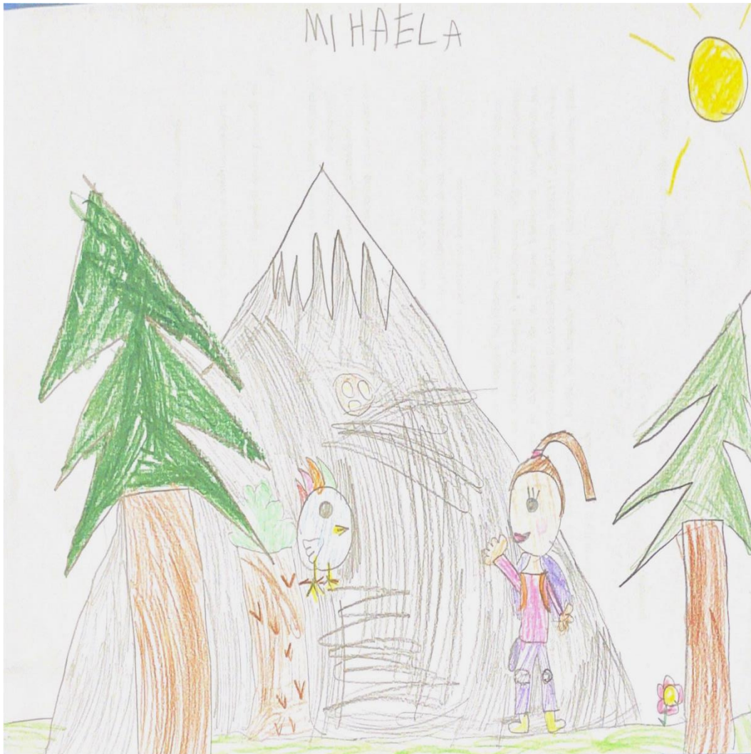
Slika 8. M.B.

Kada joj je potrebna pomoć obraća se starijima koji se nalaze u njoj okolini. Kada mi je potrebna pomoć pitam starije kao što je teta, mama ili tata. Nakon što je djevojčica završila razgovor s odgojiteljicom, odgojiteljica joj pruža poticaj da nacrtá ono što želi prema vlastitom nađođenju.