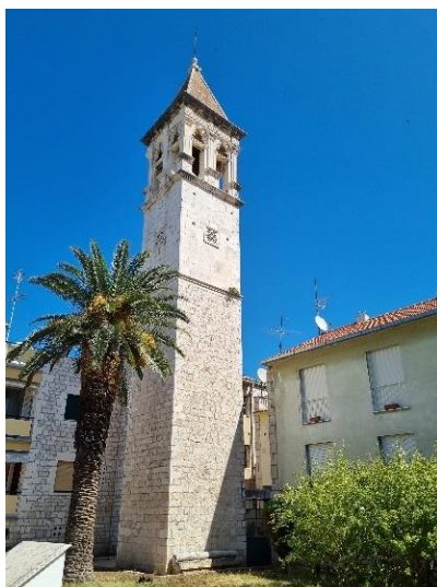
Slika 2. Današnji izgled zvonika sv. Mihovila u Trogiru

Takav je projekt i gradnje župne crkve u Blizni o čemu doznajemo iz objavljenog znanstvenog rada naziva Prilog poznavanju crkve sv. Marije u Blizni kojeg potpisuju Lovorka Čoralić i Ivana Prijatelj Pavičić. Autorice spominju kako Državni arhiv u Zadru čuva spise o gradnji crkve u Blizni, a koji također bilježi podatak o graditeljskom udjelu obitelji Macanović. Radi se o selu smještenom u Dalmatinskoj Zagori koje je zaživjelo nakon tursko-mletačkih ratova. Nacrt nove crkve potpisuje Ivan Krstitelj Nutrizio iz Trogira, a njezina gradnja započinje 1745. godine. 35