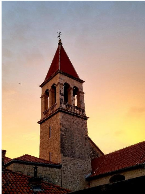
Slika 32. Zvonik crkve Gospe od Pojišana u Splitu