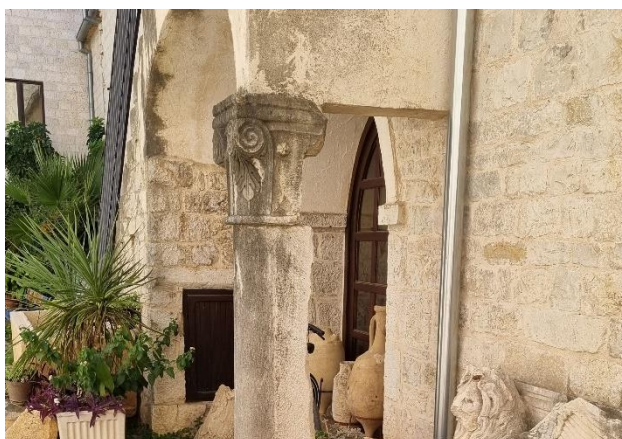
Slika 21. Gotički stup kao nosač stepeništa nekadašnjeg gospodarskog dijela kuće

U Povijesnom arhivu Splita čuva se Arhiv trogirске obitelji Garagnin Fanfogna. Iz njega doznajemo da je Ignacije radio i na restauraciji starog dijela kuće Garagnin Fanfogna od 1771. do 1778. godine, nedugo nakon gradnje novog dijela palače. 94 Prostor tzv. stare kuće prostire se od kuće Ćipiko do kuće Toleti. Pročelje starog dijela palače obnovljeno je u baroknom stilu s Macanovićevim prepoznatljivim stilskim elementima. Nadvratnik glavnog ulaza i nadprozornici manjih prozora ukrašeni su volutama. 95 Najkvalitetnije su isklesane barokne forme na zapadnim prozorima (nadsvođeni luk koji spaja sjeverni i južni dio Garagnin