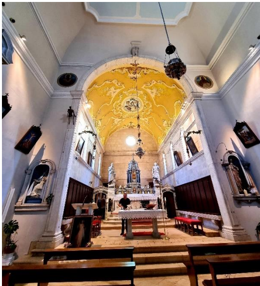
Slika 5. Apsida štafilićke crkve