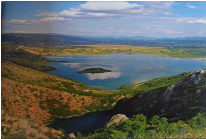
Slika 1. Otočić u Prološkom blatu

spomenuto, imotski samostan je bio u sastavu Bosanske vikarije, a pripadala je Duvanjskoj kustodiji. Bosanski vikar Jakov de Marchi je posjetio i imotski samostan koji se nalazio uz rijeku Vrljiku u Imotskom polju. Znao je kretanje osmanske vojske te je savjetovao franjevce da samostan presele na otočić u Prološkom blatu kako bi se barem donekle zaštitili od Osmanlija. 14 Prema pisanju Ante Ujevića, koji je izvore svog pisanja tražio u starijim franjevačkim povjesničarima, samostan je premješten iz Opačca na pusti Otočić na Prološkom blatu u drugom dijelu 15. stoljeća. Razlog tome navodi pojačanu osmansku opasnost. Otočić je bio skromnih dimenzija te su samim tim dimenzije samostana bile skromne. Prema dostupnim podacima zgrada je bila dimenzija 30x7 metara, a do danas su sačuvani zdenac za vodu i postolje oltara kapelice koja se nalazila na južnom dijelu zgrade. Iako je Otočić bio udaljen od kopna i dalje je bio na meti osmanskih pljačkaša, a veliki problem su stvarale učestale poplave te su ga zbog toga imotski franjevci često napuštali. 15