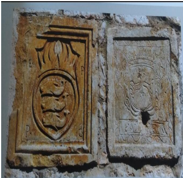
Slika 3. Grb obitelji Delfini pokraj ulaza u samostan

Međutim, franjevcima je probleme stvarao makarski biskup Stipan Blašković koji se protivio njihovom planu prenošenja samostana u grad Imotski. Prema crkvenim pravilima biskup nije imao vlast nad samostanima te bi zbog toga oslabila moć i utjecaj makarskog biskupa u Imotskom. Zbog toga je prijetio velikim kaznama svima koji budu sudjelovali u gradnji samostana. Poslao je žalbu u Rim, ali nije prihvaćena jer su redovnici mogli premještati samostan s jedne lokacije na drugu i to su mogli učiniti bez biskupovog dopuštenja. Mletački dužd je dozvolio premještanje samostana 26. travnja 1738. godine. Ogromnu podršku franjevcima je pružio providur Danijel Delfini te se zbog toga grb obitelji Delfini nalazi u samostanu koji je svečano proglašen 2. kolovoza 1738. godine te je fra Andrija Erceg dobio čast da bude prvi gvardijan. Zbog problema u gradnji 1740. godine gvardijan postaje fra Stipan Vrljić te je pozvao providura Delfinija kako bi položili kamen temeljac i to je učinjeno 26. travnja 1740. godine. Ubrzo nakon toga fra Stipan, star i boležljiv, prepušta nastavak gradnje ostalim franjevcima. 52