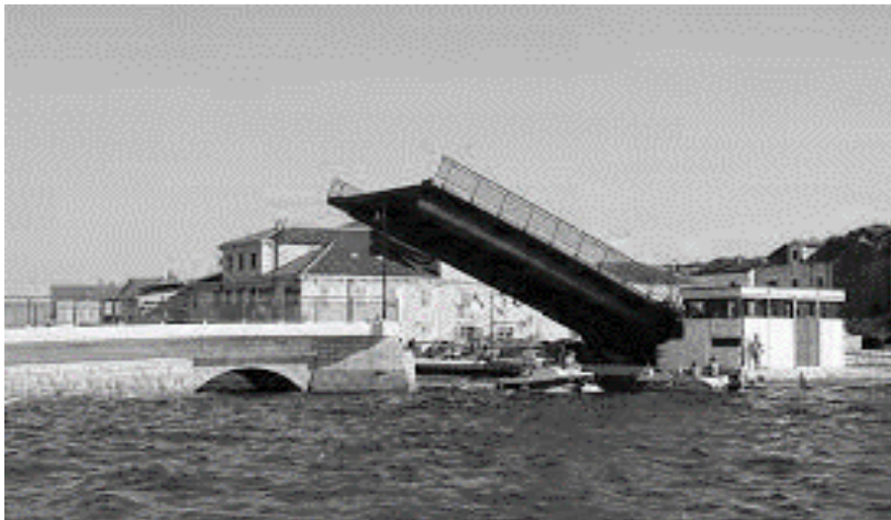
Slika 3. Most u Tisnome (otok – kopno) 6