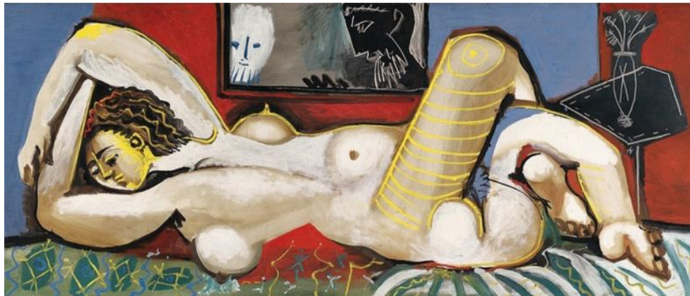
Slika 9. Pablo Picasso, Suzana i starci, 1955., ulje na platnu, Picassov muzej, Málaga

Neki umjetnici Suzanu prikazuju nesvjesnu svojih voajera. Pablo Picasso 1955. godine Suzanu smješta na krevet, maknuvši ju tako iz vrta i postavivši ju u kućno okruženje što daje djelu moderniji pristup i izgled. Otvoreno je za interpretaciju gledaju li ju dvojica muškaraca kroz prozor ili su pak samo slika na zidu. No, kao što će se i kasnije prikazati, ovdje je Picasso samo jedan od umjetnika koji su kroz stoljeća priču o Suzani udaljili od prikaza biblijske moralne priče o vjernoj supruzi i umjesto toga koristili lik Suzane kako bi objektivizirali njenu ženstvenost i podredili ju muškom pogledu.