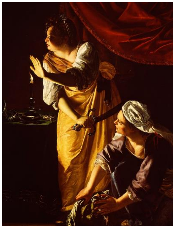
Slika 24. Artemisia Gentileschi, Judita i njena sluškinja s Holofernovom glavom , 1623.–1625., ulje na platnu, 182.2 cm x 142.2 cm, Detroit Institute of Arts

Iako je Orazio nedvojbeno pružio predložak za Artemisijin prikaz, Artemisia temu čini svojom, što je itekako impresivno za umjetnicu koja je u vrijeme slikanja djela imala samo dvadeset i dvije godine. Slikala je Juditu i prije ( Judita ubija Holoferna , 1611.–1612.), a vraćat će joj se u više navrata kroz desetljeća rada, u svakom djelu produbljujući naše razumijevanje glavne heroine. 83