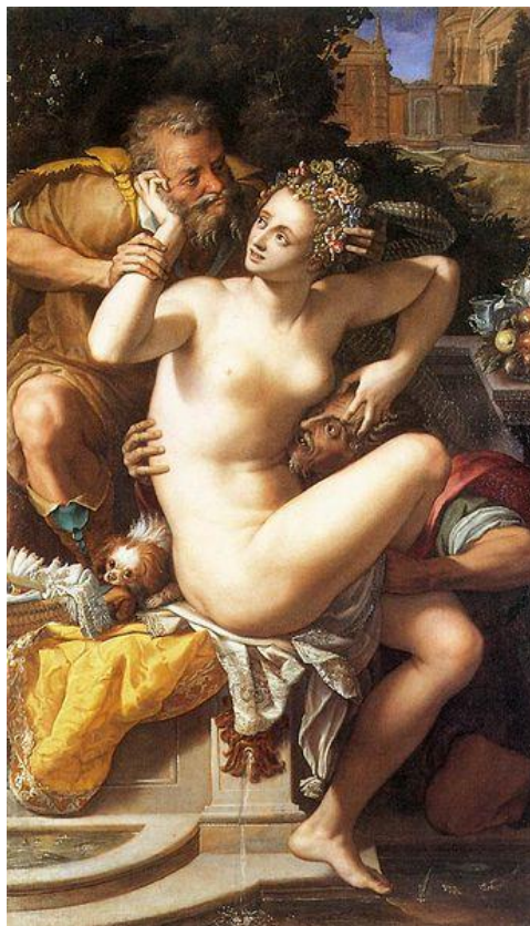
Slika 13. Alessandro Allori, Suzana i starci, 1561., ulje na platnu, 202 cm x 117 cm, Muzej Magnin, Dijon

Suzana Alessandra Allorija jednom rukom vuče glavu starješine k sebi dok drugom drži lice u krilu. Muškarci su objeručke prihvatili ideju Suzane kao zavodljive žene koja namjerno