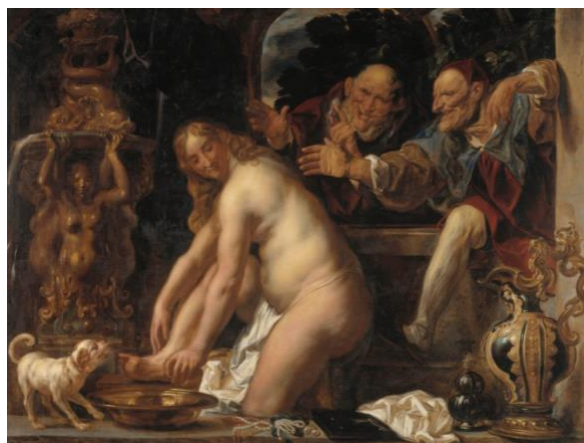
Slika 11. Jacob Jordaens, Suzana i starci, 1653., ulje na platnu, 15.35 cm x 2.30 cm, Nacionalna galerija Danske

Artemisia Gentileschi prikazuje Suzanu svjesnu prijeteće prisutnosti; uzaludnom gestom podiže krhku ruku protiv svojih napadača. Naspram nje, umjetnici često prikazuju Suzanu u fizičkom kontaktu sa starješinama. Primjerice, Jacob Jordaens 1653. godine prikazuje Suzanu kako se smiješi dok starci energično ulaze u njen privatni prostor, dok je Tintorettova Suzana iz 1555./56. godine toliko je zaokupljena svojim odrazom u zrcalu da ne vidi Starce kako vire iza zida. 48