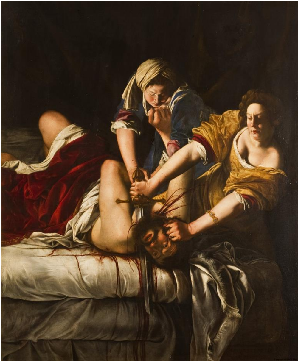
Slika 21. Artemisia Gentileschi, Judita ubija Holoferna, 1620.–1621., ulje na platnu, 86 cm x 125 cm, Galerija Uffizi, Italija

Abra ga također pritišće dolje na krevet, oduzimajući mu moć, te je tako gotovo u potpunosti ravnopravna Juditi u počinjenom ubojstvu. 72