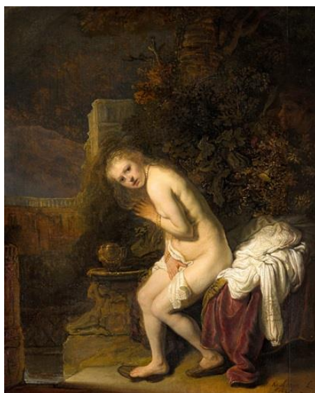
Slika 10. Rembrandt van Rijn, Susanna, 1636., ulje na ploči, 47.4 cm x 38.6 cm, Mauritshuis, Den Haag

Artemisia Gentileschi prikazuje Suzanu svjesnu prijeteće prisutnosti; uzaludnom gestom podiže krhku ruku protiv svojih napadača. Naspram nje, umjetnici često prikazuju Suzanu u fizičkom kontaktu sa starješinama. Primjerice, Jacob Jordaens 1653. godine prikazuje Suzanu kako se smiješi dok starci energično ulaze u njen privatni prostor, dok je Tintorettova Suzana iz 1555./56. godine toliko je zaokupljena svojim odrazom u zrcalu da ne vidi Starce kako vire iza zida. 48