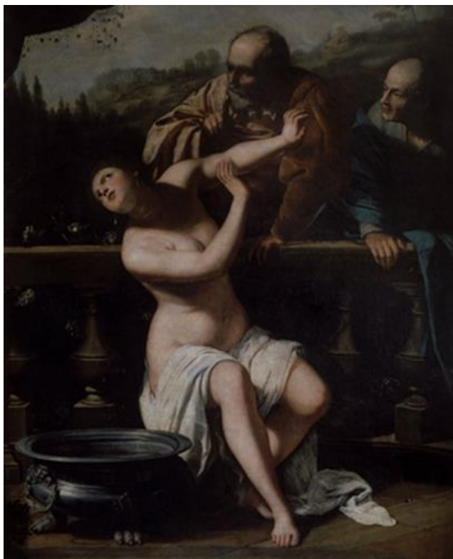
Slika 16. Artemisia Gentileschi – Suzana i starci, 1649., ulje na platnu, 206cm x 158cm, Moravian Gallery in Brno, Češka

Sliku iz 1622. Artemisia je dovršila tijekom boravka u Rimu, a paleta odražava utjecaje toskanskih stilova kojima je bila izložena tijekom svog boravka u Firenci. 53