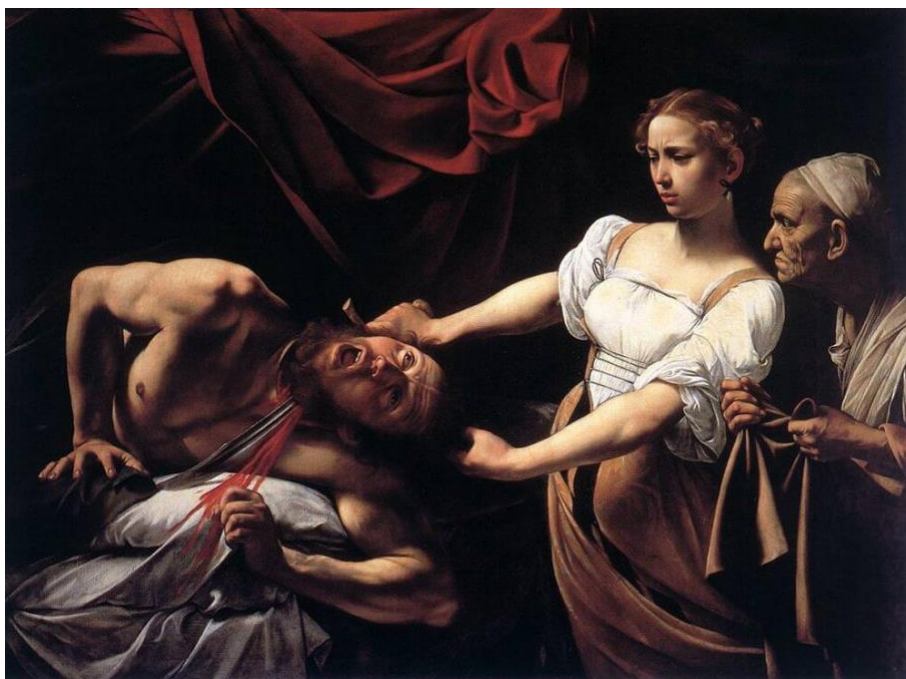
Slika 19. Caravaggio, Judita odrubljuje glavu Holofernu, c. 1598.–1599. ili 1602., ulje na platnu, 145 cm x 195 cm, Galleria Nazionale d'Arte Antica, Palača Barberini, Rim

Dok su se slikari renesanse držali idealizacije u prikazu tema koje su slikali, temeljeći se na gracioznosti, harmoniji, simetriji i redu, Caravaggio je u vrijeme baroka išao protiv tih koncepcija. On nije idealizirao tematike svojih slika već naprotiv; činio ih je realnima, pokazujući ožiljke, rane i bore. Scene koje je slikao često su bile prikazi najintenzivnijih trenutaka određenog događaja: to u slici Judita odrubljuje glavu Holofernu možemo uočiti kako Caravaggio odlučuje prikazati točan trenutak kada je Juditin mač usred odrubljenja Holoferne glave, te krv štrca uokolo a Holoferne oči gotovo gube svoj sjaj dok ga život napušta. Vidimo da su Caravaggiovi religiozni prizori senzacionalni, te pokazuju realnu akciju. 67