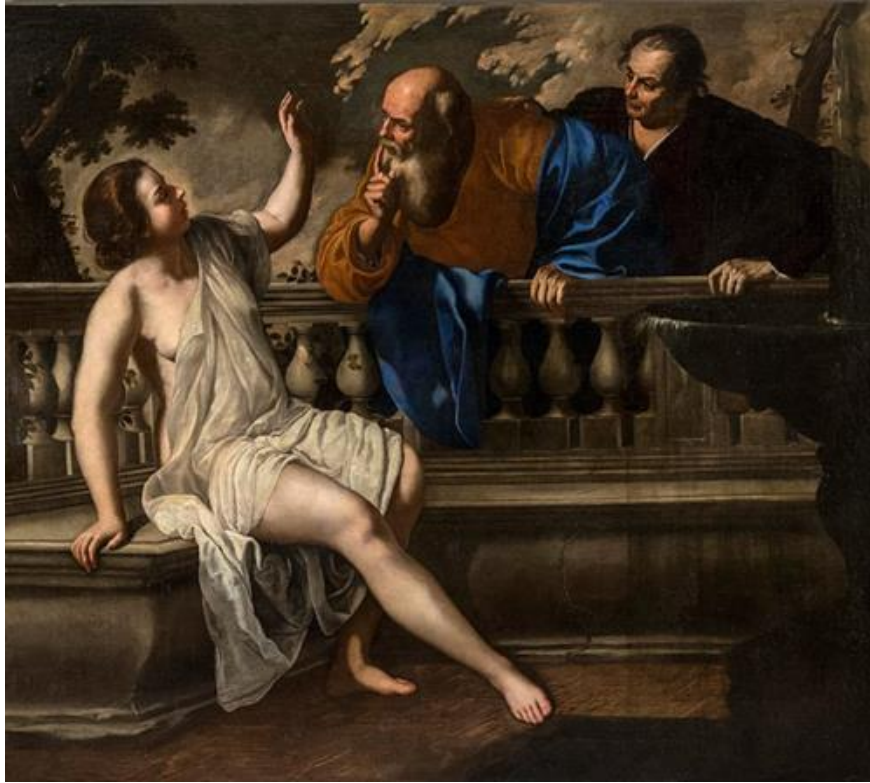
Slika 18. Artemisia Gentileschi, Suzana i starci, 1652., ulje na platnu, 200.3 cm x 225.6 cm, Pinacoteca Nazionale, Bologna

Slika iz 1652. pronađena je u Firenci u palači obitelji Medicija u ulici Via Larga. Alessandro da Morrona ju opisuje: „Na ovoj [slici] pronaći ćete onu vrsnost crteža i pomno odabranu boju – nešto što se nikada neće moći naučiti osim ako niste podareni prirodnim genijem. (...) Hebrejska žena uživa u daru ekspresivnosti i lijepog ponašanja. Odjeća pokriva njezino [tijelo] neuhvatljivim naborima, a na dojčkama se prekriva takvom umjetnošću da se ubrzo pojavi razumijevanje nagosti. Ništa manje ukrasa nema u draperijama dviju obližnjih starješina, a njihove glave čudom izražavaju kakav učinak imaju pokreti ljubavi na ostarjeli ud.“ 56