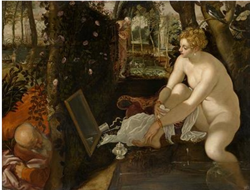
Slika 12. Tintoretto, Suzana i starci, 1555./56., ulje na platnu, 146cm x 194cm, Kunsthistorisches Museum, Beč