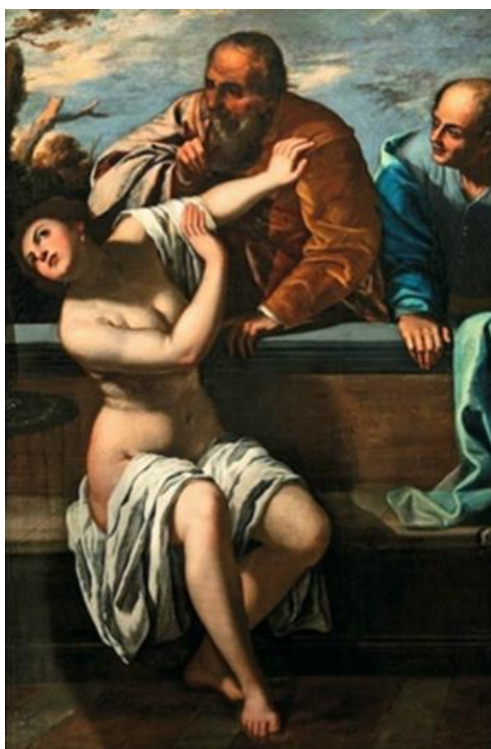
Slika 17. Artemisia Gentileschi, Suzana i starci, 1650., ulje na platnu, 168 cm x 112 cm, Museo Civici, Bassano

Artemisia Gentileschi često je znala angažirati druge kolege slikare da na njezinim kompozicijama naslikaju pejzaž. Primjerice, tako je prikaz krajolika na slici iz 1649. godine rad Viviana Codazzija, Artemisijina štićenika i čestog suradnika tijekom njenog boravka u Napulju. Artemisia je, drži se, osmislila kompoziciju, a Codazzi je naslikao krajolik uz njezinu pomoć. 54 Drveće na lijevoj strani platna tamno je i gusto poput šume, a brda koja se protežu desno od središta podsjećaju na topografiju juga Italije.