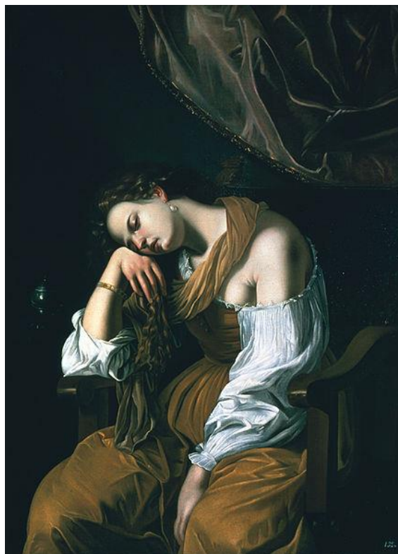
Slika 6. Artemisia Gentileschi, Marija Magdalena kao melankolija, c. 1622./25., ulje na platnu, 100.6 cm x 136.3 cm, Muzej Soumaya, Ciudad de Mexico