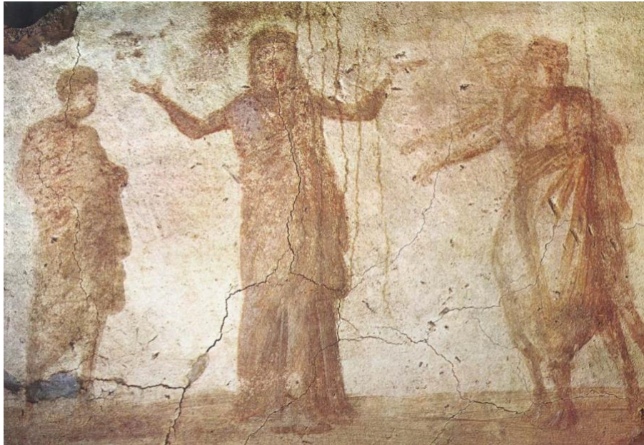
Slika 7. Suzana i starci, freska iz grčke kapele u Priscillinoj katakombi u Rimu iz 3. stoljeća

Artemisijina prva slika ove tematike datirana je 1610. godine, kada je umjetnica imala sedamnaest. Naslikana je prije no što ju je silovao Agostino Tassi, iako je on tada već redovito posjećivao kuću Gentileschi. Upravo zbog tog smještaja rada u vremenskoj crti Artemisijina života smatram da je ovo jedino djelo te tematike u Artemisijinu opusu koje nije uvjetovano traumama u životu same umjetnice, te nam stoga daje idealnu bazu za proučavanje Artemisijine iskonske umjetničke vizije.