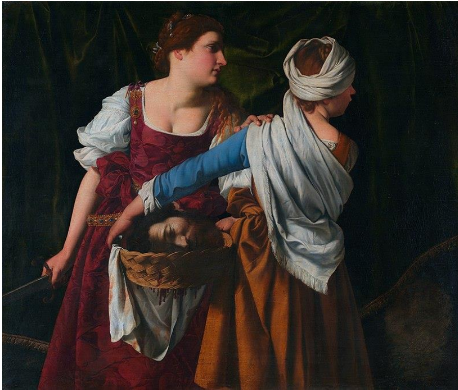
Slika 22. Orazio Gentileschi, Judita i njena sluškinja s Holofernovom glavom, 1608., ulje na platnu, 160 cm x 136 cm, Nasjonalmuseet, Oslo

Orazio koristi Caravaggiovu tehniku stvaranja osjećaja neposrednosti, te djelo izgleda gotovo kao da slika mrtvu prirodu. Čak i kapljice zgrušane krvi i mrlje na ručniku dobivaju jezivu ljepotu. 77 Naglašava prijateljstvo dviju žena, čija odjeća odražava kontrast njihovih položaja: Judita je u raskošnoj svili boje vina, dok je Abra u jednostavnijoj no svejedno elegantnoj haljini. Tema čistoće i zla vidljiva je u usporedbi besprijekorno bijelog šala koji se vuče preko Abrinog ramena i krvavog ručnika koji visi iz košare s Holofernovom glavom. Inzistiranje na formalnim elementima umjesto na dramskim gestama različito je od Artemisijina pristupa pripovijedanju, te je zbog toga iznenađujuće koliko je znanstvenika prvotno njoj pripisalo ovu sliku umjesto njenom ocu. 78