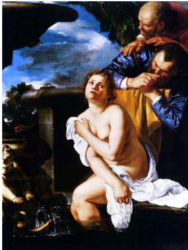
Slika 14. Artemisia Gentileschi, Suzana i starci, 1622., ulje na platnu, 162.5 cm x 121.9 cm, Burghley House

traži pažnju starješina, jer im je taj narativ prihvatljiviji od istine. Taj pristup živ je i do danas, što je vidljivo u Picassovom pristupu, te upravo tu vidimo izuzetnu važnost Artemisijinog rada s ovom temom, koja čuva njeno dostojanstvo, daje žensku perspektivu, i drži žrtvu žrtvom, ne pretvarajući ju u nešto prihvatljivije muškoj publici. Kako piše Mary Garrard: „Artemisijina Suzana predstavlja nam sliku rijetku u umjetnosti, trodimenzionalnog lika koji je herojski ... izražajna srž slike je nevolja heroine, a ne predviđeni užitek zlikovaca.“ 49