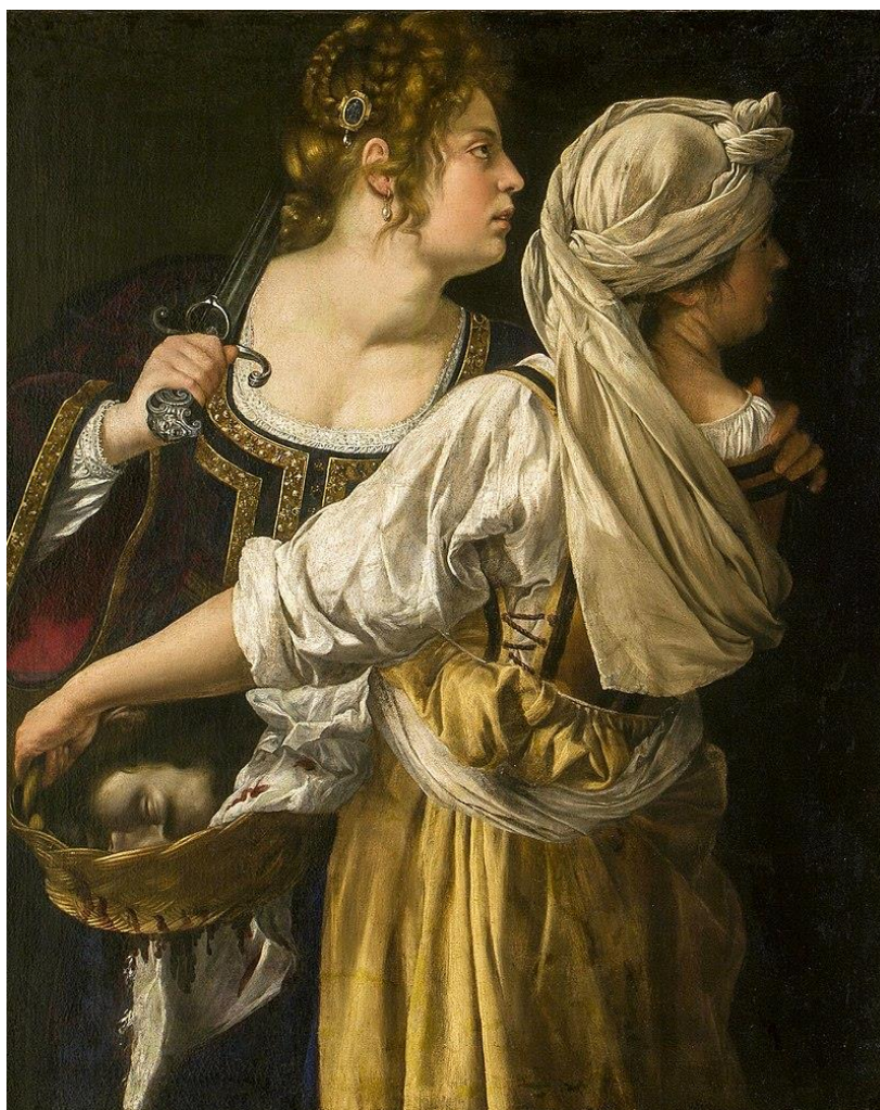
Slika 23. Artemisia Gentileschi, Judita i njena sluškinja, 1615., ulje na platnu, 14 cm x 93.5 cm, Palača Pitti, Firenza

U Artemisijinoj verziji slike, Juditina ruka na Abrinu ramenu delikatnija je, te sa sobom nosi ne samo gestu solidarnosti, već i blago razmatranje potencijalne opasnosti u kojoj se nalaze da ih netko ne otkrije i zatoči, o čemu ovisi ne samo njihov život, već i budućnost Betulije. Smještaj ruke sceni daje dodatan ljudski osjećaj i unosi realističnu dramu u priču. Snažno svjetlo koje pada na žene u kontrastu je s tamnom pozadinom što usmjerava fokus gledatelja na njih. 80