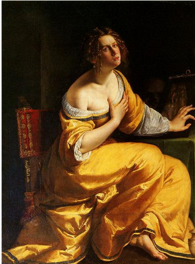
Slika 4. Artemisia Gentileschi – Preobraćenje Marije Magdalene (Pokornica Marija Magdalena), 1616./18., ulje na platnu, 146.5cm x 108cm, Palača Pitti, Firenca

Sličnosti ovih dviju slika Marije Magdalene Artemisije Gentileschi i Caravaggia dosta su površne. Artemisia u prvi plan stavlja gestu i pozu, te upravo ti elementi prenose značenje u njenom radu. Caravaggio posvećuje pažnju prikazu stakla i nakita. Njoj je bitna drama, a ne tiha kontemplativna atmosfera koju evokacija osvijetljenih površina može pružiti. 29 Artemisia Gentileschi koristi dramatičnost kao najvažniji čimbenik u njezinu prikazivanju Marije Magdalene kao pokornice. U svojim prikazima, svaka od ovih slika daje nam jedinstven način pristupanja narativnoj temi. Caravaggiove slike su pristupačne. One prikazuju vjerske predmete i služe kao korisni uzori suvremenom gledatelju koji je tražio smjer u molitve. Njegova Marija Magdalena nije samo pobožna slika, već je pristupačan primjer nagrade vjere i moći otkupljenja. S druge strane, Artemisia Gentileschi okreće se akciji i dramati. Artemisia je tip Magdalene koji se formirao početkom sedamnaestog stoljeća pretvorila u sliku koja