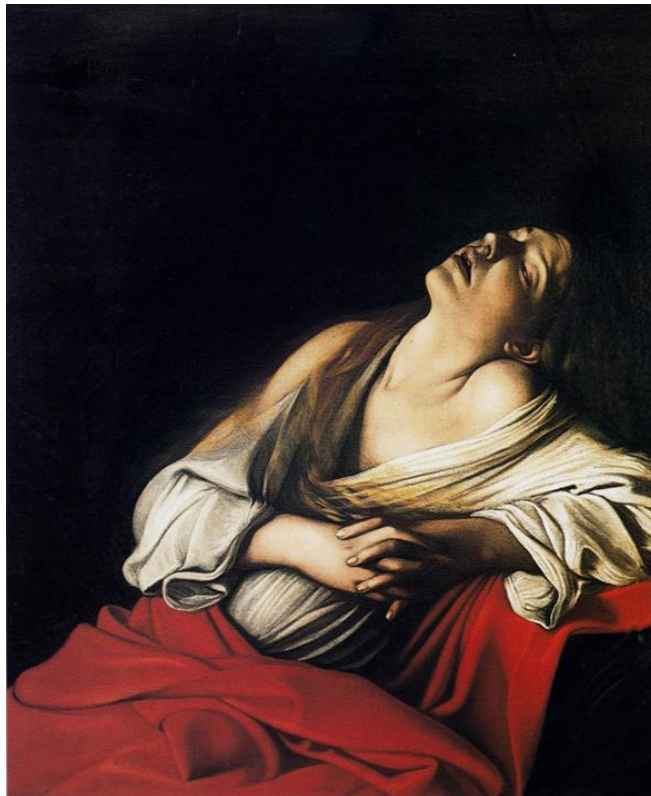
Slika 1. Caravaggio, Marija Magdalena u ekstazi, 1606., ulje na platnu, 103.5 cm x 91.5 cm, privatna kolekcija

Smatra se da je nakon Kristove smrti Marija Magdalena živjela izolirano u južnoj Francuskoj blizu Aix-en-Provencea gdje je živjela je u špilji. Svakodnevno je imala razna mistična iskustva, tijekom kojih je tražila pokoru za svoje grijehе, te je imala sastanke s Bogom. Artemisija Gentileschi po uzoru na Caravaggia Magdalenine doživljaje prikazuje kao intenzivna unutarnja iskustva. 22