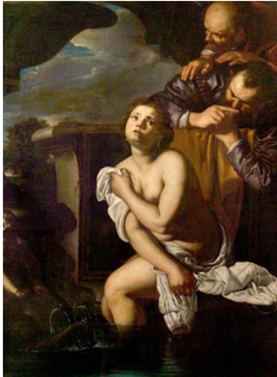
Slika 15. Artemisia Gentileschi, Suzana i starci, 1630., ulje na platnu, 162.5 cm x 121.9 cm, Nottingham Castle

Na slici iz 1622. godine, Artemisia prikazuje Suzanu na konvencionalniji način, kao njezini muški kolege-slikari, vjerojatno nastojeći tako se probiti kao umjetnica u muškom svijetu. Međutim, Artemisia u djelu postaruje Suzanu i starce. Kako piše Deborah Anderson Silvers, Artemisia starješine koristi kao prikaz Tassija i njenog nevjernog supruga Stiattesija. 51 Prikazujući Suzanu u konvencionalnijoj, umjetnički prihvaćenijoj pozi kao lijepu zavodnicu, ona također prenosi sliku sebe kao uspješne umjetnice na vrhu svoje karijere, te Silvers tumači da je to bio trenutak trijumfnog ponosa za Artemisiju, jer su svi muškarci u njenom životu bili manje uspješni od nje. 52 Ovdje je vidljiviji zreliji prikaz Suzane u Artemisijinom radu, koji odgovara pristupu žene koja je tada već bila starija i rodila djecu. Veća je seksualnost u prikazu Suzane, u namještenim pozama i strateško namještenoj plahti, te u dodiru Suzaninog tijela s vodom. No, i dalje nije upitno da je Suzani neugodno, te da je napadnuta u prostoru svoje intime od strane starješina koji ju hvataju u intimnom trenutku.