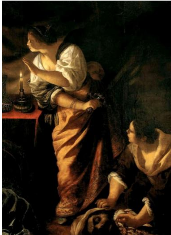
Slika 25. Artemisia Gentileschi, Judita i njena sluškinja s Holofernovom glavom, 1640.–1645., ulje na platnu, 272 cm x 221 cm, Museo di Capodimonte, Napulj

Artemisia istu scenu slika još dvaput tijekom desetljeća svoje karijere, igrajući se bojama, svjetlom i sjenom. Promjene su minimalne, uglavnom mijenja kut pogleda te je odjeća manje raskošna. No, intenzitet trenutka neposredno nakon počinjenog ubojstva itekako je prisutan, te u potpunosti obuhvaća promatrača i uvodi ga u dramu radnje.