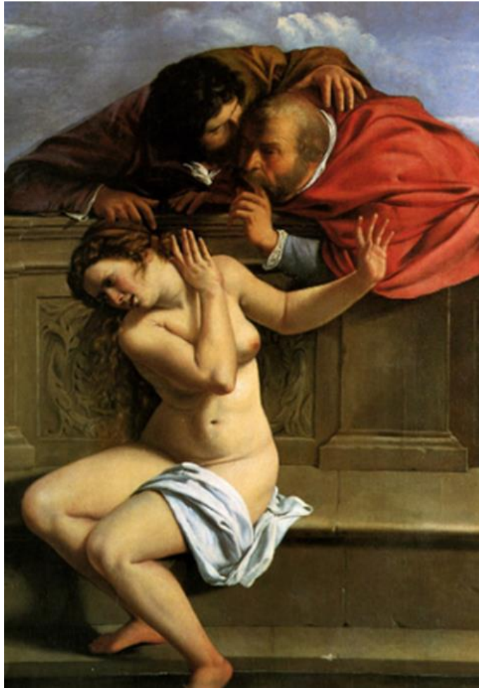
Slika 8. Artemisia Gentileschi, Suzana i starci, 1610., ulje na platnu, 170 cm x 119 cm, Dvorac Weißenstein, Pommersfelden

Artemisia dvojicu muškaraca koji promatraju slika tako da zauzimaju gotovo potpuni gornji prostor slike. Drže se prijeteće lascivno, te su piramidalno spojeni zavjereničkim šaptom dok se nagnju nad zid i špijuniraju. Stvara se izrazit dojam ugnjetavanja gole žene koja sjedi ispod njih. Suzanine ruke podignute su u obrambeni položaj, bez dvosmislenosti ilustrirajući da su pozornosti muškaraca nepoželjne od strane Suzane. Suzana ih odbija. Artemisia eksplicitno izražava lascivne namjere dvojice starješina, te Suzanino jasno odbijanje njihovih želja. Brojni umjetnici su ovoj biblijskoj tematici pristupili na nekakav nejasniji način, ostavljajući dvosmisleno mišljenje o tome kako možemo pročitati Suzaninu reakciju. Taj pristup dao je mogućnost muškim umjetnicima da muškom gledatelju „dopuste“ da gleda голу ženu na slici. 46