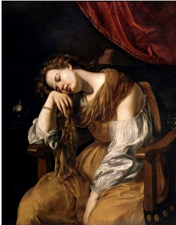
Slika 5. Artemisia Gentileschi, Pokornica Marija Magdalena, c. 1625, ulje na platnu, 122 cm x 96 cm, Katedrala, Sevilla