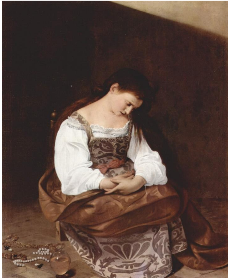
Slika 3. Caravaggio, Pokornica Marija Magdalena, 1594./95., ulje na platnu, 122.5 cm x 98.5 m, Galerija Doria Pamphilj, Rim

Caravaggio slika Pokornicu Mariju Magdalenu između 1594. godine i 1595. godine. Slika prikazuje mladu ženu koja sjedi na niskoj drvenoj stolici u jednostavnom interijeru definiranom samo pozadinskim zidom i popločanim podom. Žena ima neurednu kosu, ruke su joj sklopljene u krilu, a glavu nespretno savija ulijevo, ne obazirući se na odbačene bisere, dragulje i ulje koji leže na podu u blizini. Njezina lanena košulja, prekrivena haljinom od bogatog žutog damasta, koja više sličići na presvlake, raščupana joj pada s desnog ramena. 28