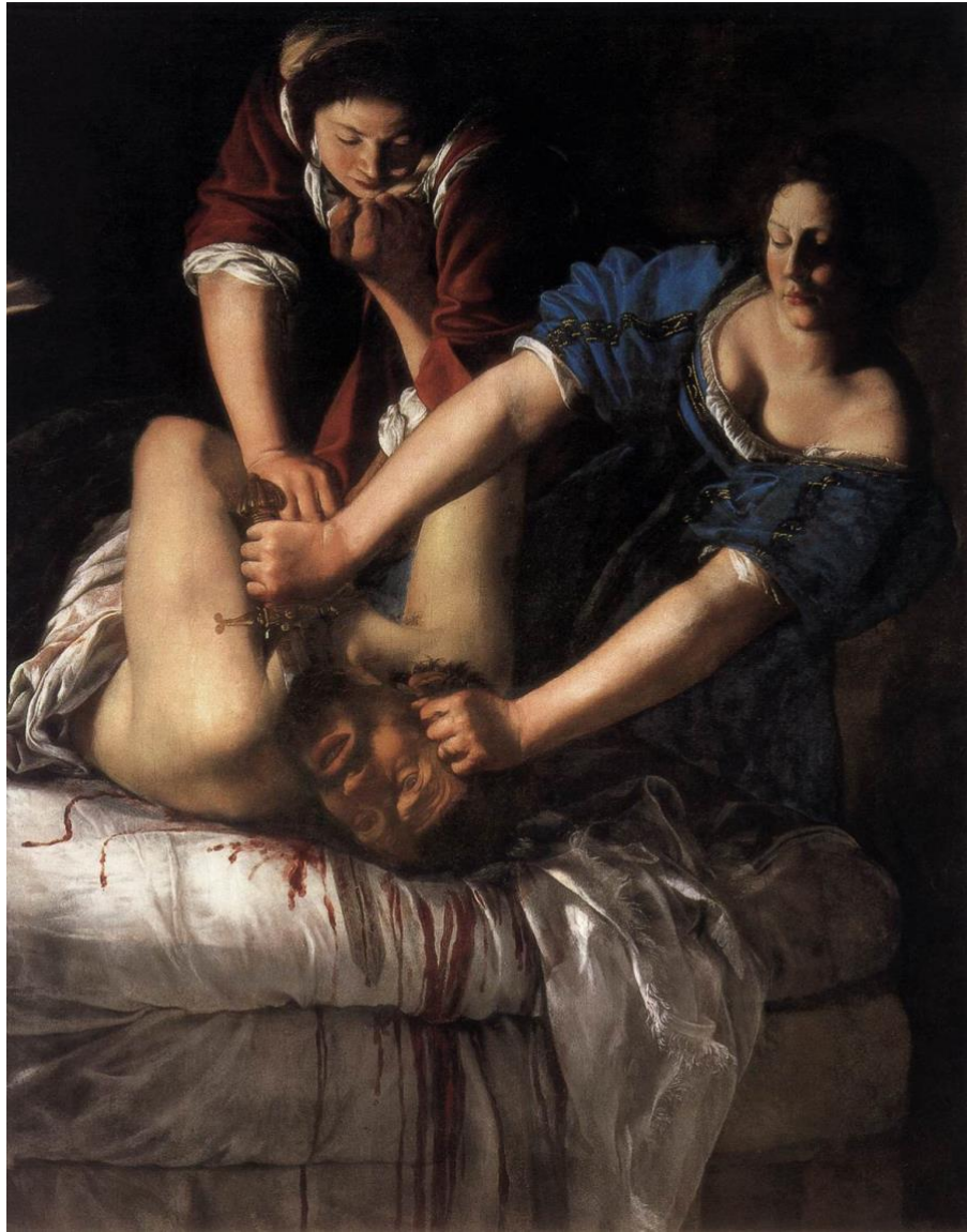
Slika 20. Artemisia Gentileschi, Judita ubija Holoferna, 1611.–1612., ulje na platnu, 158.8 cm x 125.5 cm, Museo Nazionale di Capodimonte, Napulj

Za razliku od Caravaggia, koji sluškinju Abru prikazuje kao staricu koja je tu uglavnom samo promatrač, Artemisia prikazuje dvije snažne, mlade žene koje složno rade, zasukanih rukava i usredotočenih pogleda, što odaje počast davnoj ideji ženske snage i ponajviše prijateljstva i solidarnosti. Kao što je već spomenuto, Caravaggiova Judita svojim licem dijelom prikazuje i odbojnost prema počinjenom djelu. Naspram njega, Artemisijina Judita ne odmiče se od svog zadatka ni u jednom trenutku. Pridržavajući se za krevet, Artemisijina Judita jednom rukom pritiska glavu Holoferna, a drugom mu povlači veliki mač kroz vrat dok nabori na njezinim zapešćima jasno pokazuju potrebnu fizičku snagu. Holofern se uzalud bori, no