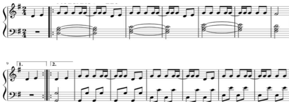
Slika 1. Notni zapis pjesme Baby Shark (Vidović Schreiber, 2020: 4454)

O popularnosti malešnica engleskog govornog područja govori i činjenica da neke od njih pjevaju sva djeca svijeta. Primjer takve pjesme, koja je pronašla mjesto i kod hrvatskih mališana, jest pjesma Baby Shark . Ono što je najviše pridonijelo njejoj popularnosti jest jednostavan tekst i sadržaj koji su jako bliski djeci. Pjesma je uglazbljena, a postoji i plesna interpretacija iste. U pjesmi je prisutno nabranje članova obitelji te se kroz cijelu pjesmu ponavljaju isti ritamski obrasci (Vidović Schreiber, 2020).