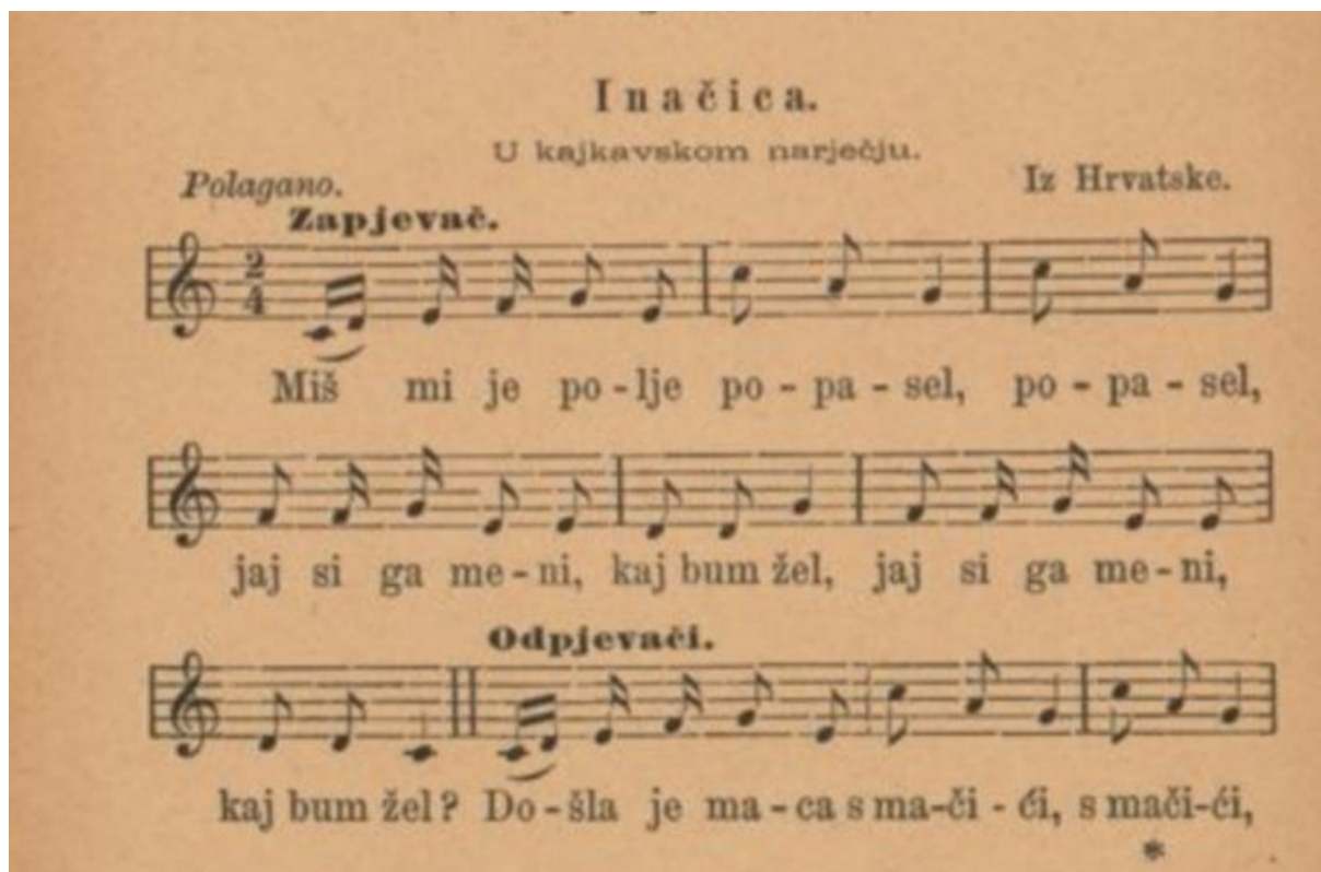
Slika 4. Notni zapis pjesme Miš mi je polje popasel (Kuhač, 1885:19)

životinje žive, što jedu i načine na koje se glasaju. To pruža mnoštvo prilika za nova učenja i spoznaje. Ova malešnica je napisana u G-duru u dvočetvrtinskoj mjeri te ne postoje znatne razlike u notnom zapisu od današnje inačice pjesme.