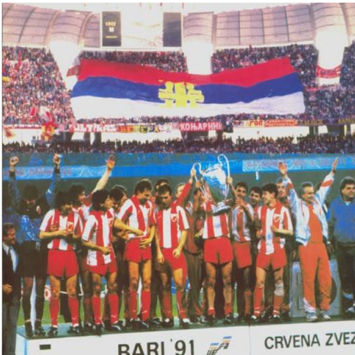
Fotografija 31. Crvena Zvezda kao simbol srpskog nacionalizma