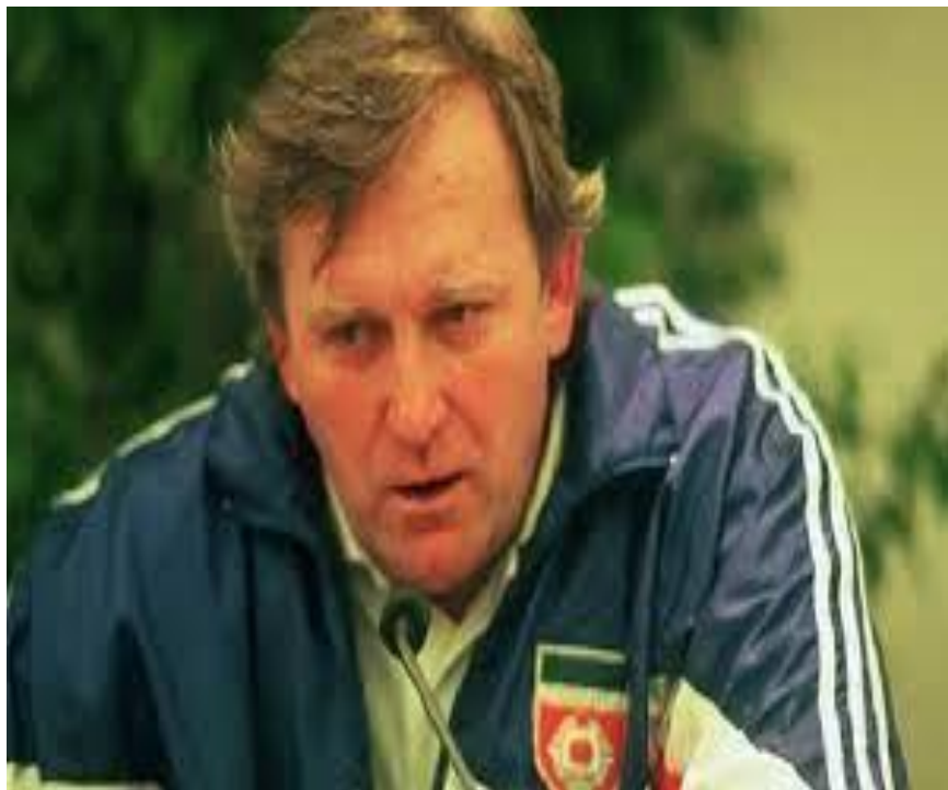
Fotografija 30. Ivica Osim na funkciji izbornika nogometne reprezentacije Jugoslavije

Osim je nastavio trenirati reprezentaciju i u kvalifikacijama za Euro 1992. 1991. je paralelno s reprezentacijom preuzeo i Partizan, ali hrvatski igrači su zadnji nastup za jugoslavensku reprezentaciju upisali u 5. mjesec 1991. Nakon što je završila sezona 1990./1991., kako je rat stvarno počeo, tako su hrvatski klubovi odbili igrati Jugoslavensku ligu u sezoni 1991./1992., a samim time i igrači nastupati za reprezentaciju. Igrači iz BiH su ostali kao i trener Osim. Sam Osim je dao ostavku s obje pozicije 23.5.1992., nakon što je već mjesec dana njegovo rodno Sarajevo bilo pod opsadom JNA. 153