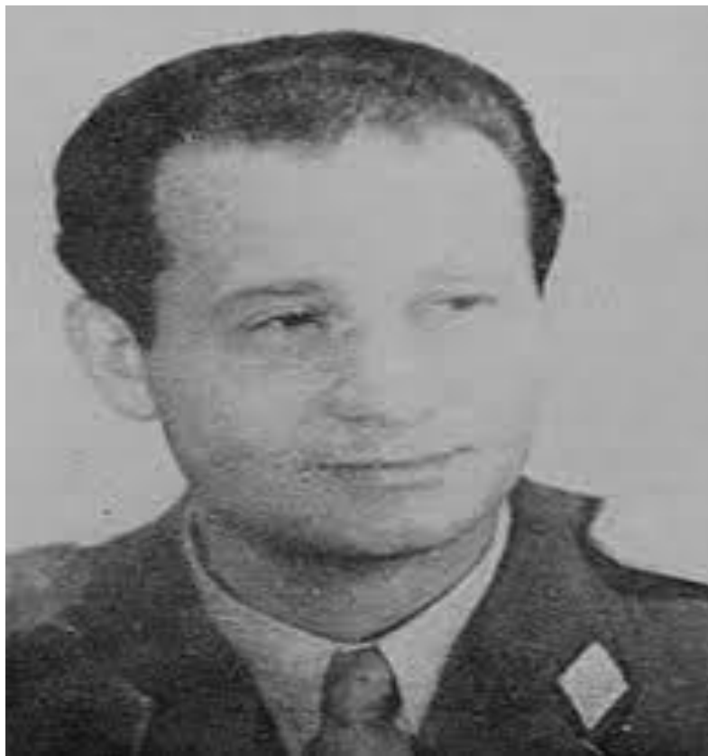
Fotografija 13. General Ivan Šibl, jedan od najboljih predsjednika Dinama svih vremena

O klupskom pogonu Hajduka se još brinulo 16 ljudi, od kojih je 7 bilo u stalnom, a 9 u honorarnom radnom odnosu. S druge strane, Dinamo je imao 5 profesionalnih trenera. Trener prve momčadi Branko Zebec je imao plaću od 150 tisuća starih dinara, trener juniora Vlado Zajec 120 tisuća starih dinara, a trener pionira Zorislav Srebrić plaću od 70 tisuća starih dinara. Dinamo je čuvao podatke o premijama te su bili klupska tajna. U Dinamu je bilo zaposleno 40 radnika čime je Dinamo držao rekord među jugoslavenskim klubovima. To je svakako zasluga generala Ivana Šibla koji je bio moćni društveno-politički radnik. 64