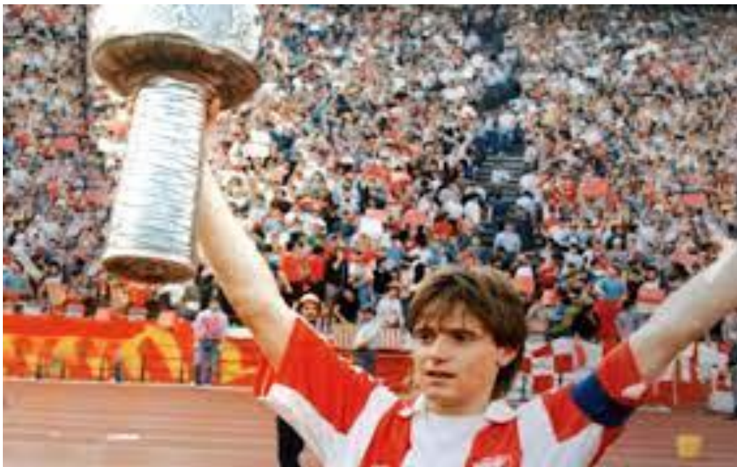
Fotografija 22. Dragan Stojković „Piksi“ , 5. „Zvezdina zvezda“