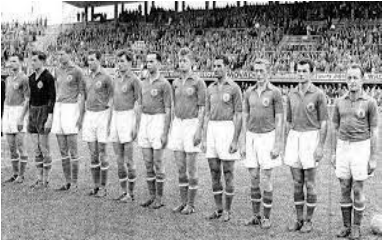
Fotografija 8. Jugoslavenski reprezentativci pred okršaj sa SSSR-om

Što se tiče same Jugoslavije, srebrna medalja na Olimpijskim igrama, kao i trijumf nad SSSR-om je iskorišten u političke svrhe te su sami nogometaši nagrađeni sa 200 američkih dolara, što je tada bio zaista velik novac. Ipak je važno naglasiti da dobar rezultat istočnih zemalja leži u činjenici da zapadne zemlje nisu mogle slati profesionalce, dok najbolji igrači istočnih zemalja navodno također nisu bili profesionalci, iako je to smiješno. U Jugoslaviji je reprezentacija bila tako dobro praćena da su svi znali napamet sastav Beara, Stanković, Crnković, Čajkovski, Horvat, Boškov, Ognjanov, Mitić, Vukas, Bobek, Zebec. 49