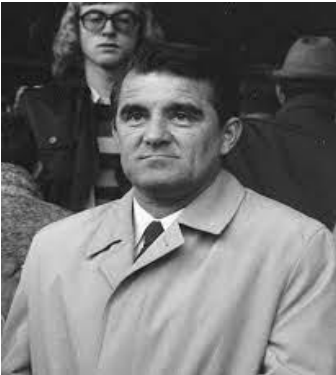
Fotografija 19. Miljan Miljanić, izbornik reprezentacije na SP 1974. i 1982., od 1986. direktor reprezentacije, nakon SP 1974. prezeo Real Madrid, kojeg je trenirao 3 godine i osvojio 2 titule prvaka kao i Kup kralja.