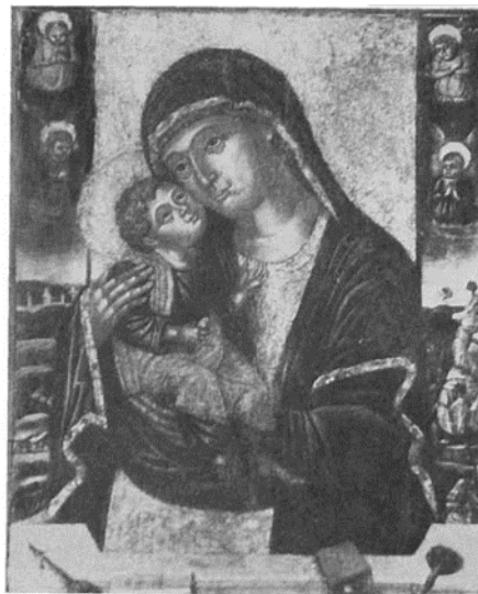
Slika 10, Petar Jordanić, Bogorodica s Djetetom, Beč, privatno vlasništvo

Hilje objašnjava kako bi ovo djelo bilo najraniji Jordanićev rad, a u kojemu se uvelike oslanjao na nasljeđe Crivellija. Nešto kasniji radovi začudo naginju bizantizirajućim likovima. 84