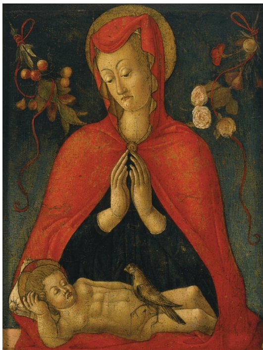
Slika 14, Juraj Ćulinović, Bogorodica s Djetetom, Split, Galerija umjetnina

Kod Ćulinovića je moguće opaziti i neka nova likovna dostignuća u obama primjerima, ali i određen pomak u depikciji biljnih motiva. On na primjeru iz Splita na zelenoplavu pozadinu smješta likove Bogorodice i Djeteta te ih flankira dvama kitama voća i cvijeća. Riječ je o dosta stiliziranoj kompoziciji koju odlikuje osna simetrija. Bogorodica je pritom odjevena u jarkocrveni plašt koji joj se na prsima kopča zlatnom okruglom kopčom. U zlatnoj su boji i podstava plašta te Marijina aureola. Plašt joj blago prati liniju tijela i mreška se na njezinoj glavi, a zelena boja njene haljine prati pravilo komplementarnosti s crvenim elementima. Bogorodičine sklopljene ruke daju naslutiti kako je riječ o motivu prepoznatom i kod djela Francesca da Santa Croce, te Petra Jordanića, gdje je Marija prikazana u stavu molitve nad Djetetom koje je pred njom položeno vodoravno. Ispupčene su joj oči teških vjeđa uperene u Krista, čije je lice, jedanko kao i njeno, pomalo karikaturnog izraza. Kruno Prijatelj pak vidi nešto više u načinu obrade ovih likova, te tvrdi kako je ona dokazom potpuno novih pogleda na evaluaciju slikarstva;