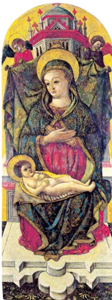
Slika 11, Petar Jordanić, Bogorodica s Djetetom, Tkon, župna crkva