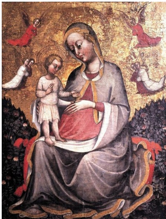
Slika 6, Blaž Jurjev Trogirani, Gospa u ružičnjaku , Trogir, Muzej sakralne umjetnosti