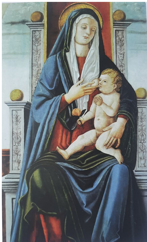
Slika 15, Juraj Ćulinović, Dojiteljica , Visovac, franjevački samostan

vegetabilnih motiva koji se sada sabiru u cjeline načinjene od više različitih vrsta. Ćulinovićeva vještina dočaravanja boja i tekstura sukulentnih plodova i nježnih latica dakako dodatno sugerira korak naprijed u percepciji važnosti njihova simbolizma.