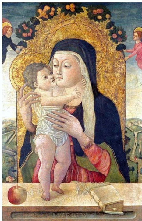
Slika 9, Petar Jordanić (?), Bogorodica s Djetetom , London, The Courtauld Institute of Art

U sličnom je duhu prikaz Bogorodice i Djeteta Petra Jordanića. Naime, oko atribucije se još uvijek lome koplja, ali je dat prijedlog potkrijepljen legitimnim argumentima u znanstvenom radu Emila Hilje 76 , stoga ću se tijekom ove analize referirati na isti. On smatra kako su dosadašnje atribucije nedovoljno dobro objašnjene, nastale na temelju potpisa koji bilježi samo ime slikara pa su se stoga kao mogući kandidati uzimali Pietro Calzetta i Pietro Alemanno. Međutim, Hilje u obzir uzima i kraticu „P“ koja stoji uz potpis i potencijalno označava riječ presbiteri , ali i dodirne točke s radom Carla Crivellija. Iz istih se razloga zadarski svećenik i slikar Petar Jordanić smatra autorom ovoga djela.