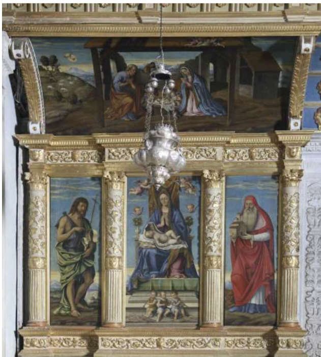
Slika 5, Francesco da Santa Croce, Bogorodica s Djetetom na prijestolju , Hvar, franjevačka crkva, sjeverni oltar pod pjevalištem (poliptih Kristova rođenja), 1583. g.