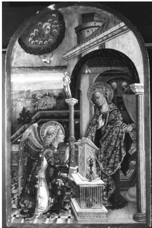
Slika 2, Lovro Dobričević, Navještenje Ludlow, zbirka Wernher, London

znakovi Marijine bezgrešnosti. 38 Razvidno je kako biljni motivi ujedno služe kao spona između kršćanskog narativa i antičkog duha manifestiranog u arhitektonskim elementima, čime pripomažu u prenošenju poruke djela. Samim time bilje simbolizira pomirbu između dva spomenuta svijeta.