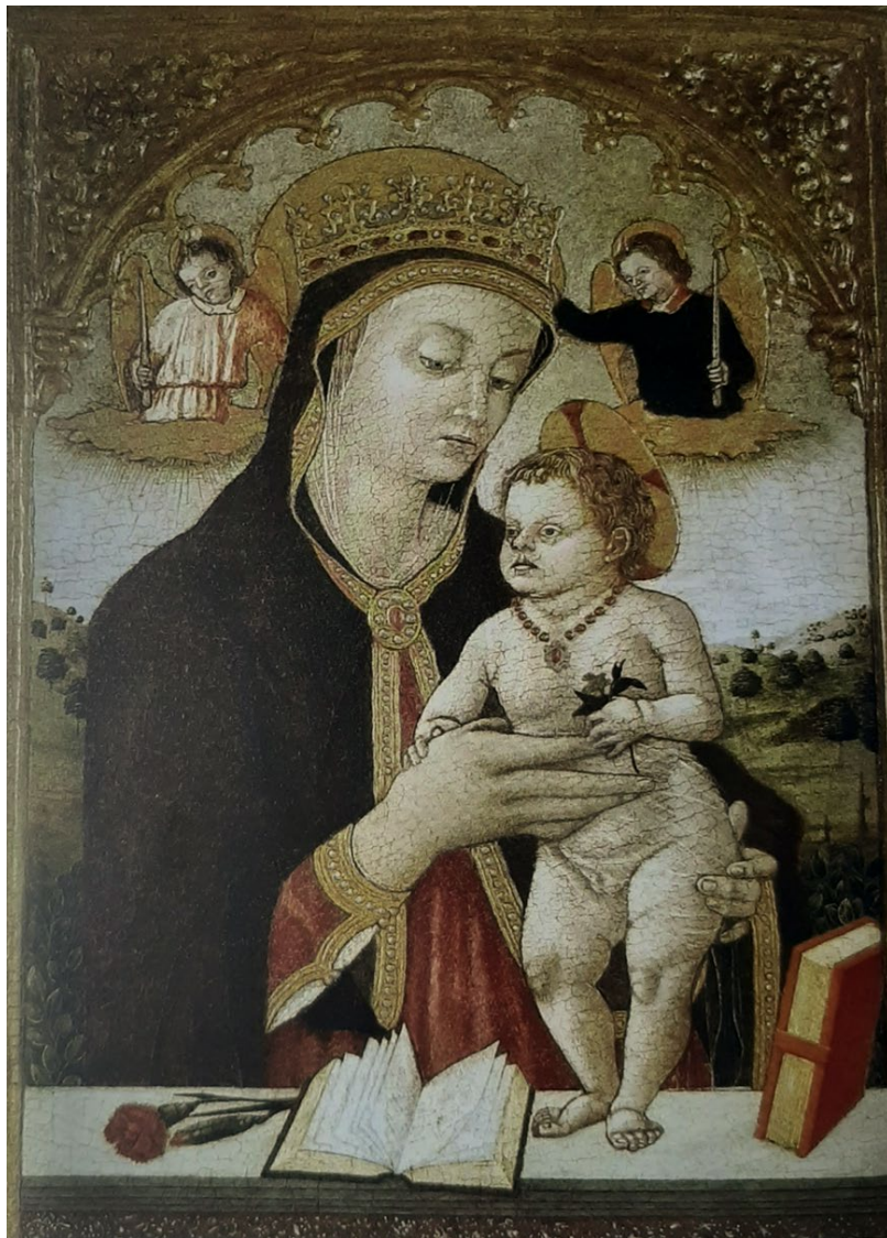
Slika 8, Carlo ili Vittore Crivelli, Bogorodica s Djetetom , Zagreb, zbirka Dujšin-Ribar