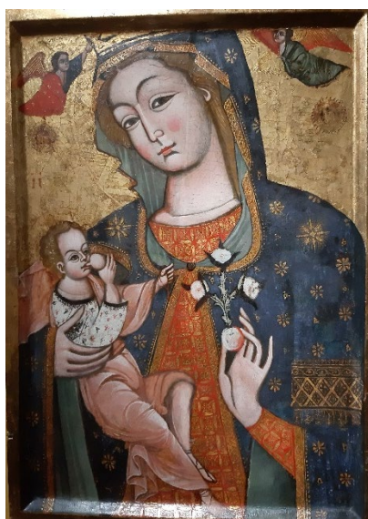
Slika 16, Nepoznati autor, Dojiteljica , Šibenik, Interpretacijski centar

Ovdje je primjereno spomenuti i ikonu iz crkve Svetog Duha u Šibeniku. Ovdje okrunjena Gospa drži Dijete u jednoj ruci, dok joj u drugoj stoji gomoljika s tri cvijeta. 99 Slična se priča ponavlja na Ćulinovićevoj slici, ali je realizirana u potpuno drugačijem duhu.