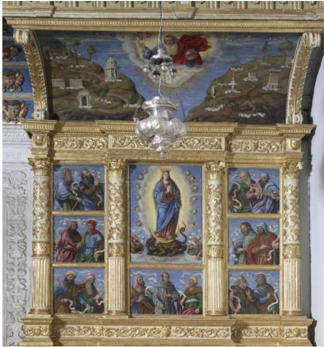
Slika 4, Francesco da Santa Croce, poliptih Immaculatae , Hvar, franjevačka crkva, južni oltar pod pjevalištem, 1583. g.