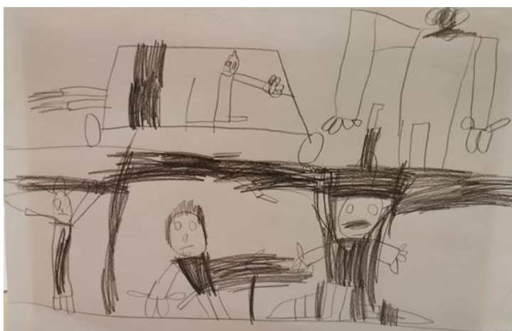
Luka 4,5 godina

Istraživačko pitanje 1 odnosi se na to kako djeca starije dobne skupine češće prikazuju pokret u likovnom izražaju. U ovom slučaju, ovo pitanje ne može se primijeniti na ovaj likovni rad. Motiv za izradu ovog crteža je bila kiša. U crtežu se očituje dinamika kroz crte iz oblaka koje predstavljaju kišu koja pada, te se na podu mogu vidjeti lokve koje nastaju od kiše. Crne sjene i tamne boje nam još bolje predočavaju kako dijete doživljava i kakvog je raspoloženja kada kiša pada. Istraživačko pitanje 4 nije potvrđeno, jer je crtež izradilo dijete mlađe vrtičke skupine, što znači da se i kod djece mlađe vrtičke skupine može pojaviti dinamični prikaz na likovnom uratku.