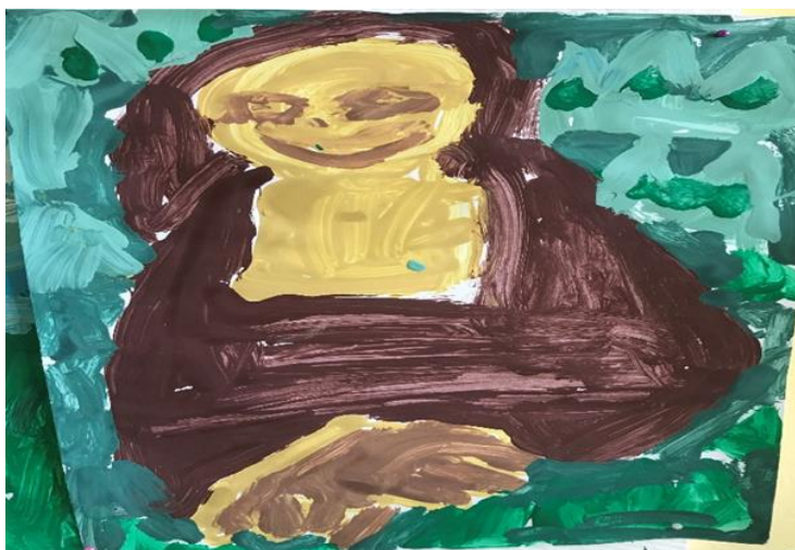
Lucia 7 godina

Crtež prikazuje 3 osobe muškog spola, što se može prepoznati po odjeći i kratkoj kosi. Pokret je prikazan te se očituje u položaju tijela, tj. u raširenim rukama i nogama. Noge su savinute što također označava pokret. Crtež nema mnogo detalja, stoga motiv crteža nije potpuno prepoznatljiv, pa možemo reći da Istraživačko pitanje 2 koje glasi da je u likovnim uradcima djece starije dobne skupine prikaz pokreta je točniji i prepoznatljiviji nije potpuno potvrđeno, te je istraživačko pitanje 1 koje glasi da djeca starije dobne skupine češće prikazuju pokret u likovnom izražavanju potvrđeno.