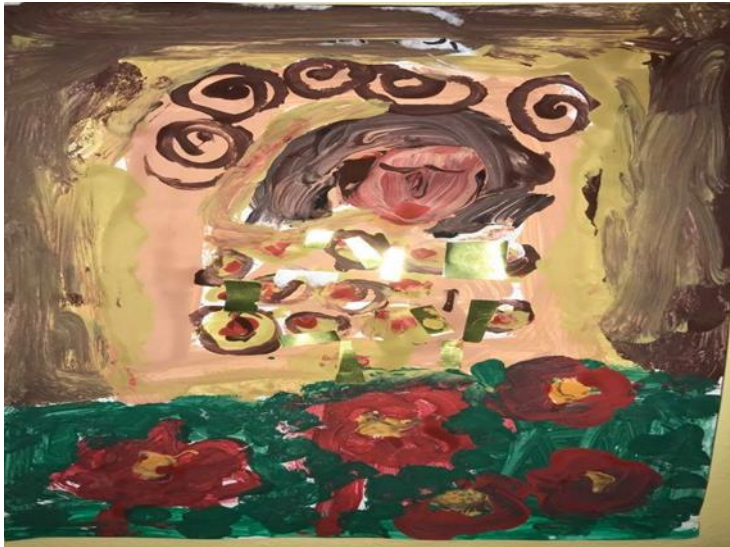
Ana 7 godina

se po položaju prstiju može vidjeti da osoba svira taj instrument, što znači da je u pokretu. Motiv crteža je prepoznatljiv. Crtež je naslikala djevojčica starije vrtićke skupine, te se potvrđuje istraživačko pitanje 1 koje glasi da djeca starije dobne skupine češće prikazuju pokret u likovnom izražavanju te istraživačko pitanje 2 koja glasi da je u likovnim uradcima djece starije dobne skupine prikaz pokreta je točniji i prepoznatljiviji.