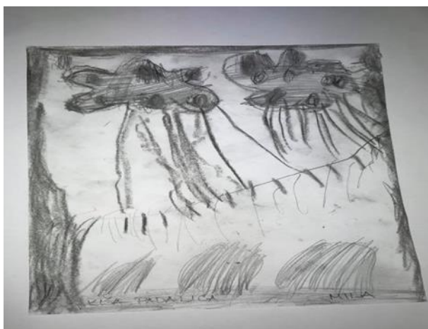
Mila 4,5 godina

Istraživačko pitanje 1 odnosi se na to kako djeca starije dobne skupine češće prikazuju pokret u likovnom izražaju. U ovom slučaju, ovo pitanje ne može se primijeniti na ovaj likovni rad. Motiv za izradu ovog crteža je bila kiša. U crtežu se očituje dinamika kroz crte iz oblaka koje predstavljaju kišu koja pada, te se na podu mogu vidjeti lokve koje nastaju od kiše. Crne sjene i tamne boje nam još bolje predočavaju kako dijete doživljava i kakvog je raspoloženja kada kiša pada. Istraživačko pitanje 4 nije potvrđeno, jer je crtež izradilo dijete mlađe vrtičke skupine, što znači da se i kod djece mlađe vrtičke skupine može pojaviti dinamični prikaz na likovnom uratku.