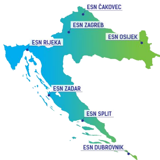
Slika 7. Sekcije ESN-a Hrvatska