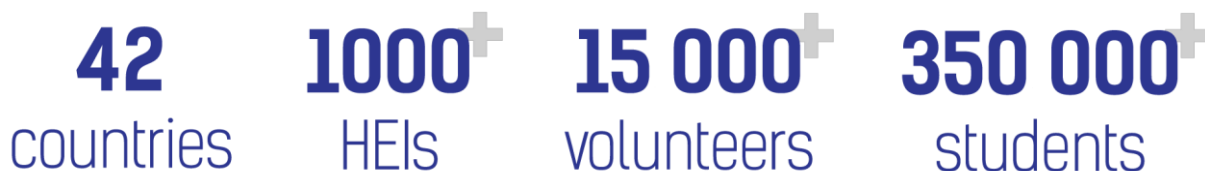
Slika 4. Statistički podaci o veličini Mreže – izvor: https://wiki.esn.org/display/EI/ESN+Basics+Home (preuzeto 1. prosinca 2021.)

Danas Mreža surađuje s više od 1 000 visokoškolskih ustanova iz 42 zemlje, a kontinuirano se razvija i širi. Ima oko 15 000 aktivnih članova koji se u svojim sekcijama (lokalnim organizacijama) brinu o dolaznim, internacionalnim studentima. Tako ESN uključuje oko 50 000 mladih ljudi koji svake godine nude svoje usluge 350 000 internacionalnim studentima, kao što je prikazano na Slici 4.