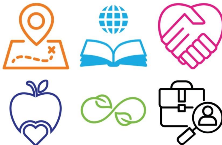
Slika 5. Područja djelovanja ESN-a – izvor: https://wiki.esn.org/display/CE/Causes+of+ESN+Home (preuzeto 1. prosinca 2021.)