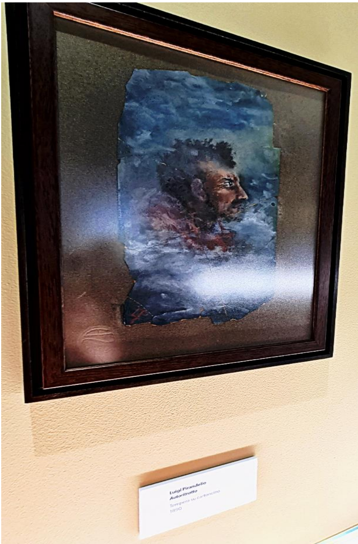
Luigi Pirandello Autoritratto Tempera su cartoncino 1890