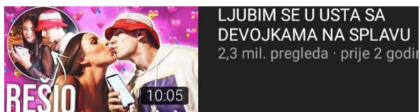
Slika 3: „Opuštajući“ izlazak uoči vikenda na kanalu Bake Praseta

Osim oglašavanja proizvoda influenceri stvaraju ostale sadržaje s ciljem doseganja što veće prepoznatljivosti. Većina sadržaja na razini je prosječnog tabloidskog lista. Međutim na taj način broj nula na pokroviteljskim ugovorima se povećava. Proizvodi ili usluge nisu jedini predmet oglašavanja, promoviraju se ponašanja i vrijednosti. Čemu su djeca izložena?