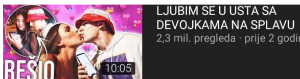
Slika 3: „Opuštajući“ izlazak uoči vikenda na kanalu Bake Praseta

Osim oglašavanja proizvoda influenceri stvaraju ostale sadržaje s ciljem doseganja što veće prepoznatljivosti. Većina sadržaja na razini je prosječnog tabloidskog lista. Međutim na taj način broj nula na pokroviteljskim ugovorima se povećava. Proizvodi ili usluge nisu jedini predmet oglašavanja, promoviraju se ponašanja i vrijednosti. Čemu su djeca izložena?