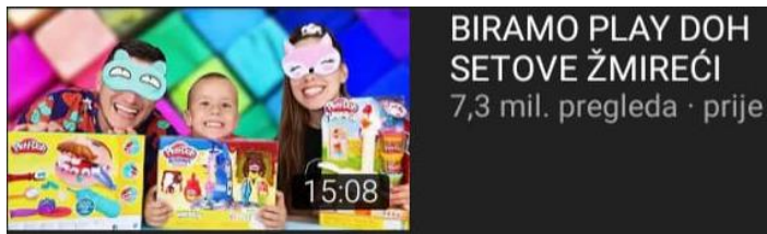
Slika 1: Najpoznatiji dječji YouTuberi reklamiraju proizvod zajedno s djetetom, kanal Zaga i Filip