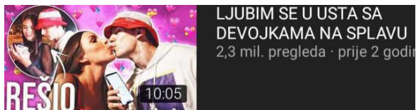
Slika 3: „Opuštajući“ izlazak uoči vikenda na kanalu Bake Praseta

Osim oglašavanja proizvoda influenceri stvaraju ostale sadržaje s ciljem doseganja što veće prepoznatljivosti. Većina sadržaja na razini je prosječnog tabloidskog lista. Međutim na taj način broj nula na pokroviteljskim ugovorima se povećava. Proizvodi ili usluge nisu jedini predmet oglašavanja, promoviraju se ponašanja i vrijednosti. Čemu su djeca izložena?