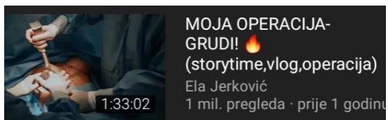
Slika 6: Prikaz naglašenog pokrovitelja na kanalu Ele Jerković