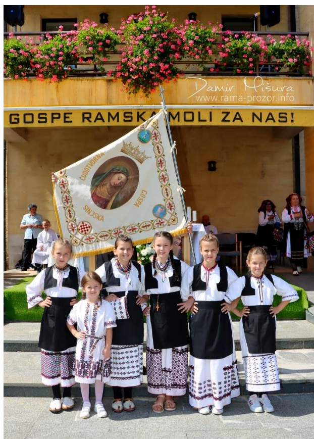
Slika 4: Proslava Velike Gospe u Rami