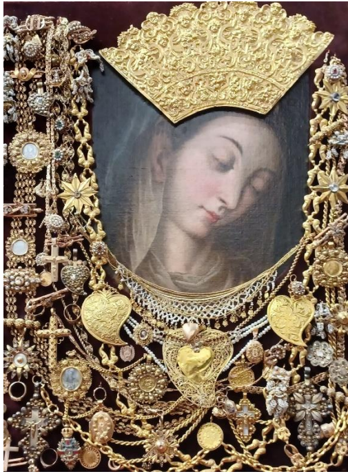
Slika 1: Slika Čudotvorne Gospe Sinjske