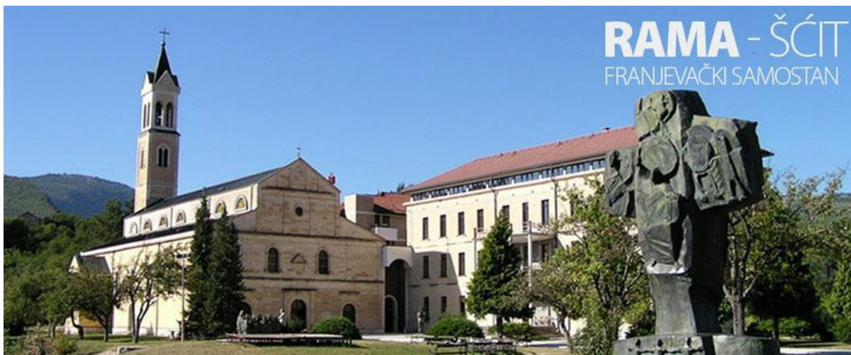
Slika 3: Franjevački samostan Rama-Šćit