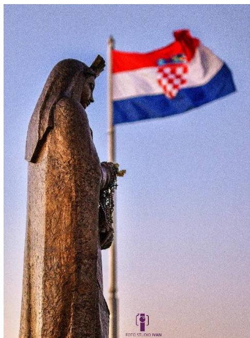
Slika 2: Gospin kip na starom gradu u Sinju