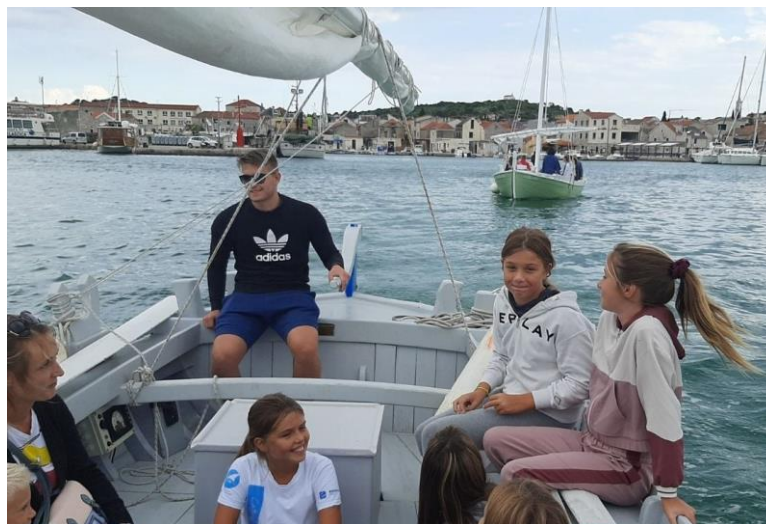
Slika 18. Primjer plovidbe Ljetne škole jedrenja.