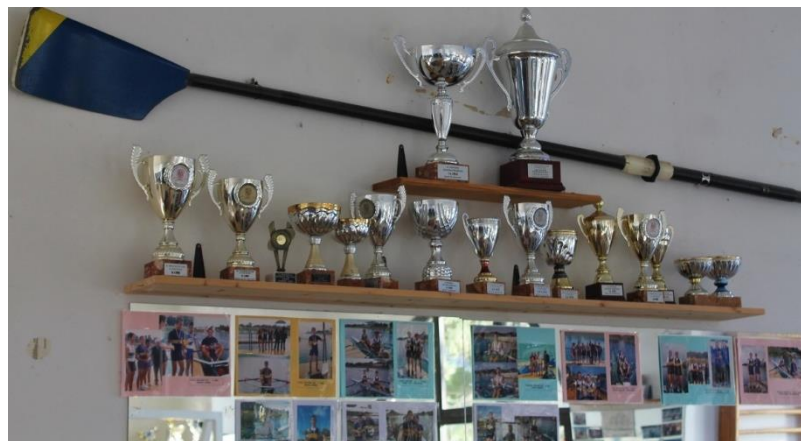
Slika 25. Veliki uspjesi veslača i veslačica Veslačkoga kluba Dupin.