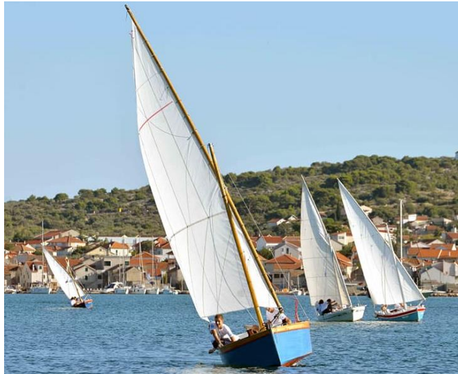
Slika 19. Malo Latinsko idro 2021. (Facebook stranica Latinsko idro , n. d.)