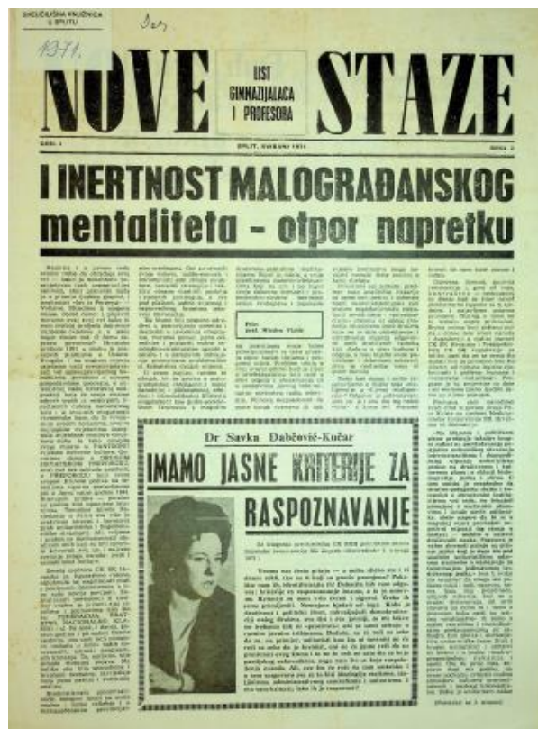
Slika 8: Nove staze, Split, svibanj 1971., br. 2

djelovao je u Splitskom kazalištu i na Dubrovačkom kazališnom festivalu. U svom profesorskom zanatu se istaknuo predavačkim žarom kojim je govorio o hrvatskim glazbenicima i njihovom stilu u glazbi. Smatrali su ga jednim od najboljih poznavatelja kako glazbe tako i povijesti glazbe. Zbog svog djelovanja, načina predavanja je okvalificiran kao gorljivi Matičar. Smatrali su da učenicima približava istaknute hrvatske intelektualce ne bi li ih tako zainteresirao za rad Matice. U razredu je interpretirao tekst Hrvatske domovine ukazujući na estetsku vrijednost i ljepotu glazbene sastavnice. Zbog toga je nakon Karađorđeva bio jedna od meta u Splitu. Doživio je oštru kritiku, a njegov je rad proglašen nacionalističkim zastranjivanjem. UDB-a je inzistirala na tome da ga se udalji iz škole, iz radnog mjesta profesora, što se i dogodilo unatoč protivljenju njegovih kolega prof. Marušića i prof. Zubanovića. Nakon Karađorđeva Nova staze su zabranjene, broj 3 – 4 je uništen u tiskari, a urednici prof. Bošković, prof. M. Mihanović i prof. Vlašić su snosili posljedice svoga uključivanja i djelovanja u Hrvatskom proljeću. 122