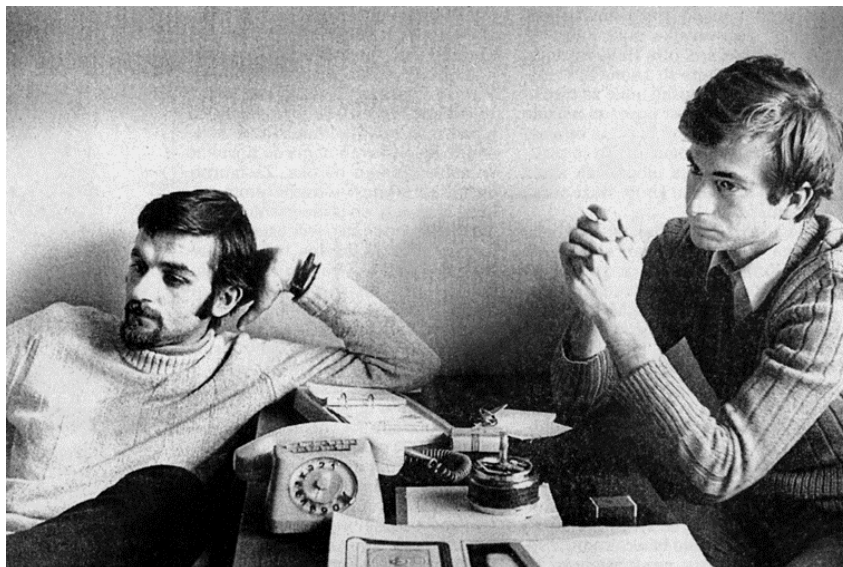
Slika 4: Ivan Zvonimir Čičak i Dražen Budiša

Štrajk je završio kako je i započeo, studentskim zborom. Ono po čemu se razlikovao od zbora kojim je započeo štrajk je bila atmosfera. Studenti su bili svjesni da ih, zajedno s ostatkom Hrvatske, čeka teško razdoblje. To se najbolje vidi u govoru kojeg je održao D. Budiša: „Nad hrvatskim sveučilištarcima i nad hrvatskim narodom nadvila se mora, sablast. Sada nastupa trenutak kada svatko ostajem sam sa svojom savješću i strahom. Dani što dolazi dani su iskušenja. Pri tome će neki pokleknuti, ali to su i trenuci kada se ljudi istinski prepoznaju. Hrvatski studenti usprkos tome ne smiju izdati svoje ideale općenarodnog pokreta. Ako odemo mi, doći se drugi još radikalniji.“ Budišin govor se odnosio na Titovo izlaganje na zasjedanju predsjedništva SKJ održanom početkom prosinca u Karađorđevu. Studentski štrajk je ocijenio kao kontrarevolucionarnu akciju, koja se dugo i pomno pripremala. 67