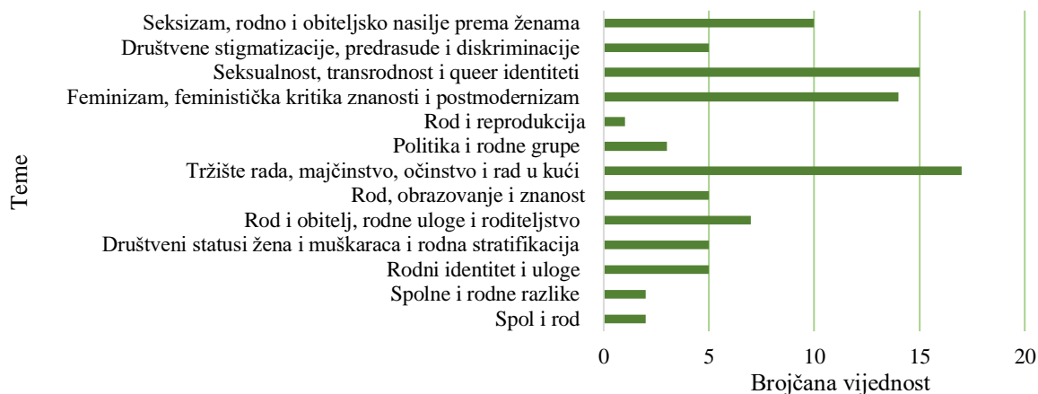
Grafički prikaz 3. Zastupljenosti članaka u odnosu na analiziranu temu

U odnosu na istraživana područja i teme, analizom već spomenutog vremenskog razdoblja, nismo pronašli članke vezane uz kategorije: „biologija i društvo“, „socijalizacija i učenje rodnih uloga“, „društvene upotrebe rodnih uloga“, „kulturalna konstrukcija rodnog identiteta“, „rodni jaz plaća i stakleni strop“, „rod i tranzicija“, „društvene posljedice rodnog nasilja“ i „nove reproduktivne tehnologije“, pa su iste zbog lakšeg razumijevanja, uklonjene iz daljnjeg prikaza i objašnjenja.