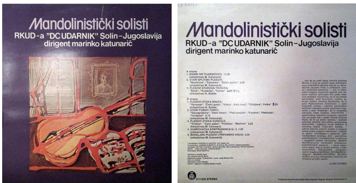
Slika 10. Izgled albuma mandolinističkih solista iz 1982.