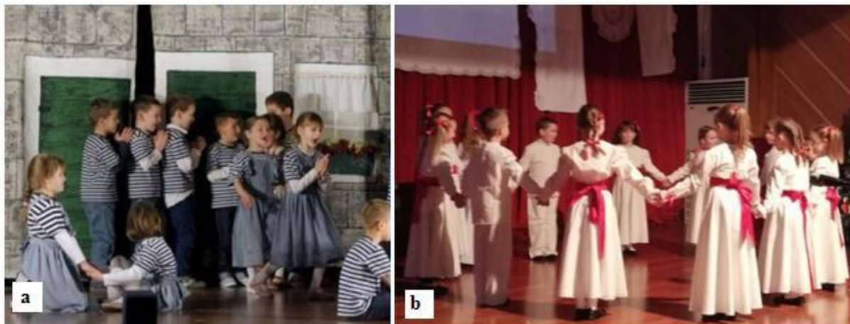
Slika 21. Improvizirane dalmatinske (a) i slavonske (b) nošnje dječjih vrtićkih skupina

haljinama za djevojčice ukrašenim crvenom vrpcom oko struka te bijelim košuljama i hlačama za dječake (Slika 21).