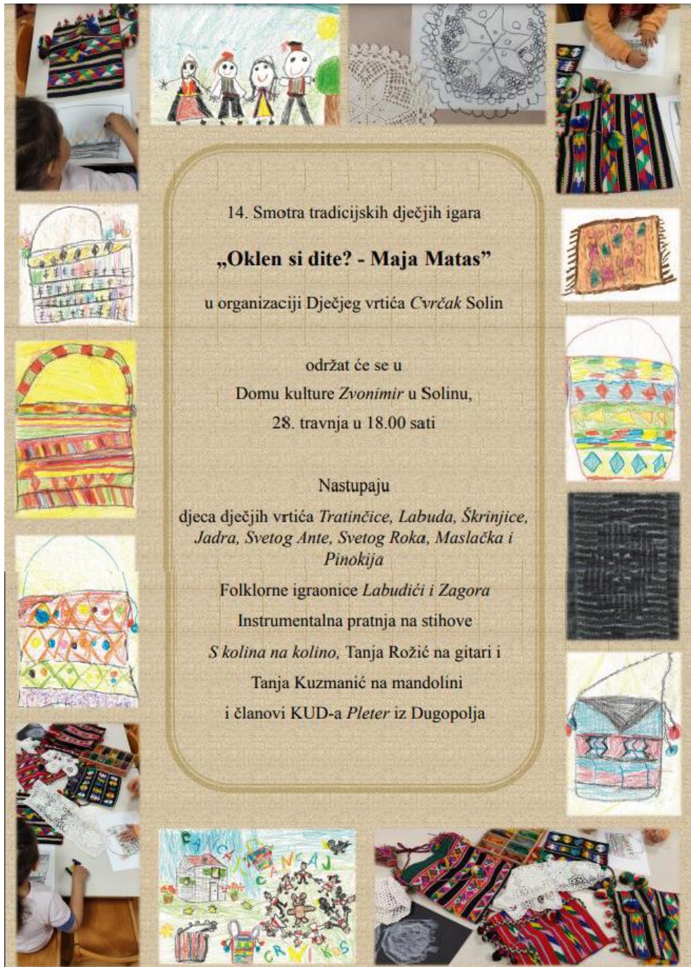
Slika 20. Plakat manifestacije Oklen si dite? – Maja Matas

Izvor: https://www.dalmacijadanas.hr/wp-content/uploads/2022/04/Plakat.pdf (preuzeto: 28. kolovoza 2022.)