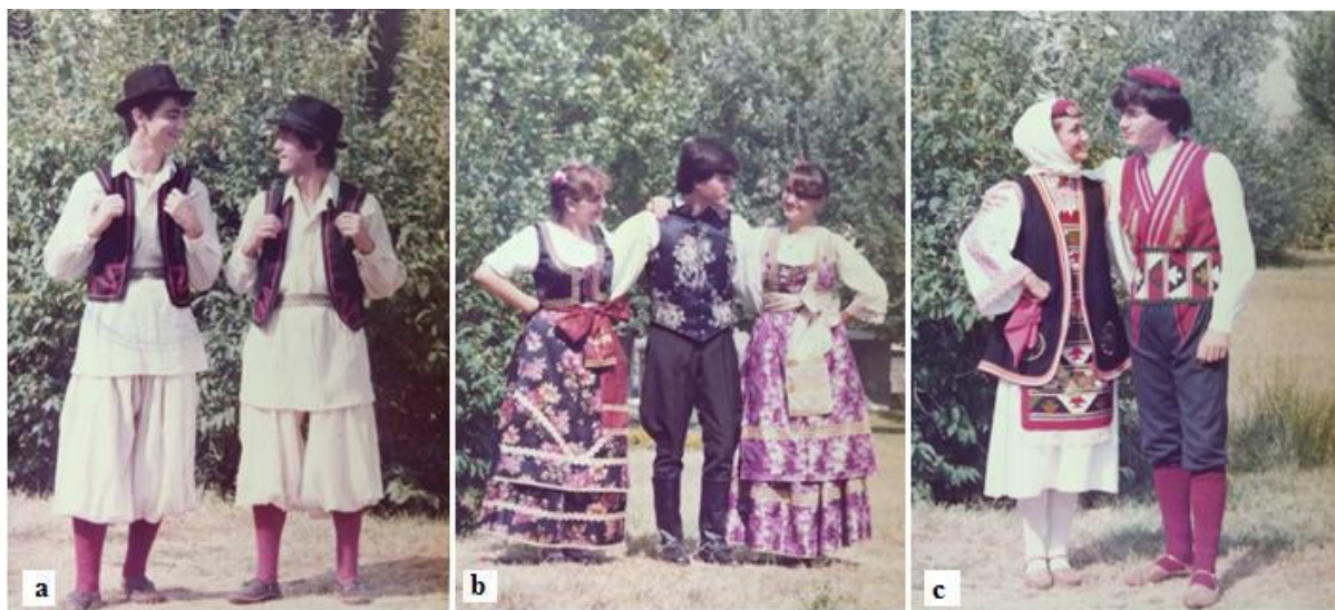
Slika 13. Banatska (a), bunjevačka (b) i vrlička (c) nošnja u posjedu KUD-a Salona

koreografije Ero s onoga svijeta . Banatska nošnja u KUD je stigla 1977., a bunjevačka 1983. Slika 13 prikazuje neke od nošnji koje je KUD Salona posjedovao u to vrijeme, a fotografije članova prvog ansambla u nošnjama snimljene su 1985.