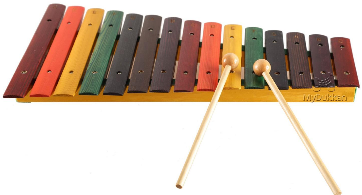
Slika 2. Ksilofon

Ksilofon ima drvene pločice raznih dužina i debljina koje proizvode tonove različite visine. Svira se batićima obloženima tvrdim filcom. Pločice su postavljene na postolje i mogu se mijenjati pa se pločice koje nisu potrebne za pojedinu pjesmu mogu izvaditi iz instrumenta. Na taj način dijete će lakše pogoditi pločicu koja mu je potrebna. Na svakoj pločici piše ime tona. Batićima treba udariti sredinu pločice i odmah odmaknuti batić kako bi pločica mogla titrati te tako proizvoditi zvuk. Titranje pločice traje kratko (Gospodnetić, 2015:179).