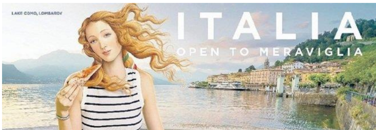
Foto1 Venere, open to meraviglia

“La campagna – ha commentato il ministro del Turismo Daniela Santanchè – serve per vendere la nostra Nazione e le nostre eccellenze, in un modo inedito, mai fatto in Italia prima d’ora: un video che sarà su tutte le ferrovie, le televisioni e gli aeroporti, con la consapevolezza che la pubblicità è l’anima del commercio – e noi dobbiamo saper vendere l’Italia. La Venere del Botticelli, allora, simbolo della rinascita e della primavera che fiorisce dopo il rigido inverno pandemico, è la testimonial d’eccezione che ci prende per mano e ci accompagnerà lungo questo percorso.” 83