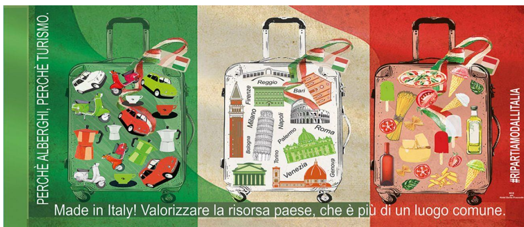
Foto2 Made in Italy ( https://piccoloresort.eu/2020/05/08/made-in-italy-ripartire-da-un-turismo-di-qualita-per-far-fronte-allemergenza-covid-19/ ) (8/5/2023)

memorabile, che vada al di là delle attrazioni turistiche superficiali, consentendo loro di vivere la cultura, le tradizioni e lo stile di vita italiani in modo autentico.