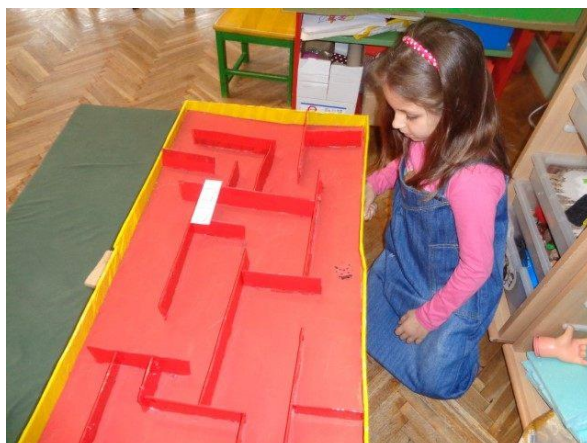
Slika 3. Dijete igra igru „magnetski labirint“