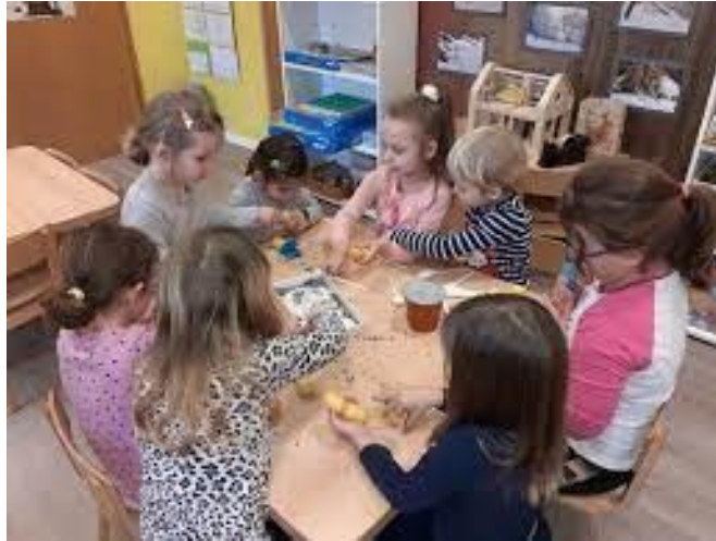
Slika 2. Djeca pune kutijice različitim materijalima