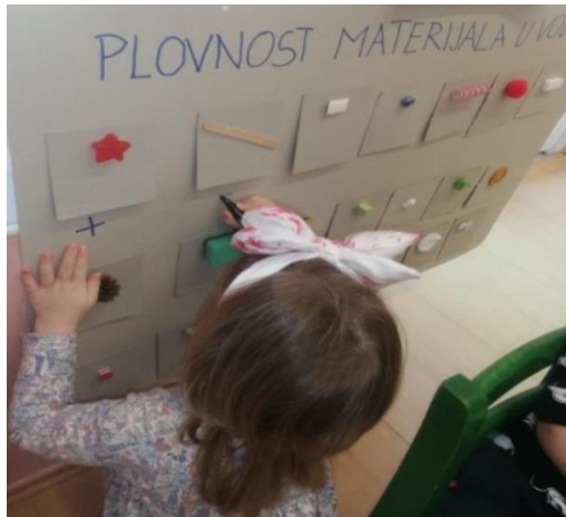
Slika 1. Dijete na ploču zapisuje spoznaju o plovnosti materijala u vodi