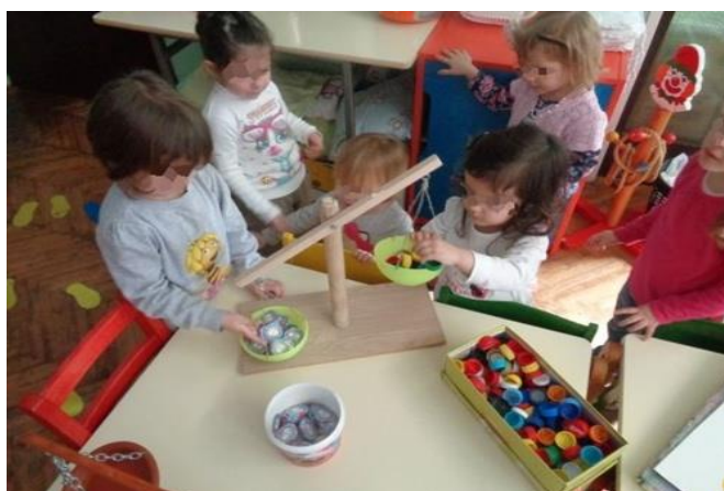
Slika 4. Djeca koriste vagu za istraživanje težine ponuđenih predmeta

Djeca u vrtiću ne uče matematiku, ali razvijaju predmatematičke vještine u stimulirajućoj okolini. Kroz igru i istraživačke aktivnosti djeca uočavaju odnose u prostoru, odnose među predmetima, svojstva predmeta, količinu i sl. Sve to utječe na razvoj matematičkih kompetencija i rješavanje problema primjenom matematičkog razmišljanja. Istraživanjem težine predmeta kao i uspoređivanjem težine dvaju ili više predmeta djeca razvijaju matematičke kompetencije. Slunjski (2006) navodi izradu vage kao poticaj istraživačke aktivnosti vaganja. Materijali poput vješalice, dviju jednakih posuda, konca i drvenog stalka su dovoljni da se u skupini izradi vaga nakon čega se nude materijali čiju će težinu djeca moći istraživati i uspoređivati.