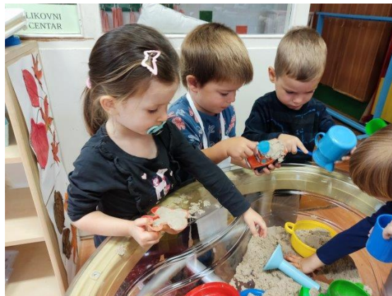
Slika 5. Djeca istražuju pijesak raznovrsnim materijalima

Pijesak je djeci zanimljiv fenomen izučavanja te isto kao i voda i boja smatra se terapijskim materijalom (Došen-Dobud, 2016). Djeca se često susreću s njim na plažama, u pješčanicima, u prirodi te iz toga razloga nije teško za shvatiti da je on djeci čest interes istraživanja. Pješčanici u vrtićima su tradicionalni dio organiziranja prostora (Došen-Dobud, 2016). Za potrebu dječje igre odgovara kako suhi tako i vlažni pijesak. Uloga odgajatelja je da ponudi materijale koji će omogućiti djetetu detaljno istraživanje pijeska. Nakon fizičkog upoznavanja djece sa svojstvima pijeska uvode se složeniji materijali. Došen-Dobud (2005) navodi kako je pogrešno djecu nuditi jednovrsne materijale u pješčanicima jer se time suzbija dječja kreativnost. Umjesto toga djeci trebaju biti na raspolaganju predmeti različitih površinskih i strukturnih svojstava npr. drveni, limeni, papirnati, tvrdi, meki i sl. Djeci možemo ponuditi različite predmete s dnom i bez dna, sredstva za građenje, dodani materijali različitih reljefnih obilježja, igračke i drugo (Došen-Dobud, 2005).