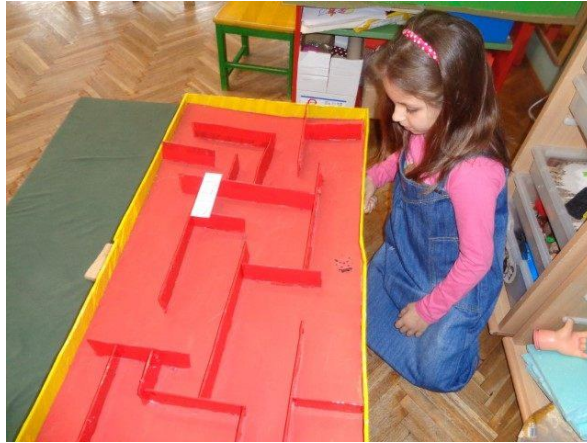
Slika 3. Dijete igra igru „magnetski labirint“