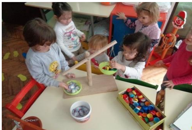
Slika 4. Djeca koriste vagu za istraživanje težine ponuđenih predmeta

Djeca u vrtiću ne uče matematiku, ali razvijaju predmatematičke vještine u stimulirajućoj okolini. Kroz igru i istraživačke aktivnosti djeca uočavaju odnose u prostoru, odnose među predmetima, svojstva predmeta, količinu i sl. Sve to utječe na razvoj matematičkih kompetencija i rješavanje problema primjenom matematičkog razmišljanja. Istraživanjem težine predmeta kao i uspoređivanjem težine dvaju ili više predmeta djeca razvijaju matematičke kompetencije. Slunjski (2006) navodi izradu vage kao poticaj istraživačke aktivnosti vaganja. Materijali poput vješalice, dviju jednakih posuda, konca i drvenog stalka su dovoljni da se u skupini izradi vaga nakon čega se nude materijali čiju će težinu djeca moći istraživati i uspoređivati.