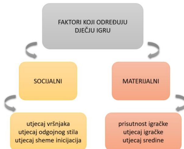
Slika 2 - Shematski prikaz faktora koji određuju dječju igru (prema Van der Kooij i Mayjes, 1986)