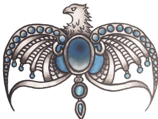
Fotografija broj 9. Dijadema Rowene Rawenclaw . 82

Kalež Helge Hufflepuff bio je u vlasništvu Helge Hufflepuff, jedne od osnivačica Hogwartsa. Priča iza predmeta nije jednako dramatična kao ona osnivačice Rawenclawa, ali prikazuje teoriju kako je Voldemort htio prikupiti predmete osnivača Hogwartsa zato što je prezirao školu. „Podignut u zrak za gležanj, Harry je udario u kalež koji se krenuo umnožavati, ispunjavajući skučeni prostor. Uz krikove boli, Ron, Hermiona, i dva goblina bačena su na druge predmete, koji su se također počeli razmnožavati. Napola pokopani u rastućoj plimi vrućeg blaga, borili su se i vikali. Harry je provukao mač kroz dršku Hufflepuffove šalice, zakačivši ga za oštricu.” 83