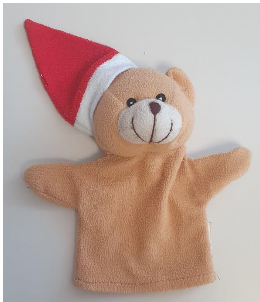
Fotografija broj 2. Ginjol lutka