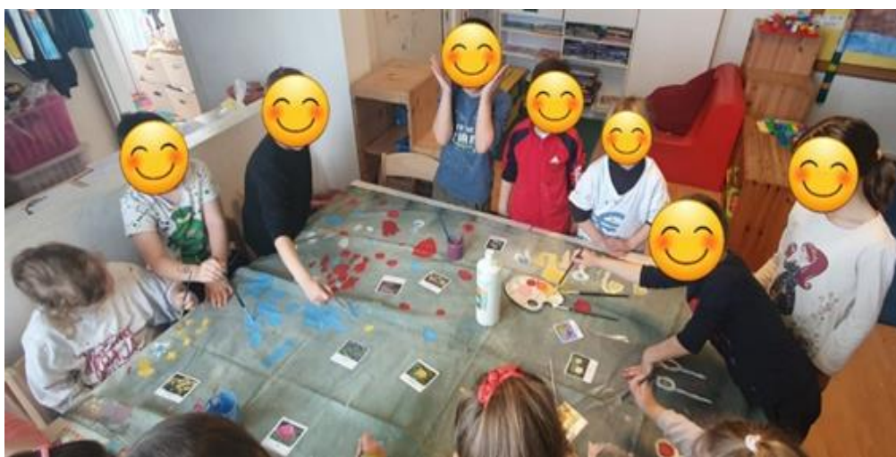
Fotografija broj 1. Zajednička livada- paravan

U nastavku ćemo objasniti primjer iz prakse dramatizacije priče Plesna haljina žutog maslačka autorice Sunčane Škrinjarić. Odgajateljice dječjeg vrtića Vrtuljak u Splitu nakon čitanja navedene priče prepoznale su interes djece za razne vrste cvijeća što je bilo dodatno potaknuto dolaskom proljeća, ali i projektom Kukci koji je bio u tijeku. Kako bi produbile dječji interes, znanja, spoznaje, ali i kreativno izražavanje odlučile su napraviti predstavu za djecu. Odgajateljice su prvo odredile koje uloge su im ključne za predstavu s ciljem da se ne izgubi srž priče. Zatim su podijelile uloge između sebe i prilagodile tekst tako da su izbacile nepotrebne dijelove, skratile dugačke rečenice i promijenile nepoznate riječi kako bi dijalog djeci bio razumljiv i zanimljiv. Nakon čega je uslijedio dogovor o samoj animaciji lutke (kako će se koja lutka kretati), rasporedu lutaka u scenama, boji glasa koji će lutke imati, kao i dolazak i odlazak lutaka sa scene. U likovnom centru djeca su zajedno temperama oslikavali velikom platnu koje je kasnije poslužilo kao paravan (fotografija broj 4).