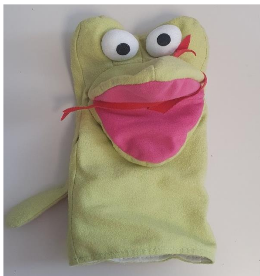
Fotografija broj 1. Lutka zijevalica