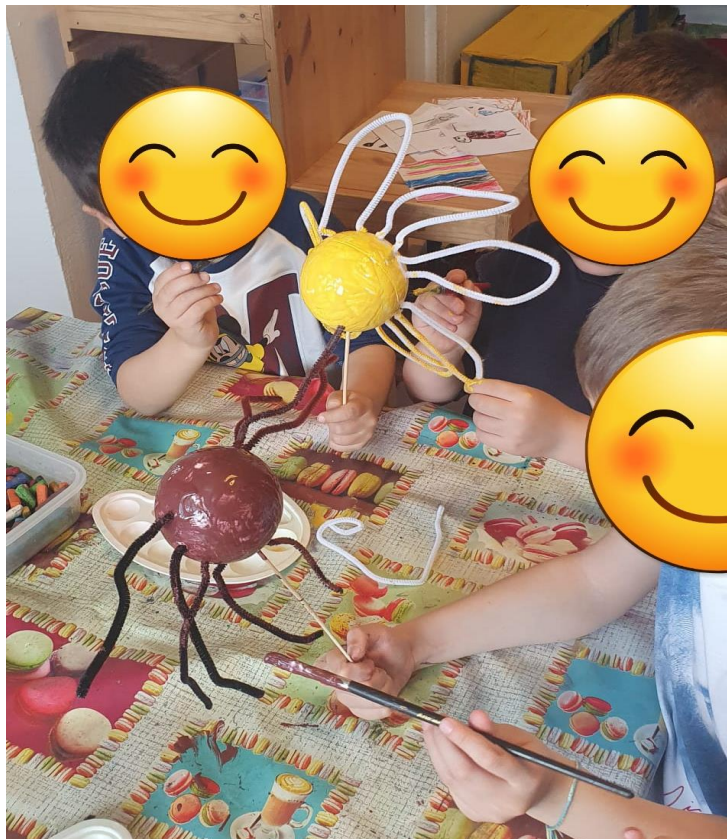
Slika 2. Izrada lutki

Djeca su izradila vlastite lutke maslačka, pauka, bubamare i leptira uz pomoć odgajatelja. Podijelili su se u manje skupine ovisno kojeg lika su željeli napraviti, nakon čega su odredili da bubamara i leptir budu ginjol lutke, a maslačak i pauk štapne lutke (fotografija broj 5). Za glazbu su korištene klasične skladbe (na primjer Valcer cvijeća ), dok su za rasvjetu korišteni reflektori i ukrasne lampice, a za rekvizite su poslužili već ranije napravljene dječje kreacije (poput stabala od kolaža, crteži cvijeća, kukaca i sunca). Nakon predstave odgajateljice su s djecom razgovarale o njihovim najdražim dijelovima predstave, što im se nije svidjelo i što bi promijenili. Cijela predstava i aktivnosti prije predstave su dokumentirane videozapisom i fotografijama, a napravljene lutke su dane djeci na korištenje u dramski centar kako bi i oni mogli animirati likove na svoj autentičan način.