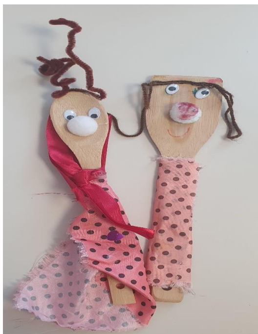
Fotografija broj 3. Štapne lutke

Kroz dramatizacije lutke unutar književnog teksta može se razumjeti dječja reakcija na temelju ponašanja, uloge ili situacije u kojoj se nalazi njegova lutka, kao i kroz način kako je dijete animira. Dijete u lutki može prepoznati sebe ili sebi druge važne osobe ili se prisjetiti nekog svog iskustva čime ona postaje dio njegovog unutarnjeg svijeta i izaziva emocionalne doživljaje (Kudek Mirošević 2009: 171). Prema autorici Verdonik (2011: 145) upravo „iz simboličkog čuda oživljavanja lutke i pripovjednog diskursa proizlazi povezanost bajke i lutkarskog igrokaza kao osnove za lutkarsku predstavu”.