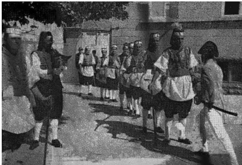
Slika 8: Prizor iz blatske kumpanije (g.1966).

Kumpanija započinje razgovorom između srdara , predstavnika tuđinske vlasti koji domaćoj vojsci brani slobodno kretanje i kapitana koji mudro pridobiva srdarovu dozvolu za djelovanje na opće oduševljenje cijele vojske. Srdar predvodi mačevalački ples, a četa ga prati. Slijedi dvoboj koji se okončava prijateljskim poljupcem sukobljenih, nakon čega na podij stupaju urešene djevojke kako bi zajedno s mladićima otplesale „blatski tanac“. Vitešku je igru u stara vremena pratio i ritual sječe volovske glave koji je zbog okrutnosti izvođenja zabranjen. 203