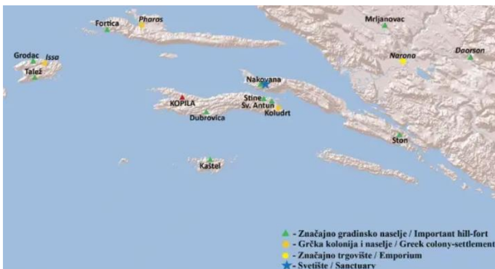
Slika 1: Srednji Jadran u protopovijesti/helenizmu (izradio: I. Borzić)