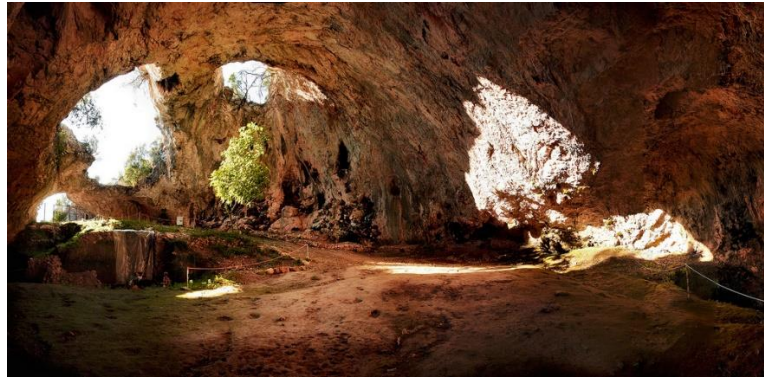
Slika 4: Fotografija Vele Spile preuzeta na poveznici: https://www.facebook.com/vela.spila/