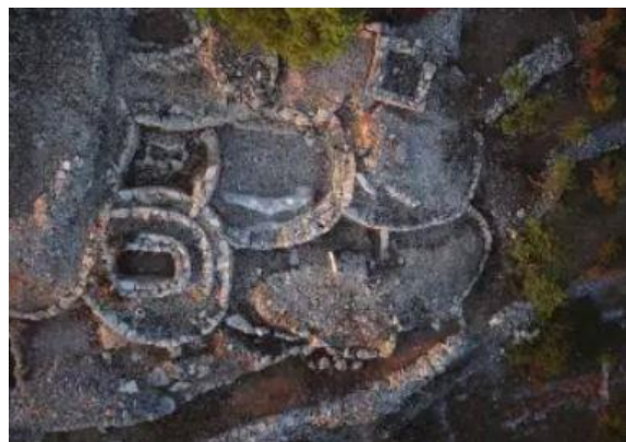
Slika 3: Zračna fotografija nekropole (foto: M. Vuković) - preuzeta iz Borzić (2017:312).

Sastoji se od povezanih, zidom obrubljenih grobnica ovalno-kružnog nepravilnog tlocrta, u promjeru od šest do dvanaest metara. Pretpostavlja se da postoji, trenutno nelocirana, inicijalna grobnica oko koje su nadograđene sve ostale. Grobnice se sastoje od središnjeg ovalnog ili pravokutnog prostora koji je obzidan dva metra visokim suhozidom oko kojeg se nalazi drugi, niži suhozid, oko kojeg je još jedan koncentrično sagrađen suhozid koji je niži i od drugog suhozida što građevini daje stepenast izgled. „Prilikom svakog novog ukopa bilo je potrebno otvoriti grobnicu, pri čemu se stvarao kameni lijevak koji je prijetio urušavanjem.“ Istraživači smatraju da su suhozidni prstenovi koji se nalaze oko središnjeg sagrađeni kako bi spriječili urušavanje. Na dno grobnice stavljalo se morsko žalo na koje su se potom u ležećem