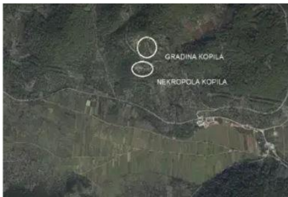
Slika 2: Zračna fotografija Blatskog polja i položaja gradine Kopila (foto: L. Frlan) – preuzeta iz Borzić (2017:311).

Kazivač spominje gradinu Gradac koja se nalazi u Potirni. Gradina Gradac, kao i gradina Kopila, datira iz druge polovice 1. tisućljeća pr. Kr.. Budući da je nekropola Kopila jedinstveno prostorno i arhitektonski organizirana, posvetit će joj se malo više pažnje. Nekoć utvrđena suhozidnim bedemima i dvjema devedeset metara udaljenim kulama, strateški smještena na brdu s pogledom na Velolučki zaljev, Vis, Paklene otoke i Korčulanski kanal, a iznad plodnog Blatskog polja, nekropola Kopila ili „Grad mrtvih nad poljem života“ 66 bila je centralno naselje na zapadnom dijelu otoka između četvrtog i prvog stoljeća pr. Kr. U njenom se središtu nalazila citadela, a u podnožju radijalno nanizane vinogradarske terase ukupne površine 3 hektara. Četiristo metara od citadele sagrađena je nekropola s lociranih dvanaest grobnica koje su bile višestruko korištene. 67