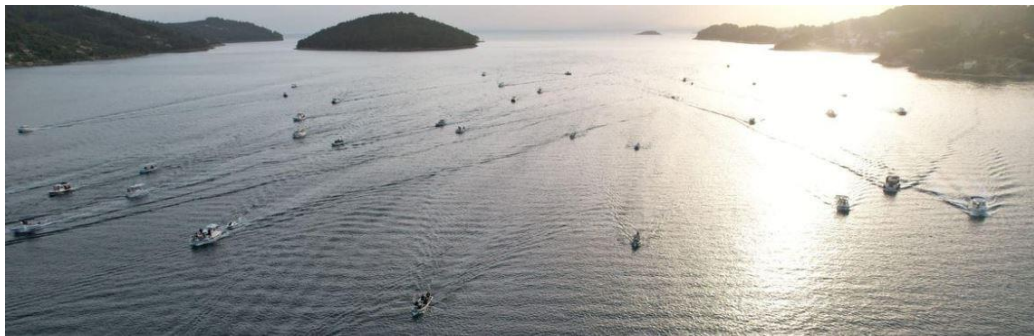
Slika 7: Velolučka regata

Ivana, pa sve do Vele Luke, odvija se i Mala ragata u kojoj se natječu djeca. Dio mještana potporu natjecateljima izražava prateći utrku svojim barkama, a ostatak ih, u slavljeničkom duhu, dočekuje na rivi. 131 Potom slijedi pučka „fešta“ uz pjesmu „Rascvalo se cviće od bršćana, na Glavici svetoga Ivana“, ples i narodna kola, 132 te obilje ribe i domaćih kolača. 133