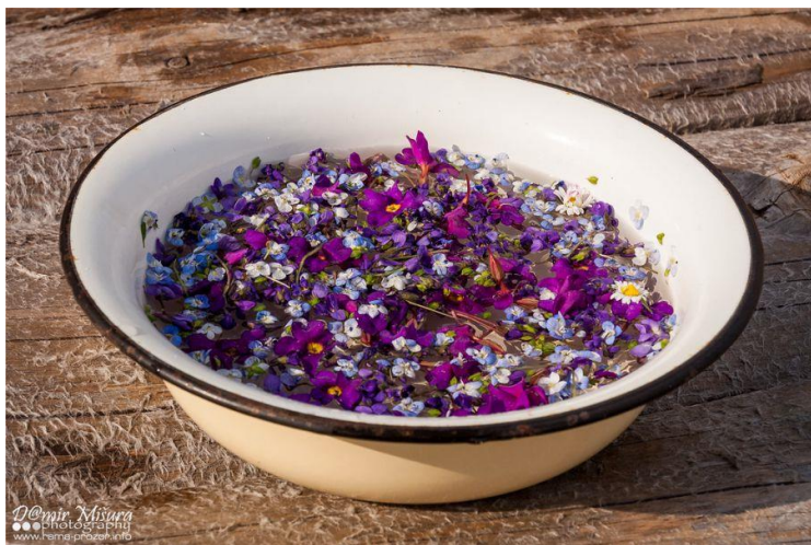
Slika 3: Umivanje u ljubičicama

Prije je bila svaka četvrta nedilja misa. Kad bi bila blagoslov maslina na Cvitnicu, onda bi svak odnio zero masline na svoju njivu. Kad završi misa, onda se kaže: „Iđen ja otić gori odnit zero masline.“ Danas je to sve ošlo u zaborav. Ja imam običaj odnit zero masline ode di sadimo kumpire, šta ću nosit gori, Bože prosti di ništa ne sadimo. 87