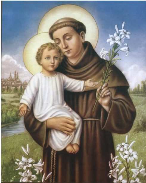
Slika 6: Sveti Antun Padovanski

O svetom Anti bi se nosilo runo vune. I kad bi se ošišale ovce, nosilo bi se svetome Anti u crkvu u Vučevicu. To je davno bilo. Šta su s tom vunom radili, neman pojma. 138