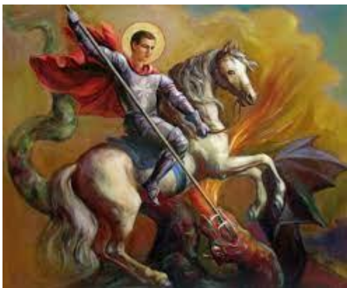
Slika 4: Sveti Juraj i pobjeda nad zmajem