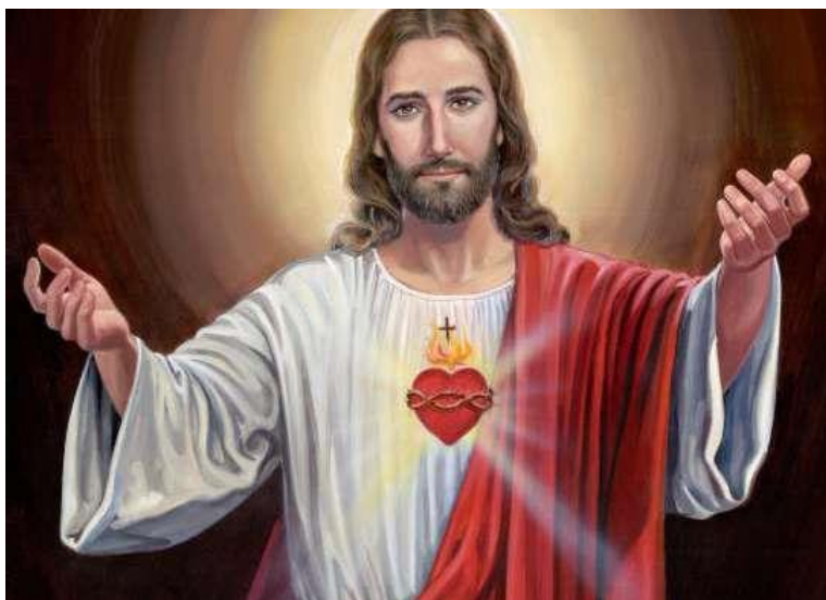
Slika 5: Presveto Srce Isusovo