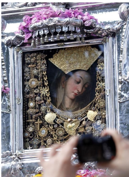
Slika 7: Slika Čudotvorne Gospe Sinjske