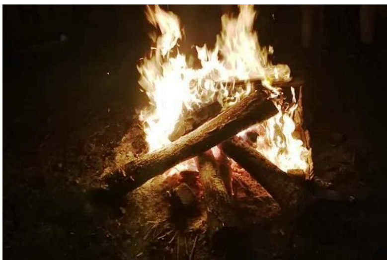
Slika 2: Paljenje badnjaka na Badnju večer