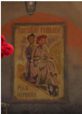
Fig. 8.4, Locandina, Roman holidays , Luca (2021)