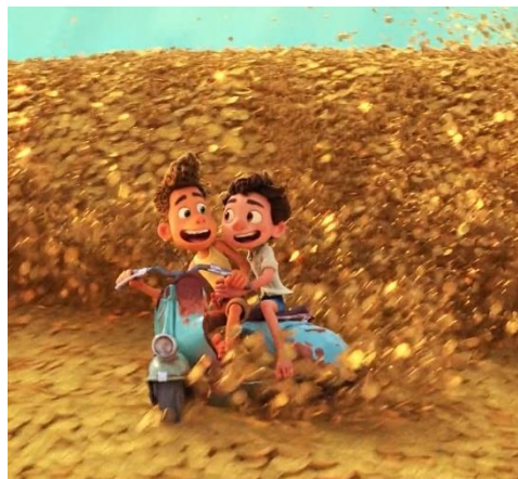
Fig.3. la stanza piena di monete, Luca (2021)

Fig. 3 serve per dimostrare che anche nel mondo del cartone animato appare la questione del denaro e delle merci. Luca e Alberto immaginano di trovarsi in una stanza piena di monete d'oro con le quali potrebbero permettersi di acquistare la Vespa.