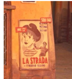
Fig. 8.3, Locandina di La Strada , Luca (2021)