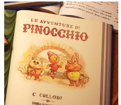
Fig. 8.6, Il libro di Pinocchio , Luca (2021)

La musica è un elemento importante per creare l'atmosfera, dice anche qualcosa dei protagonisti, delle loro esperienze, vicende, sentimenti, immaginazioni. Siccome Casarosa era ispirato alla musica degli anni Cinquanta e Sessanta: "I always felt there was something very lovely about the Italian Golden Age—the '50s and '60s. The cinema and the music of that