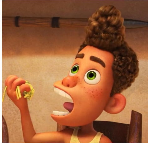
Fig. 10, L'espressione facciale, Luca (2021)

A volte intere scene contengono degli elementi che si trovano nei film d'animazione di Miyazaki. I suoi film d'animazione si distinguono dagli altri perché, invece che ogni momento del film fosse segnato da un'azione, i personaggi a volte stanno solo in silenzio a guardare intorno a sé per dare attenzione al senso di tempo e luogo. Questo momento del silenzio, del vuoto ha il suo nome - in giapponese si chiama 'ma':