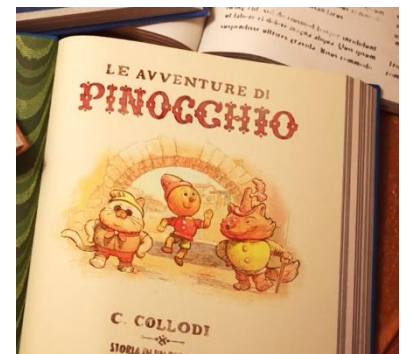
Fig. 8.6, Il libro di Pinocchio , Luca (2021)

La musica è un elemento importante per creare l'atmosfera, dice anche qualcosa dei protagonisti, delle loro esperienze, vicende, sentimenti, immaginazioni. Siccome Casarosa era ispirato alla musica degli anni Cinquanta e Sessanta: "I always felt there was something very lovely about the Italian Golden Age—the '50s and '60s. The cinema and the music of that