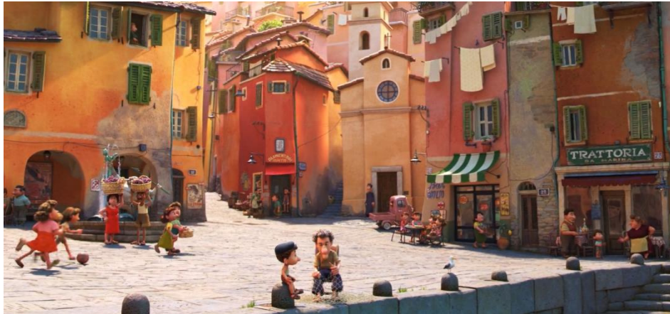
Fig. 7 L'aspetto del progresso comune, Luca (2021)

Fig. 7 serve per dimostrare la nuova vita sociale aperta al mercato che si vede dai negozi come la trattoria e la frutteria. Questa figura serve altrettanto per dimostrare l'inizio della vita dei piccoli artigiani e del mondo operaio creando un senso di comunità e dell'attività sociale.