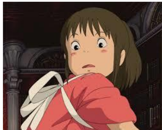
Fig. 9, la somiglianza dei personaggi

Nel caso di Luca, gli occhi spalancati con i pupilli dilatati sono segno di sorpresa per l'idea di ottenere libertà acquistando lo scooter. Inoltre, si è data la massima attenzione alla forma della faccia così i personaggi “do a lot of silly mouth shapes like the "ooh" shape, or big mouth shapes when they're eating pasta” 85 (l’animatore Venturini) come si vede dalla fig. 10.