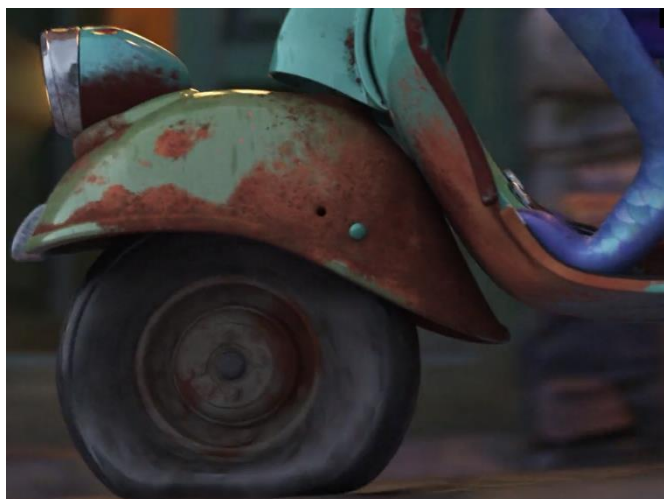
Fig. 5 La ruota arrugginita della Vespa, Luca (2021)

Comunque la scena viene seguita da acclamazioni di felicità per averla vinta. Come Baudrillard dice: “Movement alone is the basis of a sort of happiness, but the mechanical euphoria associated with speed is something else altogether, grounded for the imagination in the miracle of motion” 78 e per loro il movimento indica la vittoria, la felicità e il senso di aver riuscito a completare il loro sogno. Visto che si sta disattivando, devono ripararla investendo i soldi “We’re gonna fix this thing up” (01:20:28). Ancora una volta emerge la questione del denaro –il centro del mondo capitalista. Secondo Appadurai, avere un prodotto in cui non si deve investire ogni tanto, non contribuisce alla crescita dell’economia, ma la frena impedendo di incassare denaro: “Most consumer goods are, after all, destined to be terminal — or so, at least, it is hoped by the manufacturer. There is an area of our economy in which the selling strategy rests on stressing that the commoditization of goods bought for consumption need not be terminal.” 79