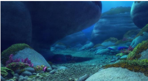
Fig. 12, Luca (2021)

Le scene del mondo sotterraneo sono più scure, più fangose, il mondo sottomarino è un mondo di alghe, di profondità. D’altra parte, appena usciti alla superficie, i colori diventano più luminosi con il mare brillando sotto i raggi del sole come si vede dalle fig. 12 e 13.