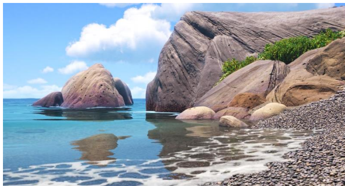
Fig. 11, Il momento di 'ma', Luca (2021)

Seguendo il concetto di 'ma', pure in Luca sono presente le tracce del silenzio. Per la prima volta quando Luca si trasforma, guarda attorno diventando conscio del modo esterno – si rende conto delle onde del mare e del vento leggero come si vede dalla fig.11.