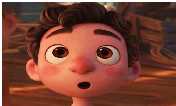
Fig.1. la sorpresa di Luca dopo aver visto Vespa, Luca (2021)

La Vespa per la prima volta appare su una locandina appesa nella torre di Alberto e nel momento in cui Luca la vede, la sua espressione facciale dice tutto, come si vede dalla fig. 1 – ne rimane sorpreso, a bocca aperta e istantaneamente immerge nel suo mondo di fantasia.