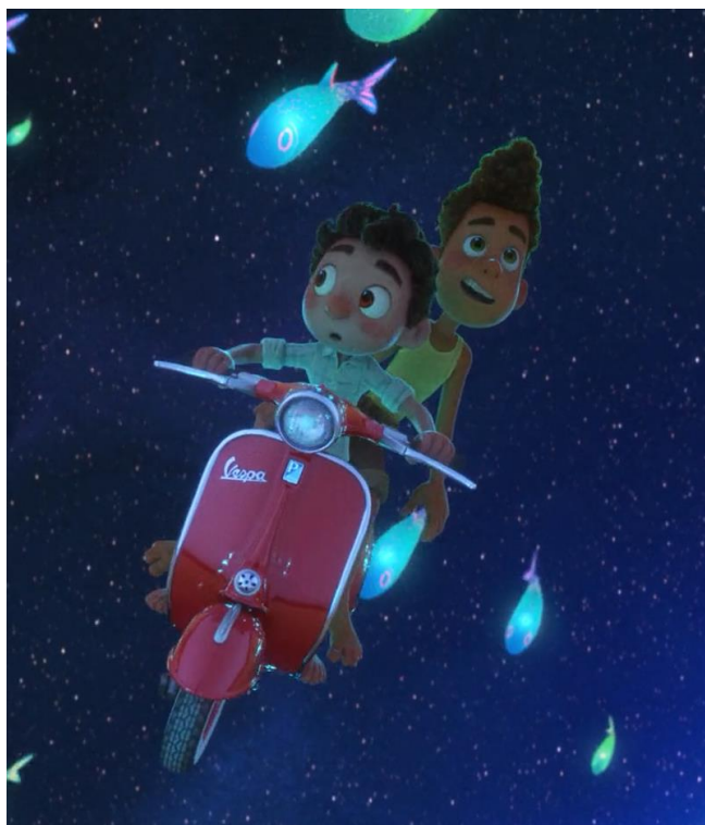
Fig. 6 La Vespa servendo come le ali, Luca (2021)