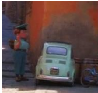
Fig. 8.2, Fiat, Luca (2021)