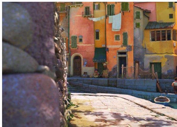
Fig. 14, La tecnica di dappled light , Luca , (2021)

In generale, si è cercato di creare l'atmosfera dell'estate italiana “capturing the idea that it's a child's memory of that summer, so everything is way more vibrant—bigger and more saturated than reality.” 90 (direttore artistico di colore Chia-Han Jennifer Chang). Per indicare il tempo estivo, si è usata la tecnica ‘dappled light’, cioè la tecnica con cui si indica che la luce solare scorre attraverso le foglie degli alberi creando l'ombra (la figura 14): “Sometimes we would expose for the shadows and let the background get really bright and blown out.” 91 (il direttore della fotografia Kevin White)