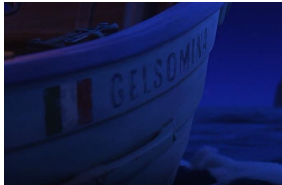
Fig. 8.5, La nave Gelsomina , Luca (2021)