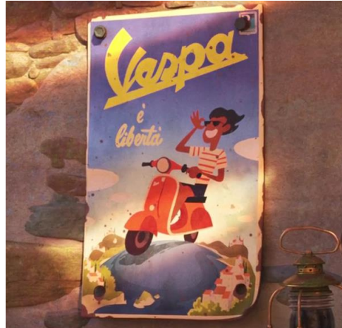
Fig.2. la locandina dimostrando l'uomo guidando la Vespa sulla superficie, Luca (2021)

A catturare la sua attenzione è l'idea che essa vende libertà il che significherebbe la fuga del mondo marino consentendogli di avere il controllo sulla sua vita. In secondo luogo sta il fatto che la locandina, come si vede dalla fig. 2, dimostra l'uomo guidando la Vespa sulla superficie della terra che lo incuriosisce ancora di più siccome sua madre gli dice che la terra è pericolosa a causa dei pescatori che lo potrebbero cacciare.