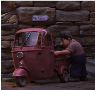
Fig. 8.1, Vespa ape, Luca (2021)