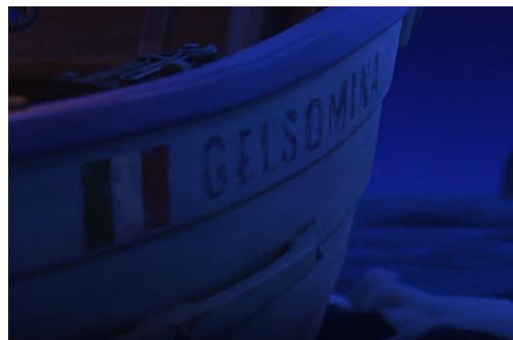
Fig. 8.5, La nave Gelsomina , Luca (2021)