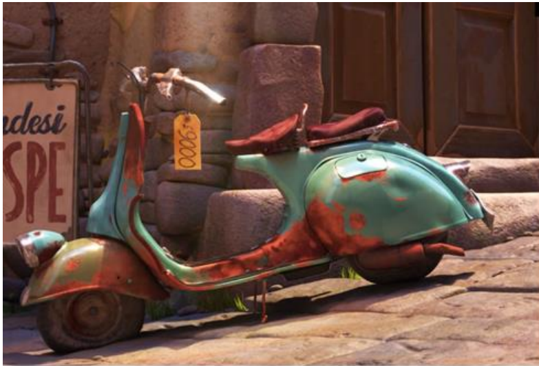
Fig. 4. La luce illuminando Vespa, Luca (2021)

La fig. 4 mette in centro la Vespa illuminandola dall'alto, come se i raggi del sole la illuminassero, mentre infatti si tratta della luce che Luca immagina che è frutto della sua immaginazione.