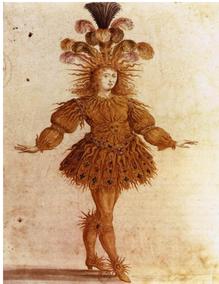
Slika 1: Luj XIV. u „Ballet de la Nuit“ 5

1661. godina izrazito je značajna u povijesti baleta jer je Luj XIV tada s P. Beauchampom utemeljio Academie royale de danse. U ovom razdoblju balet je doživio najveći procvat. Otvorenjem akademije osposobili su se prvi profesionalni kazališni plesači, a ples se počeo prikazivati u javnim kazalištima, umjesto u dvorovima (Adulmar, Simončić, 2016). Pojavom sve većeg broja profesionalaca širio se i opseg pokreta, pa su postajali sve složeniji i zahtjevniji.