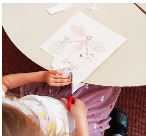
Slika 22: „oblačenje balerine“