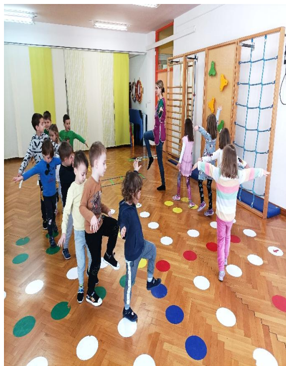
Slike 11 i 12: Različiti oblici hodanja (na prstima uz podignute ruke te naizmjenično podizanje jedne pa druge noge uz odručenje)

Tijekom aktivnosti moglo se vidjeti da djeca koja već treniraju neki od plesova, imaju bolje sposobnosti držanja ravnoteže i održavanja ritma od drugih. U aktivnosti su sudjelovala sva djeca osim jednog dječaka koji i inače zna imati otpor prema novim aktivnostima.