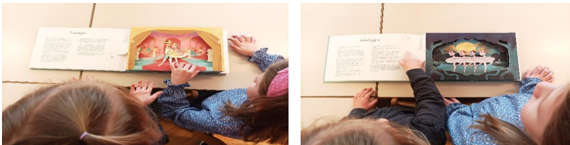
Slike 8 i 9: Upoznavanje djela „Trnoružica“ i „Labuđe jezero“

Djecu su posebno oduševili glazbeni dijelovi klasičnih baleta koji se nalaze u knjizi. Svakodnevno su prelistavali knjigu i iznova preslušavali djela. Toliko često su koristili knjigu da su već po zvukovima glazbe znali o kojem je djelu riječ. Tako je nastala spontana dječja igra u kojoj bi jedno dijete reproduciralo glazbu iz knjige, dok bi drugo, prekrivenih očiju pokušalo odgonetnuti o kojem je djelu riječ. Ova aktivnost, proizišla iz dječje znatiželje, otvorila je razne mogućnosti za cjeloviti razvoj djeteta (razvoj slušnih sposobnosti, razvoj vizualnih sposobnosti, upoznavanje različitih baletnih djela, stjecanje pozitivnih stavova o baletnoj umjetnosti, razvoj suradnje u zajedničkoj igri).