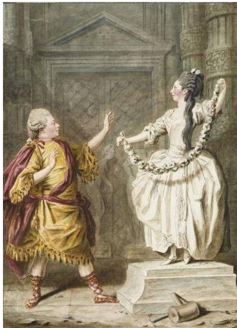
Slika 2: Marie Sallé u baletu „Pygmalion“ 7

Marie Sallé bila je jedna od prvih ženskih koreografkinja. Nastupom u baletu „Pygmalion“ napravila je veliku revoluciju u baletnoj kostimografiji kada je zaplesala u laganoj haljini. Iz kostima je uklonila krutu podsuknju, bluzu i prsluk. 6 Plesala je u korzetu, laganoj haljini i podsuknji, a kosa joj je bila raspuštena (Adulmar, Simončić, 2016).