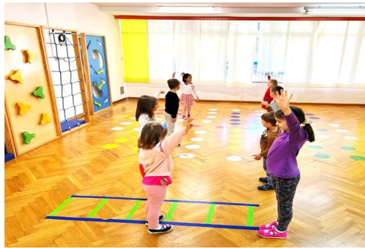
Slika 14: izvedba aktivnosti 2

Prema Maletić (1983) problemi prostora su mnogovrsni; valja se snalaziti u prostoru, prilagoditi mu se, pravilno ga iskoristiti i organizirati. Prva iskustva djeteta u vezi sa spoznajom prostora jesu ta da spoznaju je li nešto blizu ili daleko. Za plesno i scensko izražavanje važno je udaljavamo li se od nečega ili idemo ususret nečemu.