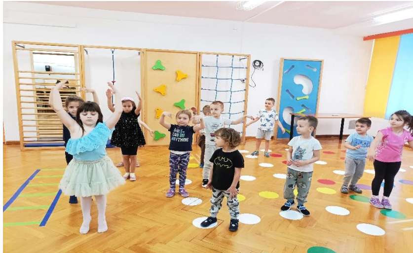
Slika 16: Demonstracija vježbe 1

Samo pojavljivanje djevojčice iz druge skupine kod djece je izazvalo veliki interes. Djevojčica je preuzela ulogu prave trenerice pa se odmah predstavila djeci i rekla im što će im danas pokazati. Uz glazbenu podlogu najpoznatijih baleta djevojčica je najprije počela s razgibavanjem. Zaista je bilo fascinantno gledati kako izaziva interes djece te kako su djeca bez previše poticaja počela imitirati ono što ona radi. Djevojčica im je demonstrirala kako treba izgledati držanje u baletu, kako se balerine razgibavaju, na koji način vježbaju te koji su osnovni koraci. Na kraju aktivnosti djeca su se zajedno prepustila slobodnim plesno-pokretnim kreacijama.