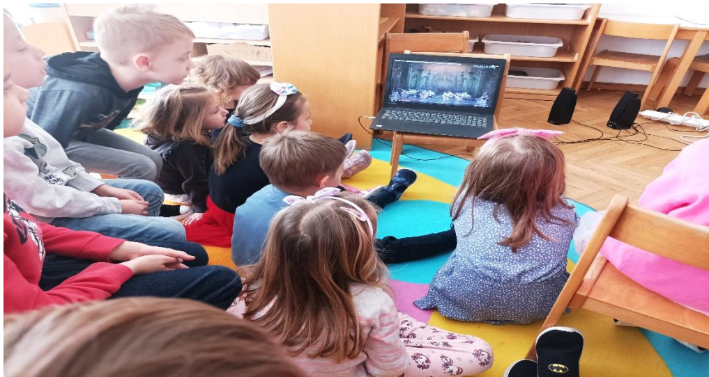
Slika 10: Gledanje baleta „Trnoružica“ u sobi dnevnog boravka

Nakon završene aktivnosti odgojiteljica kao najveći uspjeh smatra rušenje rodni predrasuda u baletu. Kada bi se u ustanovama za rani i predškolski odgoj i obrazovanje, a kasnije i u školama, više pričalo o tematici rodni predrasuda u baletu, djeca bi zasigurno maknula tu stigm u društvu.