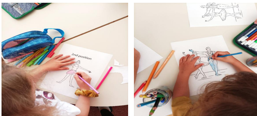
Slike 20 i 21: Bojenje baletnih likova

Aktivnost „Male balerine“ kod djece je pobudila najveći interes za baletnu umjetnost, pa je odgojiteljica djeci ponudila još neke materijale koji će im pomoći za upoznavanje baleta. Kako djeca iz ove vrtićke skupine izrazito vole aktivnosti poput bojenja, rezanja, lijepljenja i sl., odgojiteljica je pripremila različite aktivnosti gdje djeca mogu birati što žele raditi. Uz pomoć ovih materijala djeca razvijaju svoje grafomotoričke vještine (bojenje, rezanje, lijepljenje) i maštu te upoznaju baletni svijet iz još jedne perspektive.