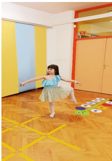
Slika 19: slobodno plesno izražavanje

Tijekom ove aktivnosti zadovoljene su sve prethodno spomenute mogućnosti za cjeloviti razvoj djeteta.