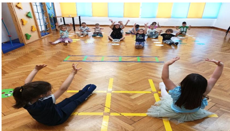
Slika 15: razgibavanje tijela

Posjetivši susjednu skupinu u vrtićkom objektu, odgojiteljica je primijetila jednu djevojčicu kako u sobi pleše balet. Prišla joj je s oduševljenjem, što je djevojčici jako imponiralo. Odmah se pohvalila kako ona trenira balet u Baletnom studiju HNK Split. Odgojiteljica je potom zamolila djevojčicu bi li te plesne korake ponovila u dvorani, ispred djece iz njezine skupine. Djevojčica se oduševila i već sutradan došla s haljinicom, kako bi što vjerodostojnije djeci demonstrirala svoja plesna umijeća.