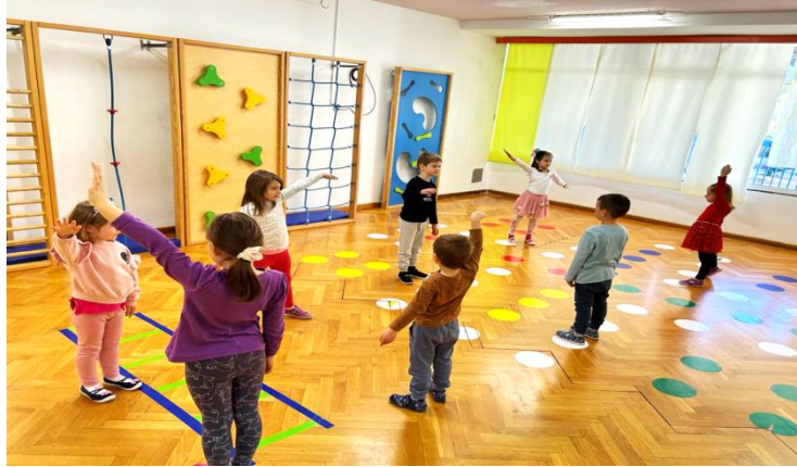
Slika 13: izvedba aktivnosti 1