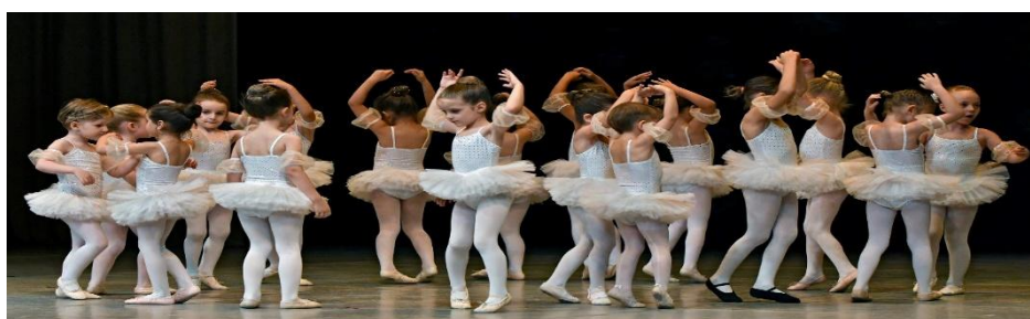
Slika 4: Polaznice baletnog vrtića 12

Na samim počecima postojanja Baletnog studija HNK-a Split nije postojala grupa koja je uključivala djecu vrtićke i predškolske dobi. Za početak rada vrtićke grupe baleta zaslužna je plesna pedagoginja Buga Bešker koja je, uz podršku voditeljice studija Albine Rahmatulline i tadašnjeg ravnatelja baleta Dinka Bogdanića, 2016. godine započela prvu takvu grupu. Do 2016. godine postojala je predškolska grupa djece u Baletnom studiju, ali tu su se upisivala samo djeca koja dogodne kreću u školu. Stoga je 2016. godina bila prekretnica jer su se počela upisivati djeca od 3. godine, a bilo ih je čak nekoliko i u dobi od 2 godine.