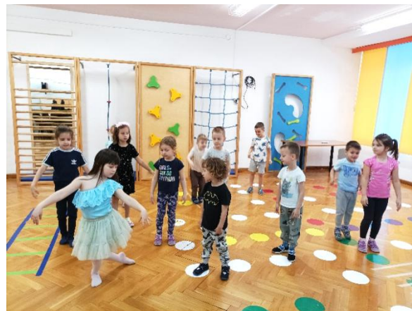
Slike 17 i 18: Demonstracija vježbi 2 i 3