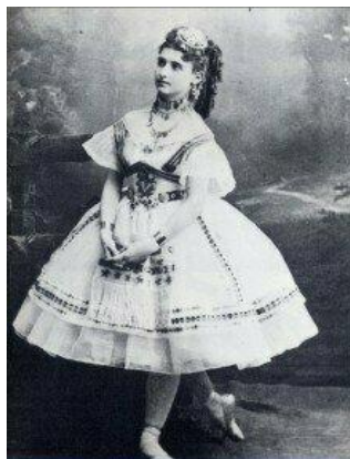
Slika 3: Giuseppina Bozzacchi u baletu „Coppélia“ 10

Početkom 20. stoljeća koncepcija baleta postaje precizna i ističe se ljepota linije (Zdeličan, 2018). Pojavile se su se cipelice sa špicom koje plesačima pružaju bolji oslonac od dotadašnjih mekanih. U ovom razdoblju postaje vidljiva spolna ravnopravnost u plesu, muškarci i žene plešu u jednakoj mjeri.