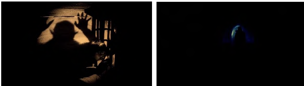
Abbildung 8 Abbildung 9

„den wir die Treppe hinaufsteigen sehen, oder er hängt sich einem Aasgeier vergleichbar über den Schlafenden.“ 98