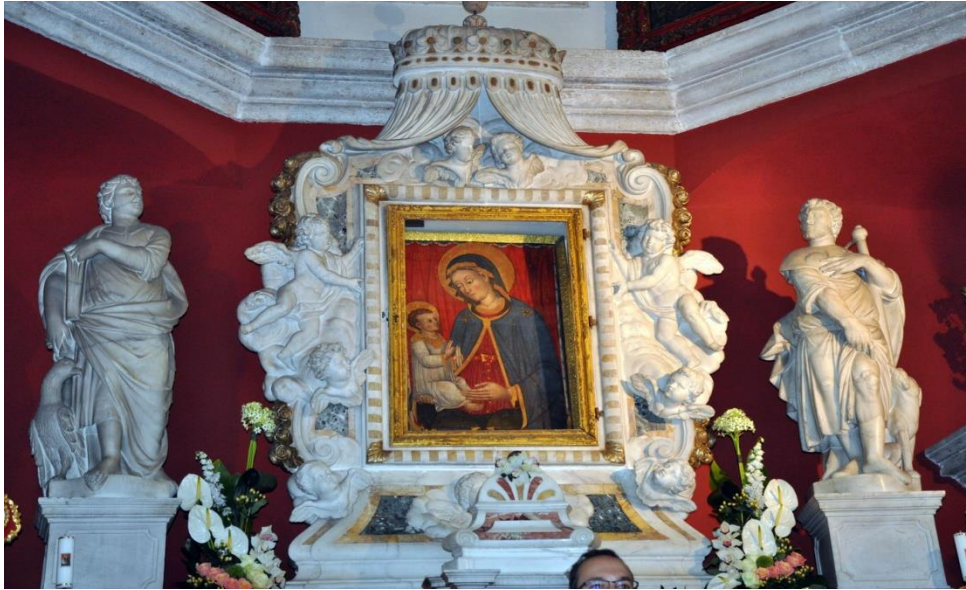
Slika 9. Kipovi glavnog oltara