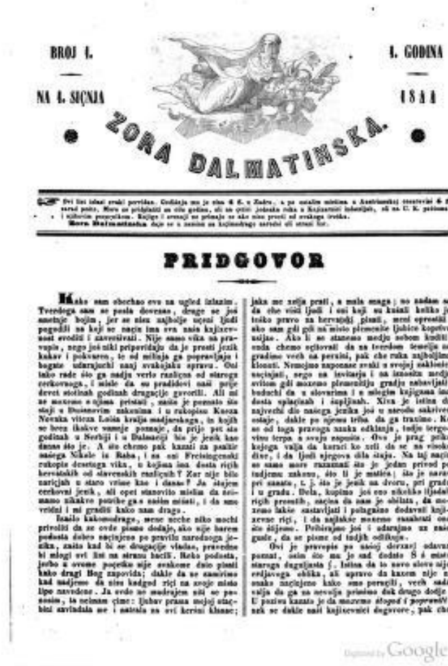
Slika 2. Pridgovor Ante Kuzmanića Zori dalmatinskoj

chemo očitovati da ne tverdom temelju ne gradimo vech na perxini, pak che ruka najboljima klonuti. 56