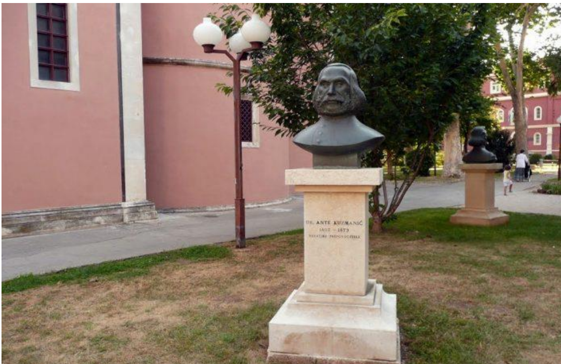
Slika 1. Kip Ante Kuzmanića u Zadru

Godine studija za njega su bile i više od pukog studiranja jer je upravo tada on stekao svoje enciklopedijsko znanje. Kuzmanić nije bio osoba koja je sebe ograničila na samo jedno zanimanje te je stoga bio zainteresiran za šira područja života. Između ostalog je proučavao Ivana Lučića i djelo De regno Dalmatiae et Croatiae . Kako i znamo, Lučićevo je djelo sinteza i prikaz najranije povijesti Dalmacije i Hrvatske iz koje je Kuzmanić vrlo vjerojatno i izvukao temelje nekim od svojih kasnijih stajališta. Također je ovo djelo bilo jedno od ključnih i temeljnih djela u njegovom vrsnom poznavanju slavne hrvatske prošlosti na koju će se uvijek pozivati. Knjižnica koju je svakodnevno posjećivao u Beču, za vrijeme kada nije studirao i učio, bila je njegov drugi dom gdje je Ante Kuzmanić širio svoje vidike. Osim hrvatske povijesti, proučavao je i djela o botanici i o tome kako se brinuti o uzgoju biljaka, voća i povrća. Kuzmanić je kroz svoje tekstove davao i savjete o poljoprivredi, a uz to je i razgovarao sa seljacima o njihovom poslu te im pritom pomagao. Može se reći da je on bio iznimno svestran čovjek.