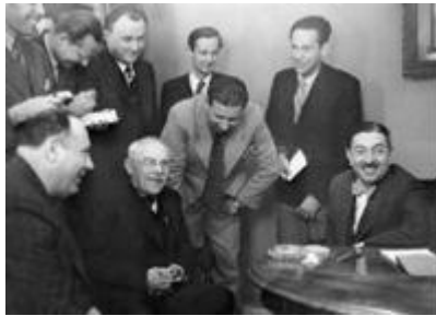
Slika 7. Zajednička slika aktera sporazuma

hrvatskoga naroda. Osim toga, Mačeka su ovlastili da i dalje poduzima određene korake na unutarnjem i vanjskom planu držeći se načela da su “opstanak i sloboda hrvatskog naroda iznad svega”. Maček je tijekom pregovora nastojao dobiti suglasnost Udružene opozicije da pregovara i u njihovo ime. odnosno da se i oni uključe u pregovore, ali dio Udružene opozicije iz Srbije i dalje je smatrao da prednost mora imati uspostava stranačkog političkog života i demokratizacija, a ne hrvatsko pitanje. Bez obzira na sva nesuglasja i zastoje, pregovori su završeni relativno brzo. Sporazum Cvetković-Maček sklopljen je 26. kolovoza 1939. godine u psihozi nadolaska rata, svega pet dana prije njegova izbijanja. 41