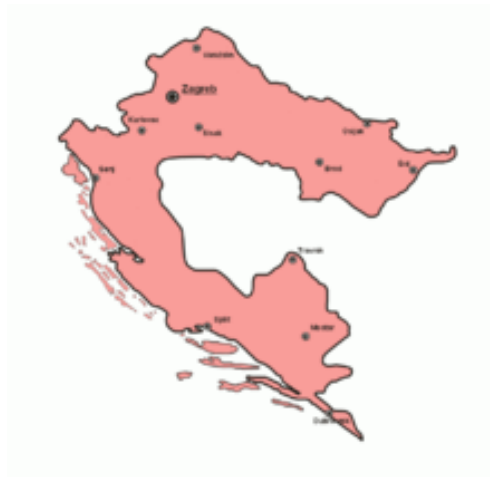
Slika 8. Banovina Hrvatska

Sutradan, 27. kolovoza, po sklapanju sporazuma s Cvetkovićem Maček je na sjednici Hrvatskog narodnog zastupstva istakao da se radi o djelomičnom sporazumu, jer da se do potpunog nije moglo doći. Maček je želio reći kako konačni teritorij Banovine nije utvrđen i kako će hrvatska strana potraživati više te kako će se u naknadnim pregovorima morati i proširiti autonomija Banovine u odnosu na Beograd. Međutim, nema sumnje da je s ostvarenjem hrvatske autonomije unutar Jugoslavije Mačekova politika dosegla svoje ciljeve. Bilo je mnogo protivnika sporazuma i među članovima HSS-a bilo je onih, koji su smatrali da je Maček dobio premalo. Još više napada takve vrste Maček je otprio s nacionalističke desnice, „frankovaca” i drugih, koji će se kasnije uglavnom priključiti ustaškom pokretu. Oni su ga proglašavali izdajicom, zastupajući stav da je jedino rješenje “hrvatskoga pitanja” u izdvajanju iz Jugoslavije. S druge strane, srpski nacionalisti i konzervativci doživljavali su sporazum Cvetković-Maček kao kapitulaciju pred Hrvatima. Iako se tada činilo da se sporazumom Cvetković-Maček zapravo spašava Jugoslavija, pokazalo se upravo suprotno on je “nehotice dokazao ograničenja centralističkog jugoslavizma i otvorio put alternativnim rješenjima”. 43