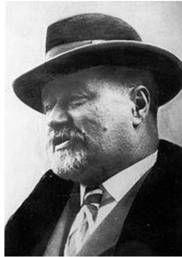
Slika 2. Stjepan Radić

Ubojstvom dr. Đure Basaričeka i Pavla Radića, smrtnim ranjavanjem Stjepana Radića, težim i lakšim ozljedama dr. Ivana Pernara i Ivana Grandže 20. lipnja 1928. godine u državnoj skupštini u Beogradu počinje nova faza obračuna vladajućeg režima s hrvatskom oporbom, faza fizičke likvidacije njezinih prvaka ili istaknutih pripadnika. Atentat je izvršio Puniša Račić, poslanik srbijanske Radikalne stranke u vrijeme zasjedanja državne Skupštine. Račićev javni obračun revolverskim hicima s prvacima Hrvatske seljačke stranke, a bili su zasigurno namijenjeni ne samo njima i Stjepanu Radiću kao glavnoj meti nego i Radićevu tadašnjem suradniku u Seljačko-demokratskoj koaliciji Svetozaru Pribićeviću, izazvao je veliko zanimanje javnosti u Kraljevini SHS, ali i oprečne reakcije. 10