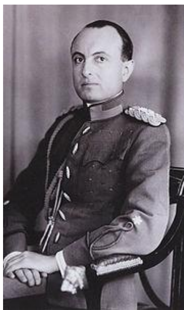
Slika 4. – Knez Pavle Karađorđević

Aleksandar je za sobom ostavio tri sina, od kojih je najstariji bio jedanaestogodišnji Petar. Umjesto malodobnog Petra, kraljevsku su vlast preuzeli namjesnici, Aleksandrov bratić, knez Pavle Karađorđević, senator i ministar prosvjete Radenko Stanković te ban Savske banovine dr. Ivo Perović. Vlast je de facto pripala knezu Pavlu, jer su druga dva namjesnika svedena na “prisutne građane”. Knez Pavle bio je u načelu blizak idejama zapadne demokracije, ali je istovremeno tražio načina da u zemlji očuva unitarno jugoslavenstvo. U sljedećim godinama bio je suočen s vrlo jakim unutarnjim i vanjskim pritiscima. Nastojeći na svaki način Jugoslaviju održati izvan rata koji se ubrzano približavao, počeo je raditi kompromise nauštrb demokracije, pa će stoga biti popustljiv prema desničarima i nacistima. Istovremeno, Pavle Karađorđević ni izbliza nije stekao karizmu svoga bratića Aleksandra, pa ni situaciju u državi nije mogao tako neposredno kontrolirati. 25