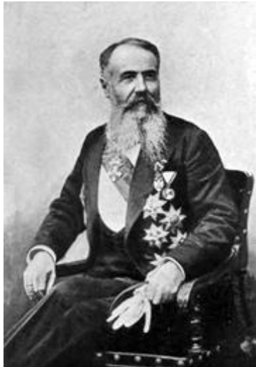
Slika 1. Nikola Pašić