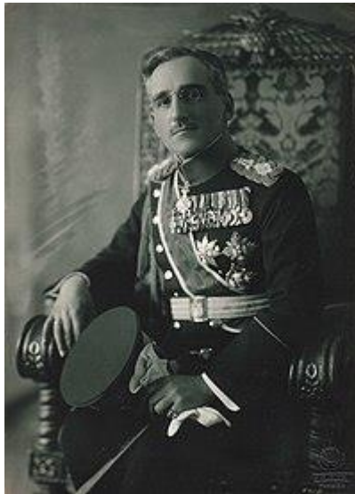
Slika 3. – kralj Aleksandar I. Karađorđević

nestalo je otvorenog apsolutizma. ali su de facto diktatura i apsolutizam preoblikovani u novo, tobože prihvatljivije ruho. No, temelji šestojanuarskog režima su ostali: integralno jugoslavenstvo i praktički ničim ograničena kraljevska vlast. Prema ustavu, kralj je simbolizirao “narodno jedinstvo i državnu celinu” što je drugim riječima bila unitaristička ideologija i centralistički državni ustroj. 14