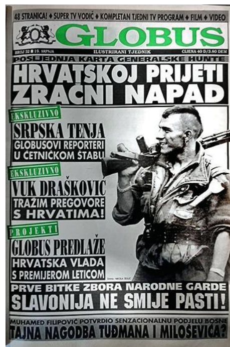
Slika 2.. Naslovnica Globusa (9. srpanj 1991.)

Sam urednik je naglasio kako je njegov cilj kroz članke oblikovati hrvatskog ratnika, što je imalo izrazit uspjeh kod čitatelja. Ono što je zanimljivo, identitet hrvatskog ratnika nastaje po uzoru na američke ratnike, što ističe i Darko Hudelist – Globus predstavlja nastavak opsesije