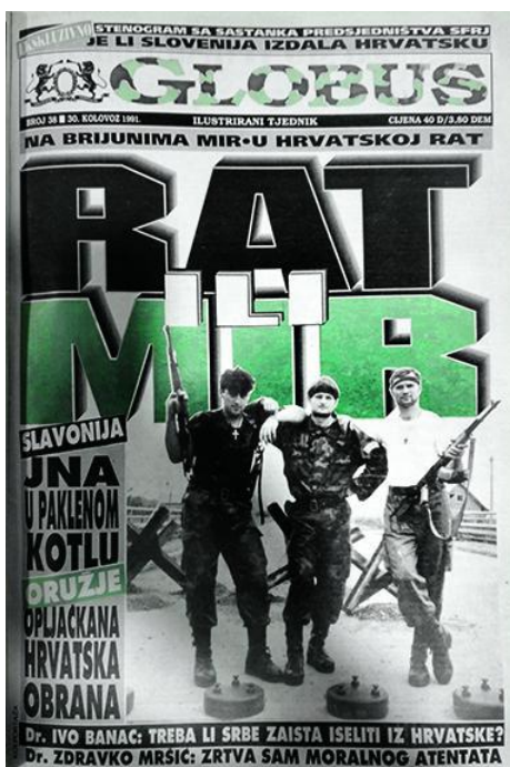
Slika 1.. Novi izgled naslovnice Globusa (30. kolovoz 1991.)

U odnosu na većinu drugih novina koje su se u ratno vrijeme bavile unutarnjom i vanjskom politikom Republike Hrvatske te odnosima s međunarodnom zajednicom, težište Globusa je usmjereno na ulogu hrvatskih branitelja i situacija na ratištu. Sa sjedištem u Zagrebu, novine u javnost počinju izlaziti krajem 1990. godine pod uredništvom Denisa Kuljiša. Već nakon rata na teritoriju Slovenije novine postaju ratni magazin. Njegova su najznačajnija obilježja bombastični naslovi i slike te mega format. 53 Na naslovnica novina najčešće su se nalazili hrvatski vojnici-ratnici, a tekst oko fotografija obojan je maskirnim bojama (Slika 1). Jedna od prvih naslovnica takvoga izgleda bila je u broju objavljenom 19. srpnja 1991. godine, a prikazuje hrvatskog branitelja u vojnoj odori (prikazan je kao nekakav glumac ratnoga filma američke produkcije). Ubrzo je ta fotografija obišla svijet. (Slika 2.)