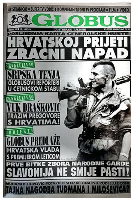
Slika 2.. Naslovnica Globusa (9. srpanj 1991.)

Sam urednik je naglasio kako je njegov cilj kroz članke oblikovati hrvatskog ratnika, što je imalo izrazit uspjeh kod čitatelja. Ono što je zanimljivo, identitet hrvatskog ratnika nastaje po uzoru na američke ratnike, što ističe i Darko Hudelist – Globus predstavlja nastavak opsesije