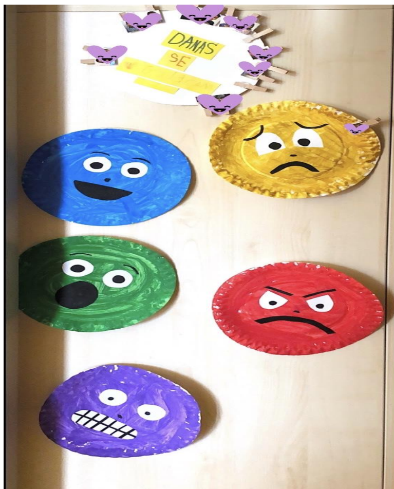
Slika 4 – „Danas se osjećam..“

Odgojiteljica procjenjuje kako je djevojčičina razina dobiti u aktivnosti visoka jer djevojčica pokazuje očigledne znakove zadovoljstva sudjelovanjem u aktivnosti, no zadovoljstvo nije bilo prisutno tijekom cijele aktivnosti. Razina uključenosti djevojčice u aktivnost je visoka. Postoje jasni znakovi uključivanja djevojčice u aktivnost, no oni nisu uvijek prisutni.