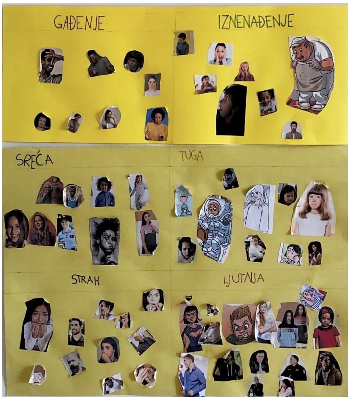
Slika 2 – plakat „emocije“