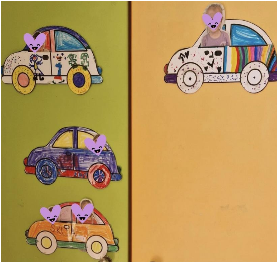
Slika 5 – Želim se igrati s tobom.