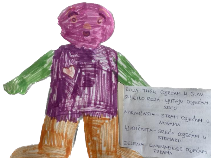
Slika 3 – „Gdje osjećam emocije?“

Aktivnost je trajala 30 minuta. Odgojiteljica procjenjuje kako je subjektivna dobrobit djevojčice u aktivnosti izuzetno visoka, djevojčica izgleda sretno, opuštena, otvorena prema okruženju. Razina uključenosti B.B u aktivnost je izuzetno visoka. Djevojčica je potpuno fokusirana, ustrajna u aktivnosti i koncentrirana bez prekida.