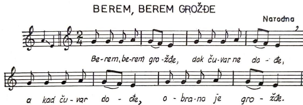
Slika broj 3. Notni zapis i tekst pjesme Berem, berem grožđe (Manasteriotti, 1978)

proširuju znanja i iskustva djece u raznim područjima prirode i okoline, obogaćuju materinski jezik pa time pridonose intelektualnom razvoju djeteta (Manasteriotti, 1978). Pjesma Berem berem grožđe korištena je kao primjer u ovome radu, a na slici broj 3 prikazan je notni zapis i tekst koji se pjeva u igri: