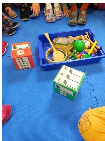
Slika 6. Igra „Ritam kocke“