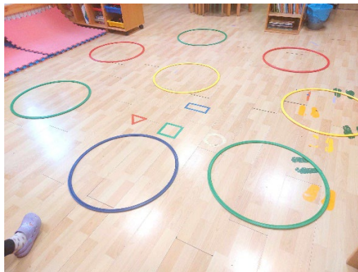
Slika 7. Pokretna igra „Uskoči“