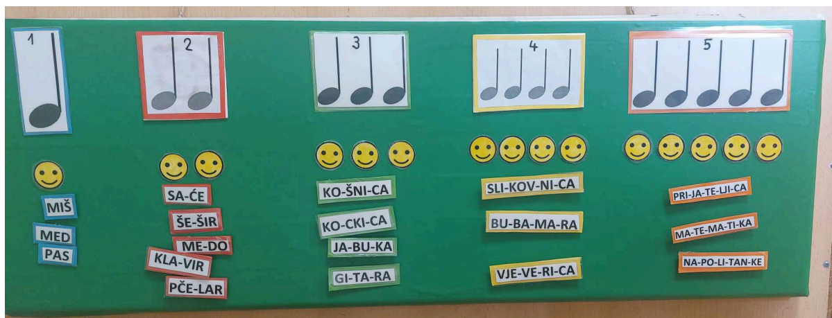
Slika 4. Igra „Slog po slog“