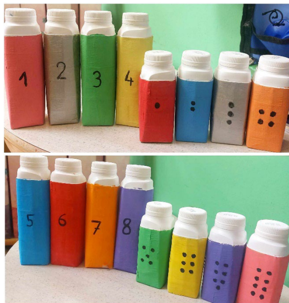
Slike 5. „Zvučni memory“

čemu su im pomogli brojevi i krugovi označeni na svakoj šuškalici. Jedna djevojčica se usred igre sjetila kako bi na drugi način mogli igrati ovu igru i uzbuđeno objašnjavala odgojiteljici i ostaloj djeci. Njezina ideja je bila varijacija igre „Slijepi miš“ tako što je predložila da jedno dijete stane u sredinu kruga zatvorenih očiju i tako opipom traži šuškalice i osluškuje njihove zvukove dok ne pronađe dva ista. Ideja se djeci jako svidjela te su odmah djevojčici koja je sjedila u krugu zatvorenih očiju pružali svoje šuškalice i pomagali joj oko pogađanja koje su iste. Svi su htjeli biti u ulozi „Slijepog miša“ te, iako nisu imali povez preko očiju, cijelo su im vrijeme bile zatvorene oči bez virenja. Djeca su toliko bila pod dojmom aktivnosti da su odmah po završetku aktivnosti bez prisustva odgojiteljice samostalno igrala memory grupno u krugu i za stolom u parovima.